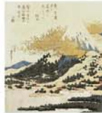
葛飾北斎『富士図』(前期展示) ジョルジュ・レスコヴィッチ氏蔵

◆前期:開催中～8月4日(日) 後期:8月6日(火)～9月1日(日) 10時～17時 月曜、8/13休館(8/12は開館) 大和文華館(近鉄線・学園前駅) 一般950円、大高生730円【問】0742-45-0544