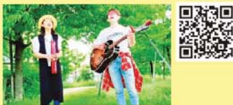
ストリートライブデュオ「カナン」