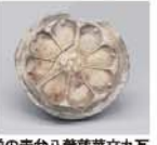
難波宮遺跡以前の藤原八雲蓮華文丸瓦 難波宮跡出土 7世紀前半 大阪市教育委員会蔵

◆開催中～8月26日(月) 9時30分～17時 火曜休館(8/13は開館) 大阪歴史博物館 6階特別展示室【問】06-6946-5728 5組10名