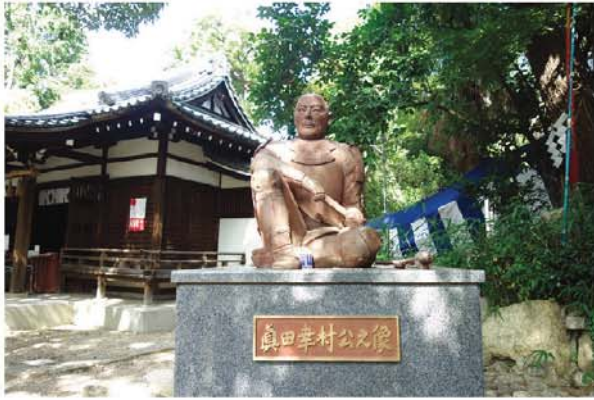
真田幸村の銅像。直木は生前、建立を提言していた。 (大阪市天王寺区連阪1丁目の安居神社)