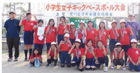
3位、▲「三津屋」連合。▶「北中島」連合。皆さん、おめでとうございます！お疲れさまでした。