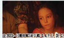
© 2023 - LUMERENCIAFILMS S.R.L. P.I. DE G.V. LATERNATELLI PALOMA PRODUCTIONS ALPHAVIOLETTIPRODUCTIONS

7歳の少女ソルの父は闘病のため別居中、彼女の願いは「パパが死にませんように」。親戚一同が企画した父の誕生日パーティ当日。あわただしく準備をする叔父叔母、無邪気な従妹たちの中で待ち続け、ようやく父に再会できたソルは…。