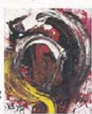
白壁一雄(作品)1962年 奈良県立美術館蔵(大橋コレクション)

◆11月26日(土)~12月25日(日) 9時~17時 月曜休館 奈良県立美術館 一般400円、大高生250円、中小生150円【問】0742-23-1700