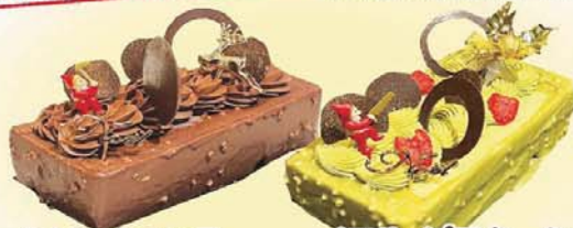
ノエル・ショコラ 5,300円