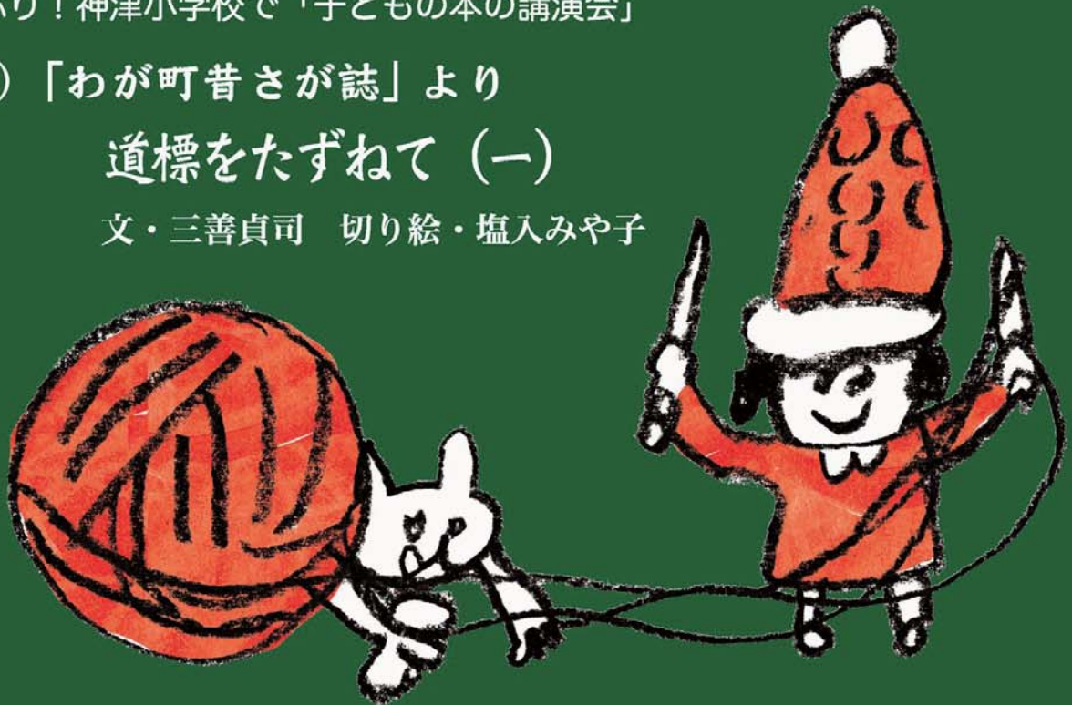
イラスト・まつおか たかこ