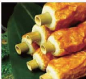
●寒くなる時期、ちくわをはじめ、練り物、厚揚げ、こんにゃく、大根…、自慢のおでんを敷いて、おうちごはんをお楽しみください。