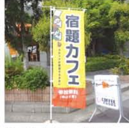
十三東にあるカフェボナボン。お弁当代（100円～300円）は子ども食堂や宿題カフェの運営に充当。「毎食の支度は大変。忙しい親御さんの時間的なサポートにもなれば」

「子ども食堂」や「宿題カフェ」に取り組み「カフェボナボン」が、主にひとり親世帯を対象にして、余剰食材等を利用して低価格でお弁当を提供する「支援の輪」という試みをスタート。