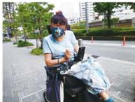
毎週金曜日、関西電力本社前での反原発行動も、マスク着用で。