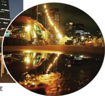
偶然見つけた工事現場内の期間限定カフェ。今はもうありません。

私が自家焙煎の珈琲と出逢ったのは2年前、都会の下真ん中にあった工事中の空地でのごとでした。