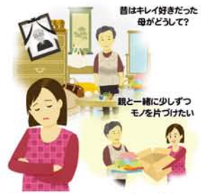
生前整理の7つのステップは、①思い出しのモノを整理する ②写真を整理する ③エンディングノートを作成する ④自分の葬儀をプロデュースする ⑤やり残し（やりたいこと）リストを作成する ⑥大切な人にメッセージを書く ⑦5年後の未来にプランニングする、です。参考してください。（生前整理アドバイザー・金山佳子）

モノを大切に、捨てることに罪悪感がある世代です。「捨てたら？」という言葉は喧嘩のもとになり禁句です。モノと思考は繋がっている、片づけをする中で「親がどのように生きてきたのか」を聞くチャンスと捉え、思い出しに寄り添いながら進めるのがポイントです。焦らず少しずつやってみてください。