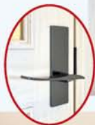
ドアノブと丁番をチェンジ!

築20年、もともと濃茶のフロアリングと、金色のドアノブが光る白い建具がコーディネートされたエレガントなスタイルのお部屋でした。 そこで、白い建具はそのままに、ドアノブをブラックに変え、床は白いフロアリングに張り替えることで、フレンチシックな空間へと生まれ変わりました。