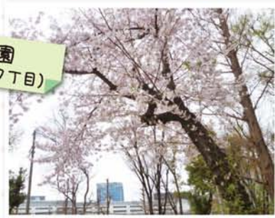
西町公園 (西中島7丁目)

淀川区内では？ 十三公園事務所を尋ねると、「毎年お花見をする方で賑わっているのは、十八条東公園、田川公園、三津屋中央公園でしょうか。お隣の西淀川区も含めると、大和田川公園、中島公園、歌島公園、竹島西公園、竹島南公園、西淀公園、新淀川公園など。また種類で見ると、十三公園では、ソメイヨシノが終わった頃に御衣黄が咲き始め、珍しいねと足を止めてくれる方が多いです」と教えてくれました。いつものお散歩コースに、ちよつぱり足を延ばしたいときに、桜スポットを加えませんか？