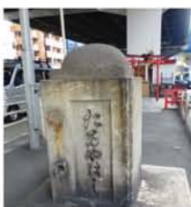
「樽屋橋」の親柱(天神西町)。

北区にある扇町公園を要に阪神高速守口線が通ります。その下が天満堀川跡で、中之島付近の堂島川へ通じていました。慶長3年(1598)に豊臣秀吉が綿屋、酒屋、乾物屋、麴屋、樽屋などの水運の便を図り、開削を命じた堀川です。現在の扇町公園が堀留で、汚濁がひどかったのを、水流を良くするために、天保8年(1837)「大塩平八郎の乱」の翌年、今でいう失対事業で現 OAP 北の旧淀川まで延伸しました。