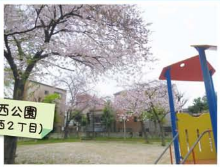
木川西公園 (木川西2丁目)

昔ながらの住宅街の小さな公園。幼児用のすべり台がある。ママ友とお弁当持参で、花見ランチが楽しめそう。