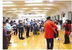
午前中は、展示ブースを巡回して互いの取り組みに学び合い、午後からは、代表団体によるシンポジウムとトークリレー。最後は「まちの縁側」ソングを歌い、次回開催に弾みをつけました。

「居場所」に関わる人、興味ある人、各地から集う名古屋で初開催「まちの縁側大博覧会」 2月29日、名古屋市公会堂で「まちの縁側大博覧会」が開かれ、全国各地から、地域で居場所を運営する人、関わる人、居場所に興味のある人が集まりました。 当日は、新型コロナウイルスの感染予防対策で急ぎよ規模縮小となりましたが、10団体が出展参加し、大阪からは、淀川区に拠点を置く「みつや交流亭」が事例発表の役を担いました。