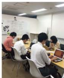
朝礼後、作業開始。「悩んでいるときに大学生やメンターに道を相談できる。ここは自分から積極的に質問する場所」と高校生。

「僕が中2の冬に父の店がつぶれ、両親が離婚。父と暮らし始めましたが、高校では練習試合に行くお金がなく部活をやめたり…塾もバイトして行きました」 平井さんは一浪後、奨学金な