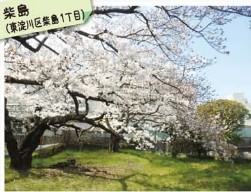
柴島 (東淀川区柴島1丁目)

柴島浄水場の堤防側の通りを東へ。長柄橋のたもと、現龍大神の祠の脇の一角にある大木。見上げると見事な枝振りが空を覆う。人通りが少なく、ゆく春を静かに満喫できる。