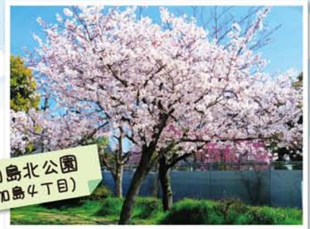
加島北公園 (加島4丁目)

細長い公園の奥にピンク色の木々。子どもたちの笑い声とジャングルジムから眺める風景がグッド。