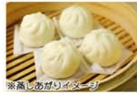
※蒸しあがりイメージ

横浜中華街の広東料理店「招福門」から肉まん材料キットが新発売。皮部分の粉と味付きの餡がセットになっているので、こねて包んで蒸すだけで完成。小さなお子さんでも遊び感覚で作れます。春休みやゴールデンウィークに、親子で肉まん作り体験しませんか?