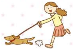
十三公園 (十三元今里1丁目)