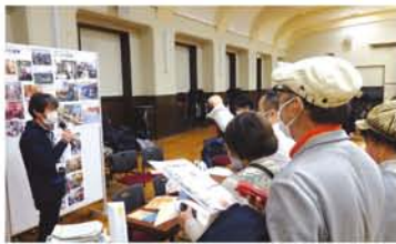
淀川区・三津屋商店街にある「みつや交流亭」。大阪市職員労働組合と市民との協働運営であることが注目されたほか、商店街の通行人も傍聴OKのオープンスペースでの総会や各催しが、「オープンさぎる! さすが大阪」とうけていました。(12頁で「みつや交流亭」の催し紹介)

「居場所」に関わる人、興味ある人、各地から集う名古屋で初開催「まちの縁側大博覧会」 2月29日、名古屋市公会堂で「まちの縁側大博覧会」が開かれ、全国各地から、地域で居場所を運営する人、関わる人、居場所に興味のある人が集まりました。 当日は、新型コロナウイルスの感染予防対策で急ぎよ規模縮小となりましたが、10団体が出展参加し、大阪からは、淀川区に拠点を置く「みつや交流亭」が事例発表の役を担いました。