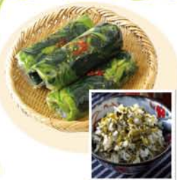
●新漬けも愛用あるとがしめお祭菜に頼りまき♪高菜と枝豆と豚肉も炒めても、おなか美味いぞ。新漬けも炒めてラーメンの具にするのも一興でしょう。