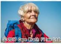
© 2017 Cape Wrath Films Ltd.

【観】一般1,800円 大専1,500円 シニア1,200円 高以下1,000円