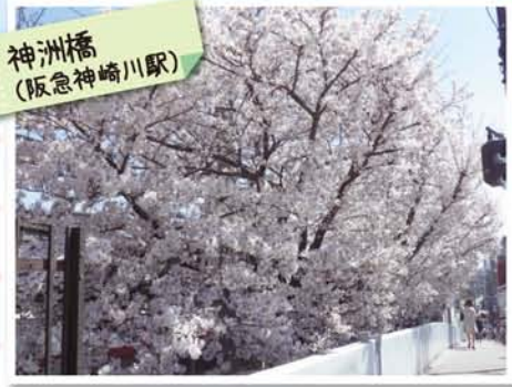
神洲橋 (阪急神崎川駅)