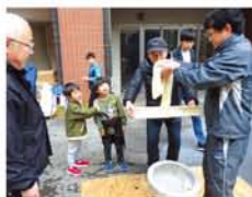
つきたてのお餅はよく伸びて、子どもたちはビックリ。

「もちつき大会」がある12月。皆さんはいくつもちを食べましたか? 15日、木川地域活動協議会では、木川小学校でももちつき大会を開催(写真左)。開始前から並ぶ子がいるほど人気で、来場者は約800人。