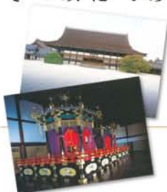
京都御所の絵葉書：紫宸殿(上)高御座と御帳台(下)

京都御所近くでランチの後、「護王神社」へ。ここは狛犬ならぬ阿吽(あうん)のイノシシが参拝者を出迎えます。足腰