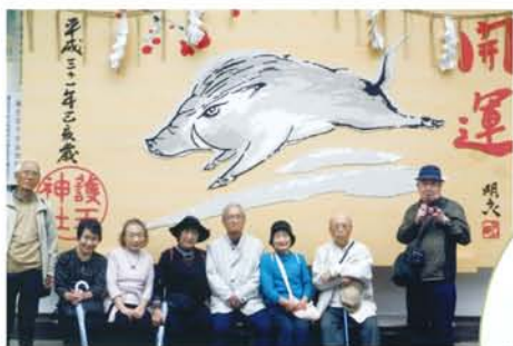
護王神社の大絵馬の前で。昨年の干支はイノシシでした。