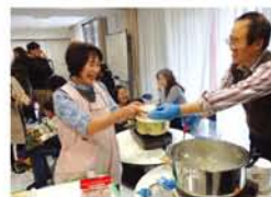
「餃子の皮を作ったのは初めて、もちもちで美味しい」と参加者。