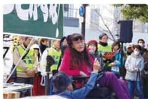
12月8日、 関電前の集会で。