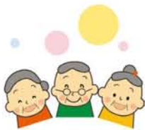
「介護は正直しんどい、でも施設には入れたくない」。介護をしている人たちが集まって、日々のことを話しています。

「介護や認知症の話語り合える場に」と、昨年7月から、毎月第2火曜日の午後、西中島にある浅井ビル1階が開放されています。