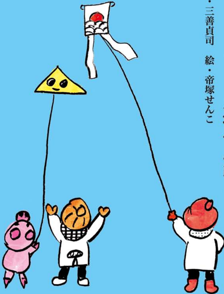
イラスト・まつおか たかこ

★発行所…淀川通信舎 〒532-0023 大阪市淀川区十三東3-12-27 ★編集・発行人…乃美夏絵 ★毎月25日発行 ★発行部数:90,000部 Tel.06-6301-8370 Fax.06-6838-3881 ☒編集部:hensyu@the-yodogawa.jp 営業部:eigyo@the-yodogawa.jp