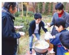
調理士免許を持つ若手班がアルファ米を炒飯に。大好評でした。