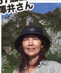
▲3年前駒ヶ岳に登った時の1枚

もうシミケアは色々使いました。思い切って高いのも試しましたが、すぐに効果はでないし、続けられなくて…。しかも、段々目立つてる気がして、諦めてたんです。