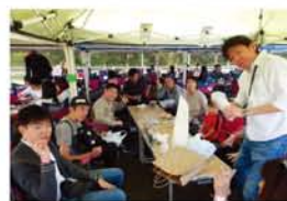
テーマは、「仲間の輪を広げよう」。「当日は約80名が参加し、メンバーは、お肉を焼いたり飲み物を販売したりと大忙しでした」と事務局スタッフ。飲食の後は、お楽しみ抽選会が行われ、お米など豪華景品がプレゼントされました。

の姉は、8年後に探し出し一緒に帰国できたものの、結婚を前に自ら命を絶ちました。理由はわかりません。誰が悪いでもない、戦争が生んだはずみだと思っています」と語り、帰国者や地域住民、約90人がじっと耳を傾けました。