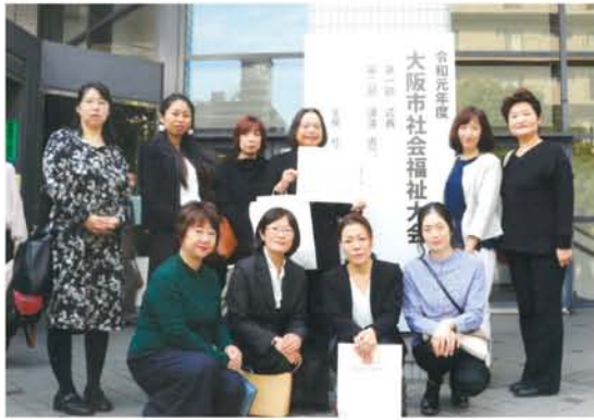
2002年発足以降の功績が評価された「絵本のくに」の皆さん。10月16日、「淀川区民福祉のつどい」で、29日、「大阪市社会福祉大会」で表彰されました。