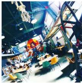
個性的なお店や工場を巡ってお菓子をゲット、写真撮影も楽しいヨ!

10月27日、野中北1丁目周辺のお店やお寺、工場で、ハロウィンイベントが開催されます。メイン会場のカフェ「フガール」では衣装の着替えコーナーがあり、一部無料貸し出しも。また、大阪ベルエール美容専門学校で、フェイスペイントが