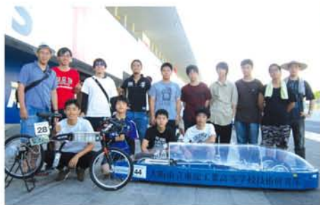
大会当日、東淀工業高校・技術研究部の出場者、顧問、仲間と。