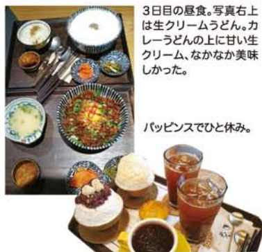
3日目の昼食。写真右上 は生クリームうどん。カ レーうどんの上に甘い生 クリーム、なかなか美味 しかった。