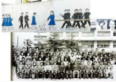
現在の十三中の壁画と、懐かしい先生方の写真。「同窓生やそのお子さんがこの記事を読んで、まだ知らない人にも情報が届くよう願っています」と監さん。

十三中学校を81年に卒業した学年の同窓会が、11月10日に西中島のホテルマイステイズ新大阪で開催。現在、発起人の6名が準備を進めています。「9年前、同級生と再会したことがきっかけで、今では40人のライングループがで