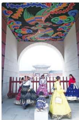
(上)韓服を着た私と息子。 (左)景福宮の入口、光化門。

洞へ…のほろ子連れ旅はそうス ムーズにいきません。宿泊 先の近くに児童公園を見 つけ走つていく颯大：現 地の子どもたちに混じっ てガツリ遊びだしちやい ました。いやいや〜ここソ ウルなんですけどお…早