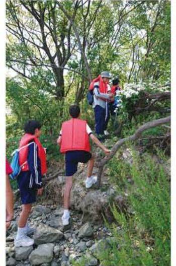
中学生の体験学習。プロジェクトのメンバーが樹木や生物について説明。

「豆島で活動が始まってから地域の人たちが環境面に対しても関心を持つようになりました。せっかくだけに珍しい島なので、自然のまま守っていききたい。豆島で地道に取り組んでいることを、いずれは流域全体で