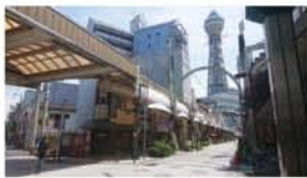
ロケ地。左端に自転車屋があった設定。

日本各地を舞台に展開する推理小説。物語の転換点となる地として大阪の新世界が登場します。通天閣本通が映画版のロケ地で、清張に「原作を超えた」と言わしめた不朽の名作。