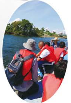
藻川漁業協同組合の船で、いざ豆島へ。