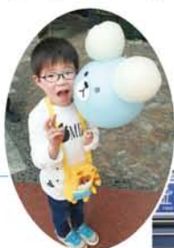
(上)ロッテワールドで、 全部食べられるクマ の綿あめにご機嫌。