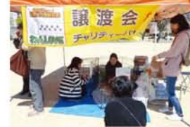
下写真は「桶ストロークストラ」の皆さん。

犬の譲渡会や啓発ブースもあり、「たくさんの方が興味を持って見てくださいました」と喜びの声も。 ご参加、ご来場いただいた皆さま、ありがとうございます。 次回は5月13日、神津神社にて野菜や骨董、手作り雑貨あり。 ★お忘れ物がありました！グレーのネックウオーマーを預かっています。☎63018370