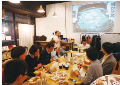
料理の解説を聞きながら試食。「お肉やわらかい」「この厚みでホロッといくのはすごい」「ご飯も美味しい」と参加者。