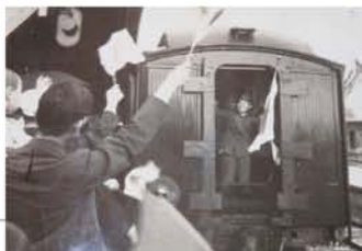
入営する叔父と、旗を降って見送る家族ら。

3月13日に最初の大阪空襲があり、母の里へ家族で疎開しました。大八車を押して八木(樺原市)へ向う途中、関谷のトンネルには、同じような避難民がズットと並んで。父は空堀で防護部長をしとつたんで、また市内へ戻りました。