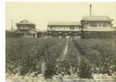
左：神崎川付近 下：十三大橋の完成を祝って