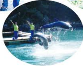
かごかき魚(右上)と鯨のショー。

日本各地に住む姉妹が年に一度、伴侶同伴で集う「むつ美会」。昨年は10月に本州最南端「南紀串本の旅」となりました。