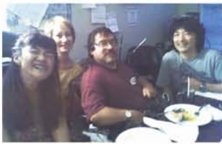
我が家へ食事へまねいた時のボブ(右から2人目)。

それまで親と住んでいたボブは、1ドルで買った家で生活するにあたり、仲良くしていた友人に「この家は僕ひとりには大きすぎる。僕の介護をすればタダで住めるよ」と同居をもちかけ、ガールフレンドとの結婚を考えていた友人はボブとの同居で新居を手に入れました。そのうち友人夫婦に子どもが生まれ、私たちが知り合った頃には25歳になっていた彼らの息子と3人でボブの世話をし、ボブは子どもの施設の募金を仕事にしているとの話でした。今でも思い出す度に、心がポツとあたたかくなります。