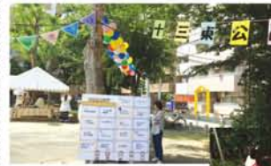
楽しい体験ブースがいっぱい、みんなで出かけませんか？