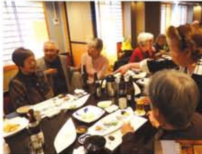
「近場でみんなでゆっくり食事がしたい」との声から懇親会を開催。会では日頃の助け合いのほか、花見や収穫祭など行事も盛り。