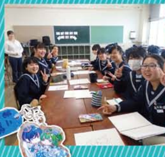
卒業生がデザインしたキーホルダー

「漫画研究部」がある中学校は珍しいようで、大阪市内では2、3校とか。その「漫画研究部」が三国中学校にあり、活発です。