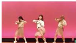
「私たちを見て、自分でもできそう！私の方がイケてる！と元気に活動する人が増えればうれしいです」