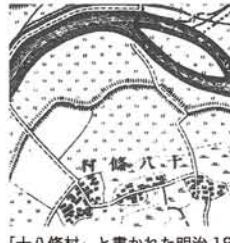
「十八條村」と書かれた明治18年(1885)の地図。上が「神崎川」。

連載のトリは「十三」です。十三は字(あざ)名で「西成郡成小路村字十三」と呼ばれていました。由来は諸説ある中でどの文献も、「淀から数えて13番目の渡し舟が有力」と書かれています。しかし、私は十八条と同じく条里制を採用しています。理由はまず「13番目」の根拠は現守口市にあった「七番と八番の渡し舟」です。確かに淀から七番、八番…十三番と順に並んでいました。ところが「七番」「八番」は渡し舟の順番ではなく、江戸時代に大庭荘(守口市)の村を11に分け、ついた村名だったのです。…(続く)