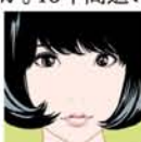
Shiggy Jr.『FALL ABOUT POP!』(通常盤) CDジャケット(2016) ©2019 Eguchi Hisashi

～世界の誰にも描けない君の絵を描いている～ 清楚でタフ、キュートでたおやか。40年間追いつめられた女性の美を、新作を含め約300点のイラストで紹介。 ◆開催中～5月19日(日) 9時30分～18時30分 会期中無休 明石市立文化博物館 大人1,000円、高大生700円 【問】078-918-5400