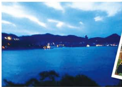
夕方の門司港の海風景。渡し船で10分足らずで魚市場に 行けて便利。台湾や中国からも旅行客が訪れていた。