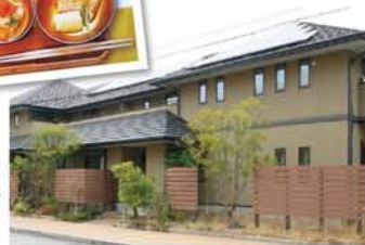
住していたパネコソーラー付き住宅(HPより)

要な電気、家具その他ほとんどが揃っている。徒歩で5、6分のイオンモール、コンビニも近い。緑が多く、芝生のある広大な広場では子供たちの姿も多く見られた。