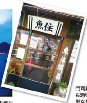
門司駅周辺の住宅街の中にある「角打 ち酒場」。歴史のある魚住酒店の中で簡 単な乾きものを肴に缶ビール、焼酎の お湯割りを飲んで500円ほどだった。