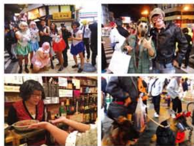
22時30分、十三の交差点に続々と集まるいろいろな人、犬も。店主や他のお客さんとも仲良くなる楽しい一夜でした。

近年になって各地を賑わせているハロウィン。ここ十三でも、飲食店店主らの企画で5年前から「ハロウィンナイト」が繰り広げられ、今年も10月27日22時半、十三の交差点に、仮装した大人たちが大集合。仮装して協賛店を回るとサーブミスがあり、深夜の仮装ホウリング大会も！