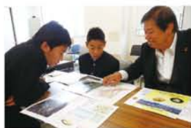
編集部で就労体験中の三国中学生も一緒に取材。「公園が増えるのはうれしいです」と2人。