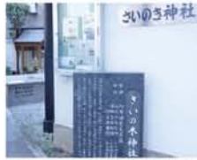
西中島 7 丁目のさいの木神社

新幹線の下を中島大水道が通っていました。本連載「田川」の回で書きましたが、開削を「強行」した三庄屋が自害したと伝わる場所、「さいの木神社」が新大阪駅の南にあります。