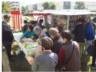
「みかんはバラで買えるの?」「これ、おいしそうやん」。多くの人が来店し、順番待ちの列ができていました。

地域の声に応え、地域と区、企業が連携して大阪市初の「淀川区高年齢者買い物支援事業」としてコープこうべが移動販売を開始。11月16日、市営加島南第二住宅でセレモニーが行われま