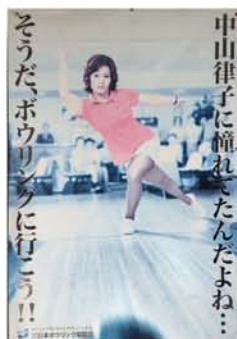
ボウリング場ではおなじみのポスター。

◎イーグルボウルの思い出の写真や、新大阪界隈の古い写真、大募集中！応募は淀川区まちづくりセンター（区役所4階）へ。 ☎06-6309-5656