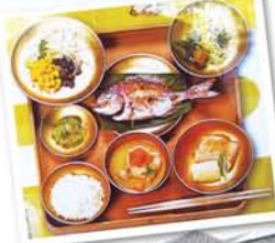
居住住宅近くにある「いのちの旅博物館」で開催されていた「アジアの食」展から、江戸時代に朝鮮通信使を迎えた際の「もてなし膳」。

北九州市は、関門海峡を挟んで山口県下関市と隣接する九州の玄関口。人口98万人余と大きな都市にもかかわらず、森林面積が地域の4割も占め、北には玄界灘(日本海)が、東は周防灘(瀬戸内海)がある山と海に囲まれた自然豊かな町で、古くから農業、水産業が盛んな土地だ。しかし、昭和30年代くらいから公害問題や暴力団抗争、福祉施策に過度に頼る人が増えるなど悪いイメージが付きまとい人口が減少した。こうした評判や公害問題を克服すべく市をあげて解決に取り組んだ結果、現在では環境整備も進み教育や医療施策にも力を注いで、積極的に県外からの移住者呼び込みに力を注ぐようになつたようだ。