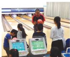
プロボウラーの手が足りず、三前会長も急ぎ子どもたちを指導。

「さまざまな行事が、子どもたちの思い出づくりとなれば」淀川区社会福祉協議会とイーグルボウルの協働事業が始まって、今年で6回目。11月18日、「淀川区子どもまつり」が開かれました。