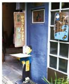
右:門司駅から少し歩いた路地にある、「放浪記」の作家、林芙美子がよく通ったという喫茶店「放浪記」。 左:大昔に大ヒットした漫画「柔侠传」の作者、パロン吉元氏が炭鉱問題の関連取材で訪れたこともあったという、古雅書店。

た、「放浪記」の林芙美子や松本清張、火野葦兵など多くの作家などを輩出して、それらの原作を映画化した名作の舞台ともなっている。門司港からフェリーですぐの有名な「唐戸市場」には2度出かけ、住宅地の一角にある由緒ある酒店経営の「角打ち」では、1940年ごろの日本統治下にあった台湾の隠れた史実の裏話を聞いた。JRで一時間半ほどの久留米市や大牟田市などを訪れ、旧交を温めたり、炭鉱町の隠れた歴史を知る古書店へ足を運んだことも今回の収穫の一つだ。実際に移住となると資金的な準備もあるし、思案のしどころだが、今回のお試し居住で知った北九州には、体調などが許せばもう一度旅したいと思っている。