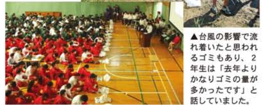
▼地震・津波・台風と、テーマ別に学習発表する3年生美化委員。調査結果は校内に貼り出されています。