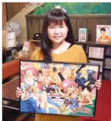
2年前、「お魚絵画コンクール」で大阪府教育委員会賞を受賞。右は、好きなドラマの出演者です。ぜひ、作品展へ。

★作品展決定！12月10日〜25日 みつや交流亭（三津屋商店街内）にて、平日11時〜17時。