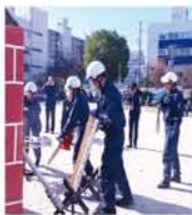
◀地震による倒壊家屋を想定した救出訓練▼園児たちがボンボンやガード、演奏で参加者を応援。「皆さん、がんばってください!」と声を合わせました。