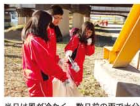
当日は風が冷たく、数日前の雨で水分を含んだごみも多数。廃棄されたバイクの残骸に衣装ケース、泥まみれの工業用シートなど収集ポイントに持っていくのもひと苦労。「運ぶの、重い！」「分別するのも力があるね」と生徒。

英真学園高等学校の生徒たちが「守ろう・残そう・創ろうみんなの淀川水系」を合言葉に開催している河川敷クリーン