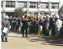
約 350 人が参加。200 人が HUG カードを受付に提示し、記載された被害内容によって、係員の判断で各施設へ誘導、案内する訓練が行われました。

11月19日、木川地域は巨大地震を想定し、木川小学校で防災訓練を実施しました。 今年、HUG（避難所開設ゲーム・災害被害者の状況が記載されている）カードを使って、被害に合わせて小学校