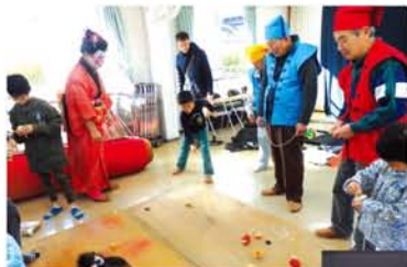
人気の輪ゴム鉄砲をはじめ、コマ回しやけん玉に夢中の子どもたち。 ▶ユーモアたっぷりの人形芝居「ぬくぬく座」の演目は、大人にも好評です。