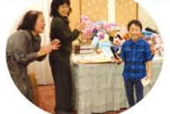
ビンゴ開始後、驚くスピードで一位をゲット！大喜びでした。