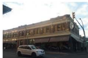
ダウンタウンの一角には写真のようなレトロな建物が立ち並び、写真はカフェ。

では彼らは自己主張しないのか？と言ったらそこはきちんとします。自己主張をする＝自分の意思、意見を相手に伝える、というのと利己的であるというのは違いますし、むしろ自己主張をすることで自分の発言に責任を持つ、もしくは自分を守ることにつながります。世界中から移民を受け入れ、多民族多文化、様々な文化背景を持つ人々が共存するには、やはりお互いの意思を確認しあい、認めあうところからコミュニケーションが始まり、社会が成り立っているのかと思います。そこがほぼ単一の民族と言語で国家が成り立ち、「空気を読む」ことをよしとする日本型コミュニケーションとの最大の違いではないかなと思います。