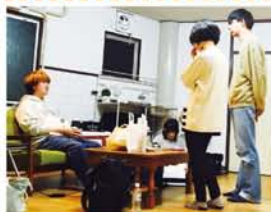
自分の個人ユニット「へろへろガンキョウ」の新作を演出中(写真左)。

と書いています。次は、僕が演劇を始めたように、100年後のどこかの国の誰かが僕の作品を観て、演劇を好きになれること。そんな作品を作り続けて生きていきたい