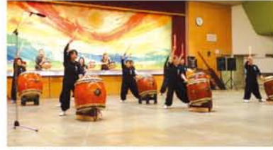
和太鼓「鼓組」の演奏でオープニング。

主催は、大阪祭り衆「鼓組」。淀川区では木川小学校・十三小学校の生涯学習ルームで「和太鼓や音頭・踊り」の教室を開いており、子育て層を中心に人気。近年、両地域の夏の盆踊りは「いろんな音頭が踊れる」と注