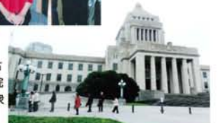
国会議事堂▶中央玄関を挟んで左右対称に衆議院と参議院が位置する。写真は衆議院側。