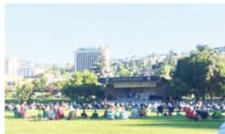
短い夏を楽しむイベント「Music in the Park」7月～8月は、公園で毎日プロの演奏家による無料ライブが催される。

カナダの西の端、ブリティッシュコロンビア州のカムループスという街で暮らし始めてもうすぐ一年が経とうとしています。私はコミュニティハウス、エコビレッジ、オーガニックカフェ…などのキーワードのある場所が大好きなベジタリアン調理師。これまで、オーガニックカフェでの勤務経験と タイ、アメリカ、スコットランドのエコビレッジ滞在経験があり、只今カナダの日本食レストランで勤務中です。