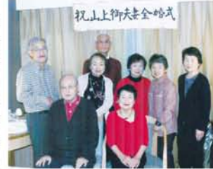
「幹事の次女が書いてくれた横断幕を掲げ、みんなで「金婚式」を祝ってくれました。

名建築の誉れ高いクラシックな東京駅丸の内側に降り立ち、ホテルへ。すぐ隣りが皇居東御苑で都会の広大なオアシスと言っても過言ではないほど緑がいつぱい。平川門から入るも、少々歩行困難な夫はガイドマップを見ただけでギブアップ。私はなんだか気高い雰囲気も感じられる東御苑に興味津々でどんどん歩みを進め、梅林坂を抜けると二面の大芝生出現にビックリ。一面は江戸城内で女の戦いが繰り広げられたという大奥跡、もう一面は平成2年11月、平成天皇の「大嘗祭」が行われた本丸大芝生でした。天守閣は、明暦(1965年)の大火で消失。天守台石垣のみが再建されて残っています。現存最古の富士見櫓、大番所、同心番所、百人番所…と、まるで時代劇の老女優にでもなった気分で一巡し、ホテルへ。東御苑の見学