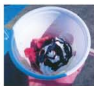
いろんなトッピングがあつて迷います。多様な「おもちパフェ」が完成。

「おもちパフェ」のほか、定番のきなこや砂糖醤油もあり、独居の高齢者の方にも振る舞われ、喜ばれていました。