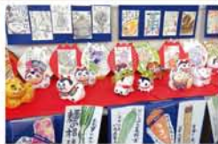
木川小・盆踊り教室(3頁に関連記事)。各ルームの力作がズラリ。皆さまも挑戦しませんか?

12月3日、淀川区民センターで「生涯学習フェスティバル2017」が開かれ、ウクレレの弾き語りやオープニング、