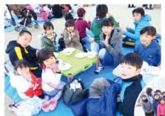
▲砂西町会はいちごを持参し、いちご大福に、「美味しいです！」

12/10 北中島連合子ども会・北中島地域活動協議会「第47回餅つき大会」(北中島小学校)