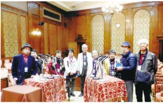
某議員の名セリフ「総理、ソーリ、ソーリ…」で有名になった衆議院予算委員会室。

姉妹6人夫婦が当番幹事を順に担当し、各地を親睦旅行する「むつ美会」。第25回目の今年も、千葉在住の次女の企画で東京へ。四女夫婦が参加できなかったのは残念ですが、昨年の「大阪お笑い巡り」に続いて9人でイザ!