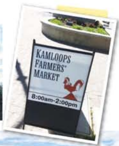
4月～10月まで週に2回開催されるオーガニックマーケット。新鮮な旬の有機野菜や果物、手作り石鹸などが手に入る。

カムループスはファーストネイション(イヌイト)の言葉で、「川が変わる場所」の意味。ノーストンソンリバーとサウストンソンリバーの合流地点。