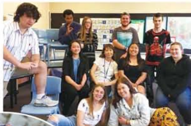
高校2年生。私のクラスの日本語を学ぶ生徒たち。

この広大な自然の国オーストラリアの国民性は、ざっくばらんて人情に厚い気仙沼の漁師（の娘）の肌に来るまでびったりきます。まず、裸足でスパーに買い物に行く子供、若者、そして親。3歳児の母が自宅に窓を作ると言うので行ってみると、カナヅチで煉瓦の壁に穴を開けています。金曜の四時半に校舎をウロウロしていると清掃員に不審がられ（つまり教頭先生すら残っていないので）、休みに宿題を出すと親から文句、学科長から注意書が届