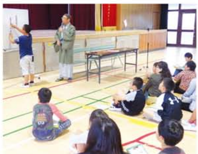
ハンバーグ、ヤキニク、スシ、ピザなど子どもたちに人気のメニューを組み合わせ「5・7・5」に挑戦。

「参観日親の視線が鬼のよう」あてられて間違えちゃうよ顔真っ赤」「こっそりと母が来るのを待ちわびる」「雨降って運動場が暇そうだ」