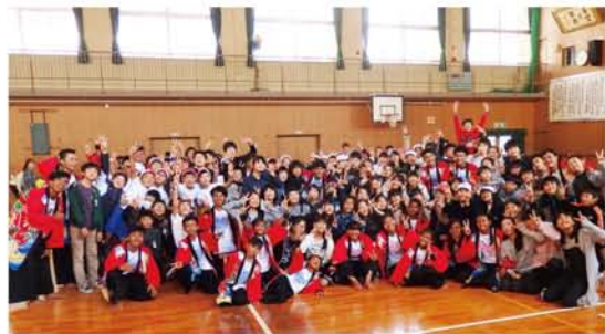
「モイ・ビー・バイ (1・2・3) !」の掛け声で全員集合写真。

今回の交流は、柴田校長先生が夏に「くっくま孤児院」を訪れたことから、「日本の小学校に行ってみよう」とのくっくま孤児院の声に賛同してとんとん拍子に企画が進んだそう。くっくま孤児院は、日本のNPO法人