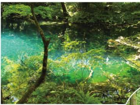
十二湖の青池(右)と沸壺池(上)