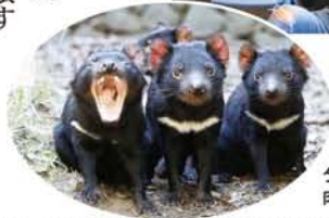
タスマニア島だけに生息する肉食性有袋類のタスマニアデビル。

きます。高校は最終授業が11月初め、共通テストが11月末で、以後2カ月半勉強ゼロ、前年の習得単語もスツカラカンに忘れて笑顔で2月の新学期に戻って来ます。夏季はまた、夏時間で時計を1時間先送りして仕事後のサーフィン、クリケット、ゲーディング等を愉しみ（冬季はクリケットがフットボールに、ゲーディングは週末に移動）、クリスマス親戚BBQでスポーツと政治を熱く論議します。 第一、オーストラリアは選挙が義務で、投票しないと罰金なんです。会社役員でもホームレスでも一票は一票。立候補者は弱者の声も無視できず、道路も雇用も福祉もイジメ改善もまず投票から。小3クラスは総理大臣に意見書を出し、高3女子は彼氏と行ける初選挙が楽しみと微笑みます（うーん。世界中で選挙を義務化できたら社会はどう変わるだろうか）。