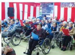
「汽車の窓からハンケチ振れば♪」特別 養護老人ホーム入所者の合唱、『高原列 車は行くよ。』近所やから毎年来てる。 食べ物も安くておいしいし、バザーも 楽しい」と、お客さんの女性二人組。

11月3日、木川西の障がい者・ 高齢者施設、淀川暖気の苑で恒 例のだんけふれあいフェスティ バルが開かれ、カレーや喫茶な どの出店、バザーも近所さん で大にぎわい。