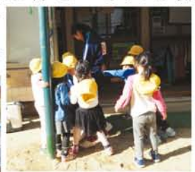
生徒たちは子どもたちと楽しそうに園庭を走り回っていました。ルールなどは子どもたちが自ら決めていました。

続いて取材させてもらったのは「愛光保育園」です。すこく心温まる場所で、取材している僕たちの緊張もほぐれました。