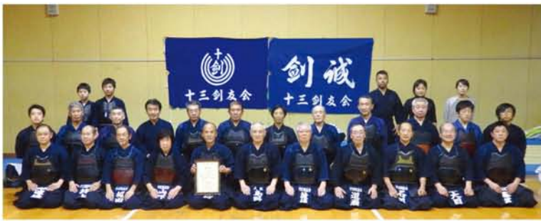
中学生から70代の会員が稽古に励んでいます。子どもの付き添いだったお母さんが剣道を始めることも。

十三で、52年。活気溢れる雰囲気を見て府外から通う会員も少なくない「十三剣友会」。先生クラスの有段者が揃うなか、初心者も大歓迎で、熱の入った指導が行われるのも特徴。そんな長年にわたるスポーツ推進の功績が評価され、今年度、「十三剣友会」は、大阪府より「生涯現役スポーツ賞」を受賞しました。