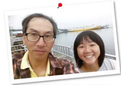
青函連絡船メモリアルシップを背景に。

私は東北地方が大好きで、学生の頃から自由気ままな旅をしていました。宿泊先で情報収集をして翌日の目的地を決める、という学生時代にしかできない旅で、ワイド周遊券と時刻表を持って東北を楽しんでいました。社会人になってからは時間が限られており、ピンポイントでの車旅をするようになりました。