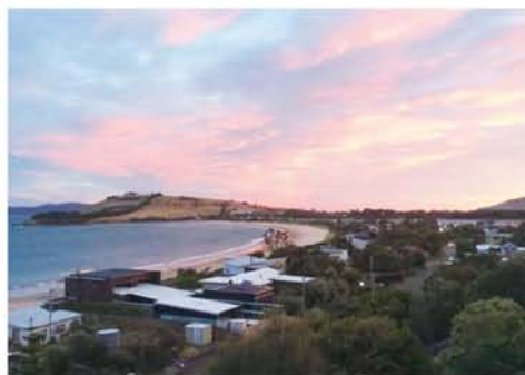
夕焼けに染まる、自宅のすぐ前にあるクレモンビーチ。

2017年11月15日、全豪有権者の77%以上が郵便投票した同性結婚合法化アンケートで、過半数62%がYESを示し、速報を待ちかねた一般群衆が歓喜の涙を共にしました。私は朝一で