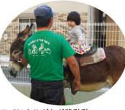
ロバにウサギなど移動動物園が大人気。「昨年に 続いて今年も来ました。子どもが動物好きで喜ん でいます」と保護者。