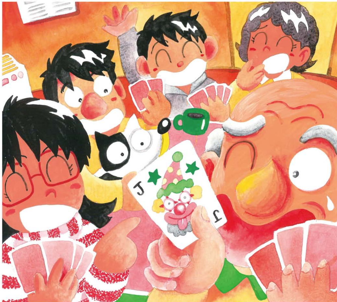
たまにかぞくがそろったよる ばんごはんをはやめにすませて みんなでトランプなんて てれくさいでしょうか (全文はthe-yodogawa.jpで) ツチハシツヨシ・画

★発行所…淀川通信舎 〒532-0023 大阪市淀川区十三東3-12-27 ★編集・発行人…乃美夏絵 ★毎月25日発行 ★発行部数:90,000部 Tel.06-6301-8370 Fax.06-6838-3881 ☒編集部:hensyu@the-yodogawa.jp 営業部:eigyo@the-yodogawa.jp