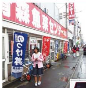
▲のつけ井の市場 ▶のつけ井とチケット。向こう側の井の左側はホヤ貝。

8月21日、早朝から青森市内に向かい、目指すは朝食「のつけ井」。チケットを購入してご飯を入れてもらい、次に市場内のお店を回って欲しいものをチケットと交換してご飯に