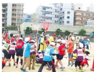
▲34年生の紅白対抗・激動玉入れ。参加者が入り交じり、動くカゴに玉を投げ入れます。「玉の色だけは間違わんといてな！」と各色のカゴ担当者。外れた玉も空中でキャッチ、再トライ。▶中学生の「障害物競走」は麻袋に入ったのジャンプ、ハードルに続きパン食い。「高すぎ！」

11月5日、北中島小学校で親子大運動会が開かれ、約600人が参加。11の地域対抗で汗を流しました。