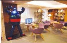
7月から開かれた3階のラウンジ。鉄人28号の超特大フィギュアもありました。

ホテルプラザオーサカでは最近力を入れていることがあるそうで、「外国人のお客様に、日本にもっと興味を持ってもらえよう、7月からラウンジを開きました。日本のゲームや駄