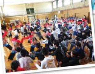
▲「わたしたちはカンボジアから来たよ〜。」と日本語で挨拶をし、この日のために、夏休み中は1日8時間練習をしていたという伝統舞踊を披露してくれました。会場には、隣接する新高幼稚園の園児も来ていて、目をまるくして見ていました。