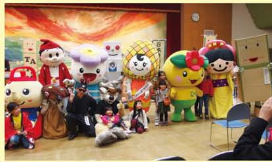
今年1月31日、第3回よどがわワンダーランドへは、区内外から11体のキャラクターが集まりました。