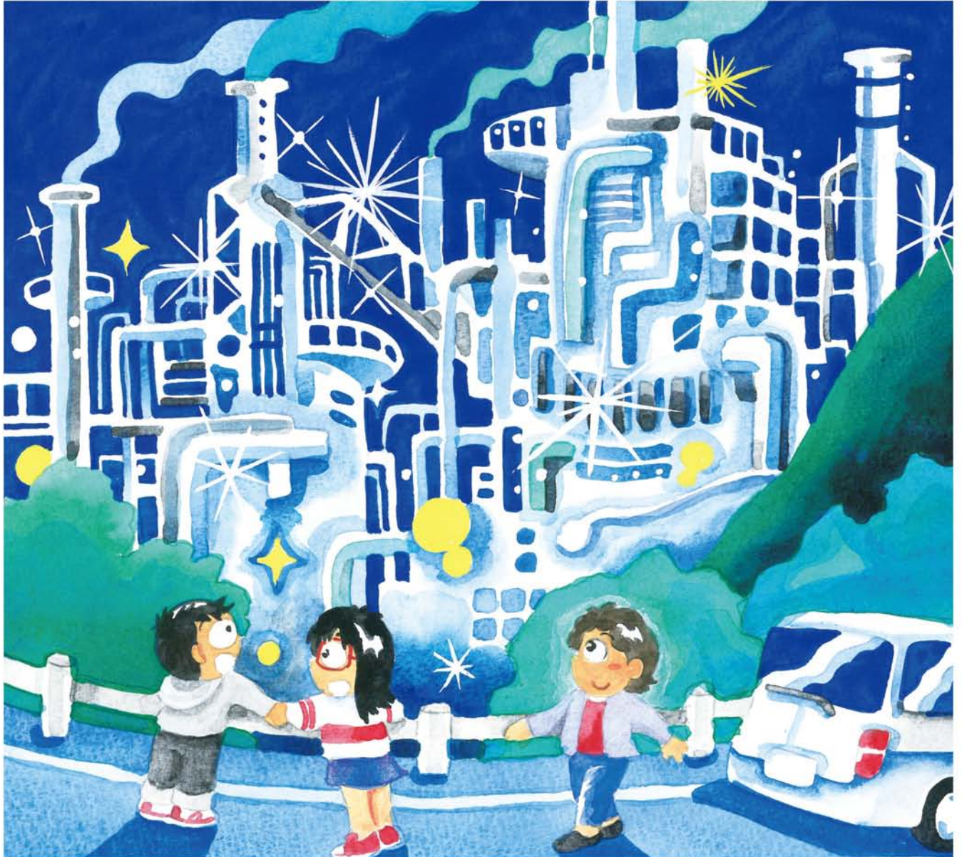
「うわぁメッチャきれい!」「タクヤはじめてやったっけ…わたしはおかあさんとちょこちょこきてたんやけどなぁ」 (全文はthe-yodogawa.jpで) ツチハシツヨシ・画

★発行所…淀川通信舎 〒532-0023 大阪市淀川区十三東3-12-27 ★編集・発行人…乃美夏絵 ★毎月25日発行 ★発行部数:90,000部 Tel.06-6301-8370 Fax.06-6838-3881 ☒編集部:hensyu@the-yodogawa.jp 営業部:eigy@the-yodogawa.jp