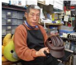
「以前、コラムでお母さん向けのかわいいヘルメットを紹介しました。こちらはお父さんもかぶりやすい『カスク』というおしゃれなヘルメット。新しいグッズにはまず自分でライして、よければ皆に教えたい」

「サイクリングに行った時に野鳥を見て、『ザ・淀川』に載っていたあの鳥やな、あの花やなって気付くのも楽しい。良いことが書いてある情報誌なんだから、もっといろんな人に読んでもらえて保存しておきたいかな。今までは雑誌を指してほしい。今まで広告（コラム）出して来て、店の前にお客の行列ができた…なんてことはなかったけど（笑）人の役にたつと思って続けています」