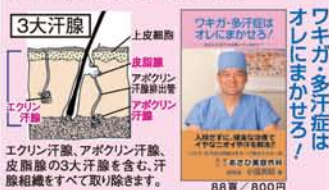
ワキガ・多汗症はオレにまかせろ！ 88万 / 800円

ワキガ多汗症根治手術 電磁波や照射系の減臭治療ではいずれ再発し治療を繰り返す懸念があります。ワキガの元の汗腺を切除することのみが完治できる方法です。