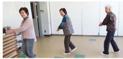
踊りの間も笑いが絶えません。

「区民センターで民踊を習っているメンバーが地域に持ち帰って、皆でおさらいしています。夏の盆踊りで、子どもたちに教えるのも目的の一つ。近くの地域とはお互いの盆踊りを行き来