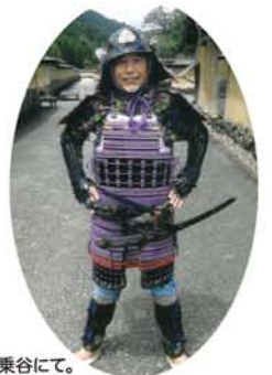
福井県の一乗谷にて。