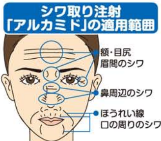
シワ取り注射「アルカミド」の適用範囲 額・目尻 眉間のシワ 鼻周辺のシワ ほうれい線 口の周りのシワ

アクアファイリングが特に優れている点は、他のバスト注入治療と比べ、効果が5〜8年と長期的に持続することです。2カップ以上のポリウムアップが可能で、バスト全体に若々しいハリを持たせることや左右非対称なバストの形を整えることもできます。」 他にも、スリムな体型を取り戻す脂肪吸引、わきがの根治手術など、美容に関するあらゆるお悩みに、的確に応えてくれるのは27年の実績を持つあさひ美容外科だからこそ。しかも笑顔が優しく温和な院長になら、リラクセスしてなんでも話せる感じ。カウンセリングは無料、お気軽に相談くださいねか？