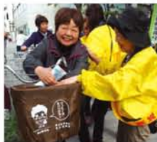
防犯協会がつくった「キャサリン」のカバーが初お目見え。「かわいいね」と好評。「キャサリン」のつぶやきをツイートしているのうれしい」という男性も。

「春の地域安全運動」初日の4月19日、新北野地域では、防犯協会がひたたくり防止の前カゴカバーを配布。