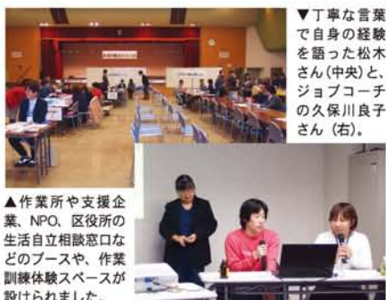
▲作業所や支援企業、NPO、区役所の生活自立相談窓口などのブースや、作業訓練体験スペースが設けられました。

「実際にドームで歌ってみて、いずれはここで自分のコンサートをやりたいなと、新たな目標ができました」