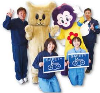
(淀川区セーフティーよどがわ)