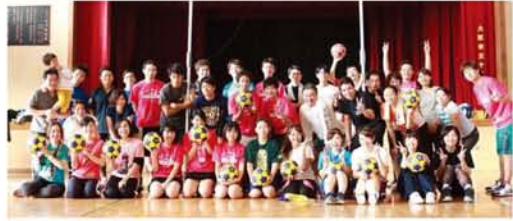
「一緒に楽しみましょう！」

コーフボールとは、オランダ発祥のニュースポーツで日本でも若者を中心にファンが増えつつあります。バスケットに近いのですが、ドリブルがなく、男女混同チームで誰もが気軽に