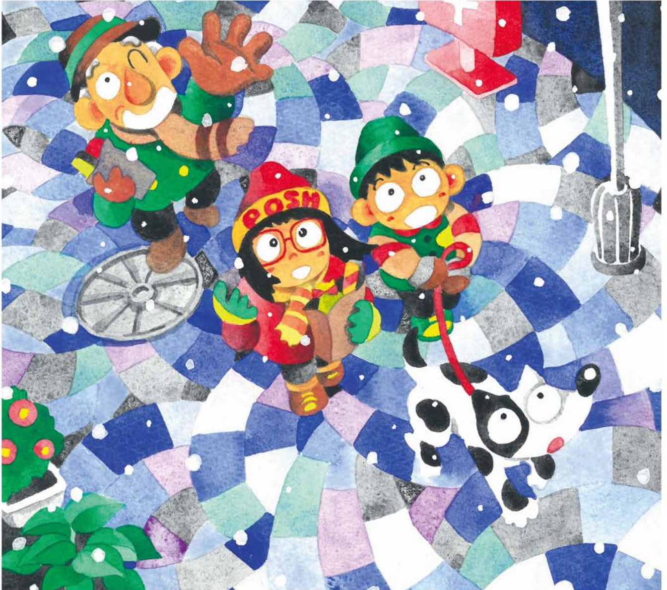
いしだたみに おちてはきえてく みずたまもよう かぜにながれる ジングルベル ゆきかういるとりどりのマフラーたち (全文はthe-yodogawa.jpで) ツチハシツヨシ・画

★発行所…淀川通信舎 〒532-0023 大阪市淀川区十三東3-12-27 ★編集・発行人…乃美夏絵 ★毎月25日発行 ★発行部数:90,000部 Tel.06-6301-8370 Fax.06-6838-3881 ☒編集部:hensyu@the-yodogawa.jp 営業部:eigyo@the-yodogawa.jp