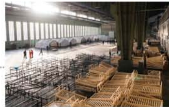
テンペルホーフ空港のロビー跡でテントやベッドをセットしている様子(新聞に載っていた写真です)。

フィ、ゴルパチョフなどが滞在したそうです。地下鉄U2の終点でもあるパンコウ駅周辺は、ショッピングモールをはじめ、様々な店やスーパー、レストラン、カフェがあり大変便利なのに、少し離れた住宅街は夜は暗く静かです。ここは、旧東ベルリンなので、最近では日本でも話題