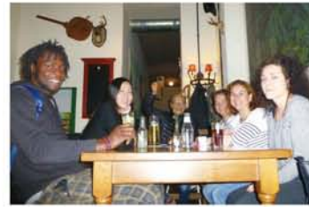
ナイジェリア、ウクライナ、スペイン、クロアチア…語学学校の友人たちと、プロースト(乾杯)