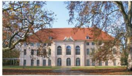
シェーンハウゼン宮殿。かつては、周辺に東独の幹部の住まいや東ヨーロッパ関係の大使館などもありました。

すぐの散歩コースなので、よく訪れます。この宮殿は国賓級の迎賓館的な役目も果たし、ホー・チ・ミンやカス