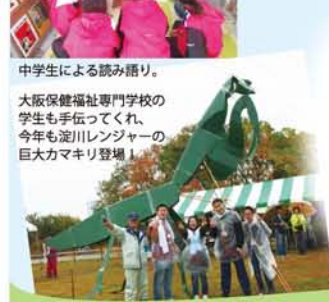
中学生による読み語り。大阪保健福祉専門学校の学生も手伝ってくれ、今年も淀川レンジャーの巨大カマキリ登場！

出展の出店の皆さん、ボランティアの皆さん、協賛企業の皆さん、ご協力くださった皆さん、本当にありがとうございました！