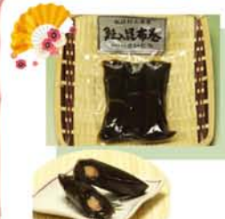
昆布巻きは「鱈」の巻物の形から「文化 や学問」を意味するなどの由来があります。 受験生をもつご家庭では「おせち」の1品に。

鮭は、消化・吸収のよい良 質のたんぱく質に富み、脂肪 分も血中のコレステロールを 抑えて血液の流れを良くし、 動脈硬化や血栓、高血圧を 予防、脳の活性化に有効な EPA(エイコサペイタエン酸) やDHA(ドコサヘキサエン酸) など不飽和脂肪酸が中心のた め、美味しい上に健康に良 い魚です。その上、豊富な ヨードと食物繊維、海がく れた健康食材の昆布とセツ トされている「鮭の昆布巻 き」は、ピカイチの健康食 品と言ってよいでしょう。