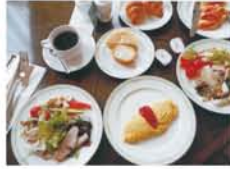
左:ホテル内のイングリッシュガーデンでのひと時。 右:たっぷりの朝食をゆっくり味わって、1日をスタート!

旅好きな私は、毎年のように宿泊を伴う旅に出かけていた。ここ数年は体力の衰えから気力も萎え、宿泊を伴う旅はしていないが、機能訓練を重点的に行う通所介護施設の担当者からの強い勧めもあって、「小さな旅」から再開しよう、秋晴れの日、妻とJRを利用し琵琶湖畔に建つリゾート施設へと向かった。 散策、食事、会話… 過ぎ行くままの時を楽しむ