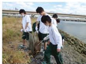
ゴミを協力して運ぶ生徒。「重い！手伝わってや」設けられた集積ポイントに運びます。「普段も電車を見に来たり、写真を撮りに来たりします」「たそがれたり(笑)、ストレス解消に来る」と生徒。川は、普段から親しみを感じる場所のようです。

「守ろう・残そう・創ろう みんなの淀川水系」を合言葉に、英真学園高校生が川について学び、淀川河川敷を清掃するCUP（クリーンアッププロジェクト）。11月11日、第16回目のCUPが開催されました。生徒たちは、淀川河川事務