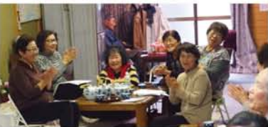
会の手を入れて、和気あいあい。