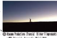
© Hasuna Productions, Francia, Bimber Filmmarkt, y M&M Almoradi, Cinesidex (S) 2013

どこまでも広がる美しい空があり、天文学者たちが集まるチリのアタカマ砂漠。この場所は、ピノチエト独裁政権下で捕らわれた人々の遺体が埋まる場所でもある。28年間遺骨を探し続ける家族たち、両親の死を受け入れて生きる女性、ゆっくり流れ続ける天空の時間。同監督の「真珠のボタン」も同時上映。