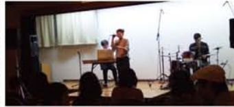
『夢』『迷路』『パパからの手紙』『大人になる君へ』一親が子を思う気持ちを中心に日常の思いをやさしく歌う『Calm Place』。2部の『Spirits Start Line』のお二人は、観客から募ったテーマでの即興演奏も魅力の一つ。「セブテンバー」「マイケルジャクソン」「ハロウィン」で、見事にオシャレ一曲。

「理想像を子どもに押しつけず、子ども自身の表現を早く認めていれば、その分、子どもにとって穏やかな場所を保障してあげられた。子どもの思いを尊重するって大事ですね」と梁さん。続くドラム&ピアノライブでは即興演奏もあり、大いに盛り上がりました。