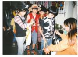
▲「ハッピーハロウィン♪」お菓子ポイントでは、ママパパに交じって元参加者の中高生もスタッフとして活躍しました。 ▲「衣装作りの3週間くらいかかった」「ペンキで塗って作ったよ」と高学年組。100均の帽子と組み合わせておしゃれ!

魔女：夕暮れ時の十八条西公園に続々と集まる不気味な人影。10月27日、十八条でハロウィンイベントが開催され、みんな大きな声で、「トリックオアトリート！」