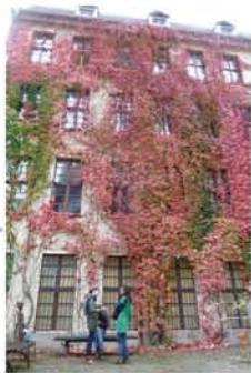
(上)石造りの重厚な建物に紅葉したツタが彩りを添える秋。街並みは一層美しい。(右)ストリートアーティスト。将来の巨匠!?

ホールなどを利用して、難民用のキャンプが用意されています。難民受け入れについては、ベギーダ(「西欧のイスラム化に反対するヨーロッパ愛国主義者」の略称)のデモに難民受け入れ派のデモより多くの人が参加するなど、賛否両論あつてな