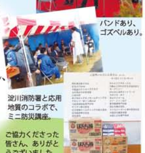
バンドあり、ゴズベルあり。

過去最高のフリマ出店予定数、中学生ボランティアも全校から参加の返事があり、今年は初めて大阪保健福祉専門学校の学生も30名以上が参加予定。フェスティバルの輪が一年に広がった今年でしたが、あいにくの天気予報。11月8日朝6時、雲の切れ間のニュースを受けてフェスティバルは決行されましたが、雨の中の開催となりました。それでも出展・出店の皆さん、ボランティアの皆さんは大勢参加してくれ、「毎年楽しみにしているから」と来場者も含め約1200名が会場へ。次年につなげたい課題がたくさん見えた1日となりました。「ご協力・ご参加くださった沢山のみなさんに本当に感謝いたします。来年もよろしくお願ひいたします」と実行委員会。