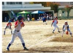
前日から雨で悪条件のグラウンドを、早朝から整備した北中生。少々疲労感が表れつつも、第一戦は見事勝利。お昼を過ぎた頃には歴代の先輩たちも駆け付けてくれ、練習を見てもらっていました。

放射能に関する基礎的な知識や原爆と原発事故の違いなどを学んだ後、16年前に起きた東海村JCO臨界事故犠牲者の被曝の様子と、治療に格闘する医療チームのドキュメンタリーを視聴。被曝による遺伝子破壊がもたらす人体への影響のすさまじさに、見終わった後、参加者はしばし言葉を失った様子でした。 経済を学ぶ大学生からは、「テクノロジーへの考え方を変える時期では」との感想も。