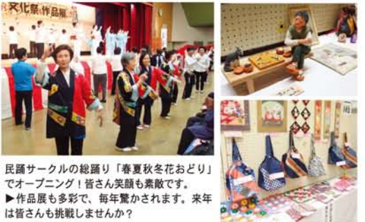
民謡サークルの総踊り「春夏秋冬花おどり」でオープニング!皆さん笑顔も素敵です。 ▶作品展も多彩で、毎年驚かされます。来年は皆さんも挑戦しませんか?

11月13・14日、淀川区老人福祉センターと淀川区老人クラブ連合会主催の「平成27年度文化祭・作品展」が淀川区民センターで開かれ、力作と華やかな舞台上が大いに盛り上がりしました。