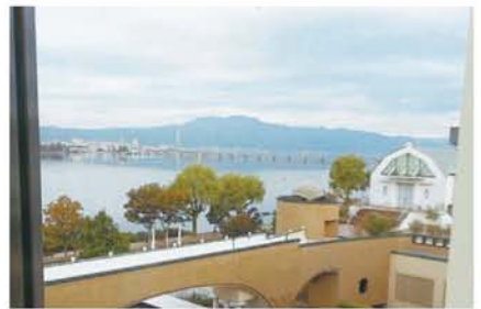
上:部屋からの眺め。近江大橋から比叡山を望む。 左:地元の食材を使った美味し舌鼓。

大勢の利用者で込み合う新大阪駅の構内と長いホームを、杖を頼りに歩行。常日頃の散歩や歩行訓練の頑張り不足を悔い、不安を抱きながらの出発であった。予想以上の難行ではあったが、妻の叱咤と励まし、介助で、目的地のJR石山駅には定刻通りに到着した。駅前にはホテルの送迎バスが迎えてくれ、瀬田の唐橋を渡ると、約8分ほどで、琵琶湖から流れ出る唯一の河川「瀬田川」沿いにある「ロイヤルオーク・ホテルスパ&ガーデンズ」に到着。14時と早々にチェックインした。 169室ある大型のホテルはフロント・ロビーとも広く、依頼して