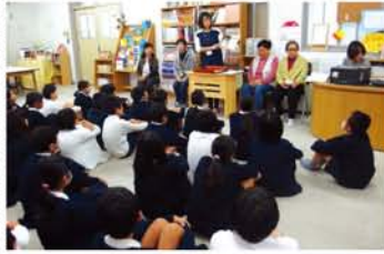
▲読み聞かせグループ「ほうせんか」は、『アンパンマン』の紙芝居と、高学年には、命や教育、平和の大切さを訴えたマララ・ユスフザイの絵本『マララさんこんにちは』を紹介。6年生は、「マララさんが子どもたちを勇気づけたことが良かった」「やなせたかしさんが兵隊だったこと、空腹の子を助けたいという深い意味を知りました」と話していました。

★12月10日(木)13時～15時。淀川区役所5階。対象＝当事者、家族を含む区民、関係者。参加無料、申込不要。(問) ☎6308-9875 / FAX6885-0537