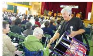
「大阪! ええじゃないか! 木川はええじゃないか!」ステージで演奏中の『鼓組』に合わせて、参加者もばちを持って演奏。

が送られました。二部は有志が日舞・フラダンスなど演芸を披露。参加者全員による万歳三唱で締めくくられました。