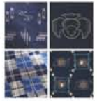
左上より 多和田淑子 紺地紬絣着物(部分)/ 絵絣屏風(部分)/ 幾何文変具地(部分)/ 柳宗悦 構文給絣布(部分)

織る前に糸を染め分け、織り合わせることで模様を作り出していく絣。織り上がりのかすがが美しさの源であるとして柳宗悦が高く評価した。鳥取県の弓浜絣を含め、絣技法による染織品を中心に約120点を展示。白と藍の濃淡によって表された幾何学文や絵柄など豊かな模様を楽しむ。 ◆開催中～7月20日(月・祝) 10時～17時 水曜休館 大阪日本民芸館(万博記念公園内) 一般700円、大高生450円、小中生100円 【問】06-6877-1971