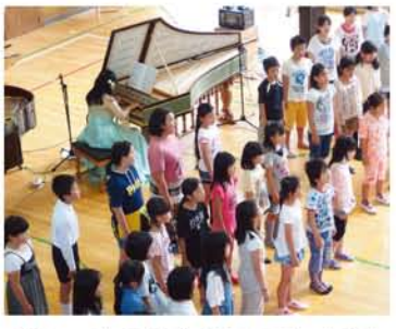
最後は、三津屋子ども会「音楽クラブ」の児童がチェンバロの音色に合わせて合唱。

5月7日、三津屋小学校で「チェンバロコンサート」が開かれ、世界的に有名な演奏家、明菜みゆきさんが来場。5000年前に誕生したチェンバロを『ピアノのお母さん』として紹介。チェンバロ最盛期に最も親しまれていた曲、バッハの『アヴェ・マリア』を弾くと、児童はシーンと耳を傾けていました。