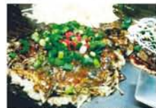
海のミルク、牡蠣の滋味たっぷり。「カキオコ」