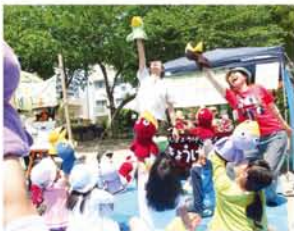
今年是人形劇団京芸さんも登場！人形劇の初歩を学び、みんなで「カー！」。

子どもたちが「自分たちのやりたいこと」「考えたこと」を形にする、お店屋さんごっこ『おやこまつり』が5月10日、野中南小公園で開かれました。カンカン照りの中も子どもたちは、「なぞなぞしませんか？」「にんぎょうくじです！」と声を張り上げ、お客さんが来るとルール説明から対戦相手役まで一所懸命がんばっていました。