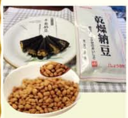
◎栄養はそのまま、気になる匂いは全くありません。ナットウキナーゼが血液もさらさらしてくれます。

納豆は、やわらかく煮た大豆に納豆菌(食中毒や雑菌を殺す抗生物質を生み出す)を繁殖させて作られたものです。原料の大豆成分の優秀さに、納豆菌の力が加わり、肉や魚にまけない栄養食品です。加えて納豆菌の持つタカジアスターゼなどの酵素も消化を助け、腸内の清掃や異常醗酵を抑制し、下痢を治します。また、納豆菌によるビタミンB2の合成能