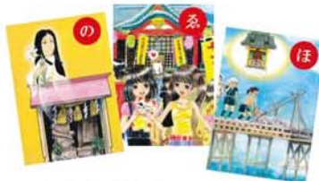
なわ淀川花火大会や淀川区一千人の第九などの催しも詠まれている「わがまち百景」はかるた。

フが制作した「淀川区わがまち百景」の「わがまち百景」を、実際に歩いた場所を、十三東編が、6月21日に