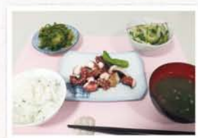
※材料はいずれも2人分

梅雨時は湿気が多く、鬱陶しい気分になりがち。そんな時は旬の味覚を生姜や梅の隠し味でさっぱりとした、元気回復!