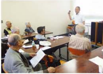
毎月約20人が参加。次回6月のテーマは「懐かしの名曲を」。「愛の喜び」「マドンナの宝石」「トルコ行進曲」「ハンガリー舞曲」「ショパンのノクターン」などを聴く予定です。

大音量で、有名曲から知られざる名曲まで、様々な音楽を楽しんでいける『クラシカ十三』が、「音楽実験室2、これがステレオだ」と銘打って5月の例会を開催。 まずはステレオ出現以前のモノラル録音をイスピーカーで試聴した後、徐々に「2スピーカー」そして「その間隔を広げてみる」など実験を行うと、音楽が立体的に変身。