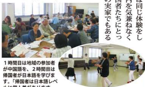
1時間目は地域の参加者が中国語を、2時間目は帰国者が日本語を学びます。「帰国者は日本語レベルに個人差にご参加いただき、地域の方々と交流します」と交流クラスの松下先生。

一時受け入れと日本語教育、生活指導などを行う定着促進センター、自立研修センターとなり、家族などの自費帰国を含む2万人以上の帰国、定住を支えました。帰国者の減数に伴い、平成20年に定着促進センターとしての役目を終え、3年前には自立研修センターも閉所に。現在は大阪市の委託を受け、日本語支援事業、生活相談、パソコンクラス、交流クラスを運営しています。