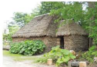
民族衣装や、家(チセ)、民謡や民族音楽演奏(ムックリ、トンコリ)、唄など、実演も兼ねて紹介。アイヌの絵本も楽しめます。