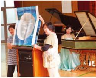
ピアノのように、鍵盤を押すことで弦をたたくのではなく、弦が爪弾かれる様子を食い入るように見つめる児童。

来使命のように感じています。みんなに見てもらって、癒しの時間を一緒に過ごせたら。晩は、「みつや交流亭」でも演奏会があり、大盛況でした。