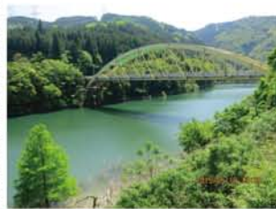
「5月10日に下見に行ってきました。新緑がきらきらと、とても気持ちがいいですよ。写真は曾東大橋。

大阪湾から琵琶湖まで、16回かけて完歩を目指す「よどがわ探訪」。毎回好評ですが、いよいよ第14回。6月21日（日）、京阪バス「石山駅」からバスで移動し、立木観音前