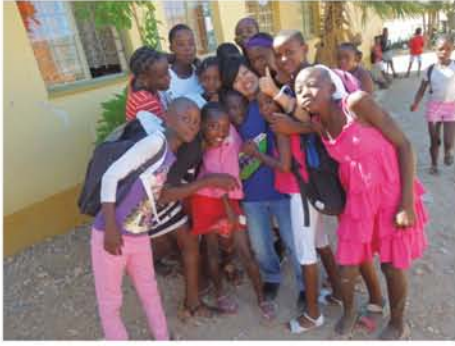
生徒たちは写真を撮るのが大好き。いつもポーズを決めてくれます。

アフリカの国の中でも観光資源が潤っており、首都は大型ショッピングセンターやレストラン等が充実、欧