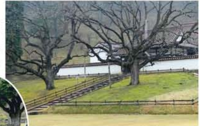
(上)楷の大木。孔子の墓所から採種育成した苗を儒学に関係のある湯島聖堂(東京)に3本、足利学校(栃木県)に1本、多久聖廟(佐賀県)に1本と、ここ閑谷学校(岡山県)に2本植えたもの。 (右)初の長距離運転にトライした孫娘。

0m余の精巧な石組みの扉で囲まれた風景は、見事なものであった。先祖からこの学校にかかわったのであろう集落に住む老齢のボランティアガイドが、国宝や重文に指定された多くの建物を誇らしげに説明。案内書にない秘話までも交えて案内をしてくれた。