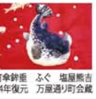
万屋町金鐘垂 ふぐ 塩屋新吉 1484年復元 万屋通り町会蔵

刺繍の歴史は古く、人間が布を織ることをはじめたときから同時に発生してきたとも考えられている。祇園祭の長刀鉾を飾る豪華な懸装品と、長崎くんちに見られる長崎刺繍の匠のわざを紹介。あわせて、18世紀ロココ時代ヨーロッパ宮廷、20世紀初頭のオートクチュールのドレスも同時展示。 ◆開催中～6月28日(日) 10時～18時 水曜休館 神戸ファッション美術館(六甲ライナー・アイランドセンター駅) 一般500円、小中高・65歳以上250円 【問】078-858-0050