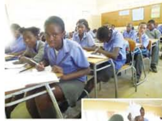
(上)算数の授業。みんな真剣に取り組んでいます。(右)折り紙で「Tシャツ」を作りました。「手裏剣」も「スター(星)」と呼ばれて人気です。