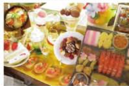
株式会社いわさき 新高4-7-12(北大阪営業所)

私は迷う。毎日のように迷う。本当にこの選択は正しいのか。もしやこれが正しいと思い込んでいただけなのでは…。そう、その迷いとは、毎日のように通う定食屋の、唐揚げ定食と、日替わり定食。ふと隣の人の日替わりを見て「そっちやった〜!」と撃沈。そんな日々迷える多くの子羊達の味方、今回お邪魔した株式会社いわさきさん！こちらは、よくお店の店頭ディスプレイされている、超精巧な食品サンプルを手掛ける会社。創業80年を超える実績とその商品は、食品サンプル界の「本物」。近くで見ても、本物そっくりのそのサンプルは、食欲をかきたて、味の想像が頭を駆け巡る！見学させて頂いたのは、新高にある和食中心のサンプル品の工場。皆さんが、日々迷うメニューの決定打を打っているかもしれないいわさきさん。その驚くべき技術！次回がつりレポートいたします！