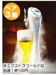
※エクストラコールドは別途1杯100円

6月1日から9月30日までの平日、ホテルメルパルク大阪のレストランカトレアが「ビアバイキング&ビアホール」を開催。ビールなど各種ドリンクと約40種のピュッフエ料理がズリと並びます。今年はエスニック料理や九州ご当地の味など一か月ごとの限定メニューも登場。毎月見逃せません!