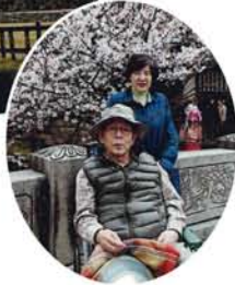
(左)世界遺産にもひけを取らない、凛とした佇まいの「閑谷学校」。 (右)満開の桜の下で、妻とともに「バチリ」。

山間(やまあい)に入り、小さな集落を抜けると、突然、閑谷学校の大きな講堂が目飛び込んで来た。寛文十年(1670)岡山藩に二つの藩校(武士と庶民の学校)が創られ、その一つの閑谷学校は、庶民の学校として岡山藩主池田光政によって創られたもの。校門、閑谷神社、孔子をまつる聖廟、備前焼の瓦をのせた講堂等々が70