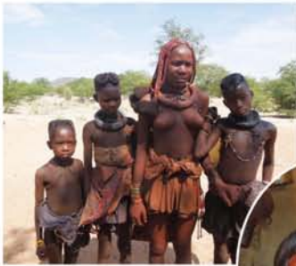
ヒンバ族は牛と山羊を育てながら、伝統的な生活しています。私も赤土と脂肪を混ぜた「特製日焼け止め」を塗ってもらいました(右)。虫除けや防寒にもなっているそうです。

ヒンバ族の女性の容姿は特徴的で、上半身は裸でアクセサリーを身につけ、日焼け防止のためバター成分が入った赤土を全身に塗りたくって