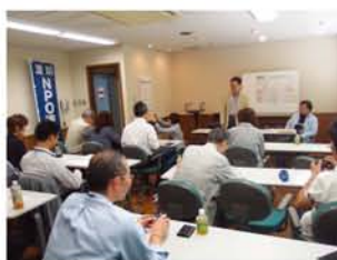
6月から清掃活動をスタート。続報します。

「淀川区内にあるNPO団体が手を組むことで、地域とのつながりや、新しい展開をつくっていったら」