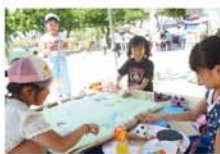
エアーホッケーのように対戦する『ボスをやっつけろ！』途中でボールが増えて大興奮。

主催する「よどがわおやこ劇場」は年に4回、プロのアーティストによる生の舞台を鑑賞したり、さまざまな自主活動を楽しんでいます。今回は6月7日、西区民センターで「劇団うりんこ」による『妥協点P』を鑑賞（中学生対象）。学園祭のために女生徒が書いた台本をめくり、教師同士が論争に。書き直すと、また違う論争に。「まったく飽きずにどんどん引き込まれる劇」と好評の公演、参加しませんか？ ★（問）☎ 6886-2923