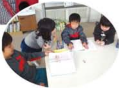
(下)1年生の音読の宿題を聞いてあげる4年生。