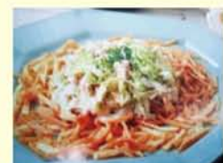
温かいサラダで野菜をしっかりと食べましょう

◆食物繊維 ・脂質異常症予防:コレステロールの吸収を抑制。 ・肥満予防:脂質や糖質の吸収を遅らせたり、かむ時間が長くなることにより満腹感を与える。 ・便秘予防:腸のぜん動運動を促進する。 ◎野菜の必要量 野菜は1日に350g必要とされています。350gの野菜を食べると、必要とされるビタミンや食物繊維を摂取することができます。しかし、大阪市民の平均値(平成19~22年調査)では275.9gと、およそ70g不足しています。70gといえば一般的な野菜料理1皿分。特に野菜が不足しがちな朝食か昼食に、もう一皿の野菜料理を! ◎健康はバランスのよい食生活から 身体には、ビタミン・ミネラルだけでなく、さまざまな栄養素が必要です。できるだけ、主食(ご飯・パンめん)+主菜(おかず)+副菜(野菜)のセットで食べるよう心がけましょう。 ①じゃがいもとにんじんは、マッチ棒くらいの細さに切る。(4~5cm幅の2mm角程度。千六本切りといえます。) ②キャベツと白ねぎは、細切りにする。 ③パセリはみじん切りにする。 ④しょうゆ・マヨネーズ・酒を混ぜて調味液を作る。 ⑤フライパンにサラダ油を熱して、じゃがいもとにんじんを炒める。塩・こしょうをふって、水分がなくなつてカラツとなるまで炒め、器(広めの浅皿)に広げるように盛りつける。 ⑥⑤のフライパンにキャベツと白ねぎを入れて炒め、④の調味液を加えて調味する。 ⑦器に広げたじゃがいもとにんじんの上に⑥のキャベツと白ねぎを乗せ、みじん切りのパセリを散らしてできあがり。