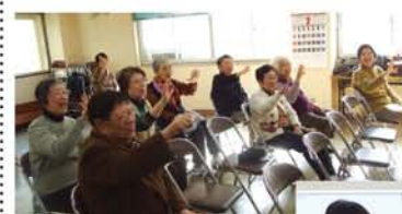
▲後だしジャンケンで頭の体操。 ▶「おはなしポケット」の皆さん。 この日は3人でしたが、登場人 物の個性をそれぞれ演じ分け、 見応えたっぷり。「地域での催し はいろんな世代の方々と話せる ので、とても新鮮で楽しいです」