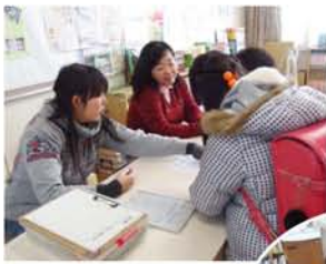
(上)受付では児童からの「○○くんところ、インフルエンザで学級閉鎖になってんで」など「一日の報告」が聞かれます。