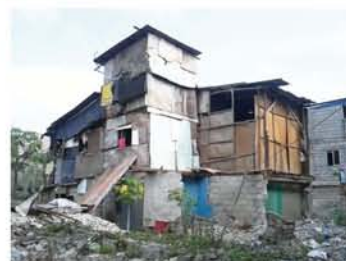
イーストリバーサイドの家。「またフィリピンに行って、路上で生活する人を減らしたり、子どもたちが明るく暮らせるように手伝いたい」と、娘。現地です。

4日目はフィリピンの子どもたちと交流するピースキャンプ。フィリピンでは労働者と子ども問題が深刻と聞きましたが、子どもたちが幼い内から直面する問題と解決策を伝えて行くことが、平和で