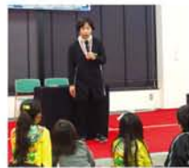
日本各地、世界各地 の昔話をしてくれる 「いっすんぼうし」は 図書館を拠点に活動。 この日は中国の昔話 を語ってくれました。