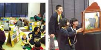
小学校の頃から読み語りに親 しんできた中学生は、読み手 として活躍するようになって きました。みんな上手です。 ▲宮原中学校有志メンバー。 ▼十三中学校有志メンバー。

「♪皆の衆、皆 の衆うれしか つたら腹から笑 え」―新北野老 人クラブ「長生 会」の手話クラ ブは、歌いなが ら手話を習得。 「音楽があるから 頭に入りやすい。 知っている曲な ら尚わかりやすい」と、大好評です。 「以前は年7曲、今も年5曲はこな しているから、最初から来ている方