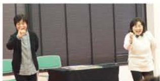
▲こちら、図書館を拠点に区内各所でおはな し会を開いている『絵本の会 淀川』。手遊びは お手軽ながら趣向が凝られ、フタを狙う オオカミが、取り逃がしてはすねる様子が可愛 らしく、盛り上がりました。▶木川小学校の『木 川おはなし倶楽部』は、パネルシアター「スイ ミー」と「ひよこちゃんこんなになっちゃった」