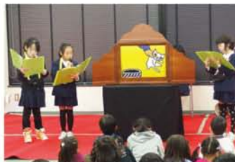
宮原小学校は3年生と6年生が読み語りに挑戦。 3年生は、今年で3回目の出演で、見事な語り 口調が大人たちを驚かせました。