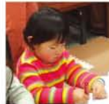
と見つ付けてくちりの子？」