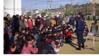
油の鍋に火がつき、水で消火しようとする。児童も消防署の実験に参加しました。

2月14日、地域と小学校合同の避難所開設訓練が神津小学校で行われ、土曜授業の児童と住民・計460名が参加しました。 津地域活動協議会 講堂では、災害救助・避難所生活について自衛隊の講