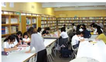
(上)テスト前の学習会が始まると、生徒たちも自ずと“勉強モード”に。 (下)月に1回、8時30分～45分までの読み聞かせ時間。

「生徒は多い時で70人ほど集まり、生徒のやる気を後押ししてやれる場の重要性を感じました。今年度からは火曜日、金曜日に放課後学習会として参加を募るとやはり希望者が多く、現段階では3年生にしばった少人数制で開いています。」