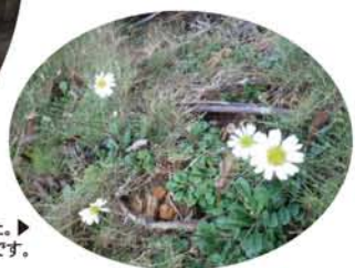
めずらしい「琉球菊」を見ました。▶絶滅危惧種だから、場所はヒミツです。

てもらいたいという願いを込めているそうです。入場無料で、ジュゴンや青珊瑚といった環境関連の写真だけでなく、ゲート前の市民の座り込みや海上行動の写真も展示してありました。ゲート前の座り込みというのは、沢山の人が沖縄の基地に対して反対しているという事を示している写真でした。 写真展の宣伝の為に毎日車で名護市中を回り、名護市・沖縄北部の豊かな自然を感じながら、写真展開催と基地反対を訴えました。沖縄は日本社会のあり様が見える窓の一つだと思います。今後も、沖縄で見聞したこと感じたことを生かした活動が続け、沖縄と関わつていきたいです。