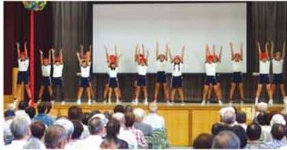
田川地域の敬老会でも、選抜メンバーの体操演技があり、「すごいきれいやね」と地域の人たちを驚かせていました。