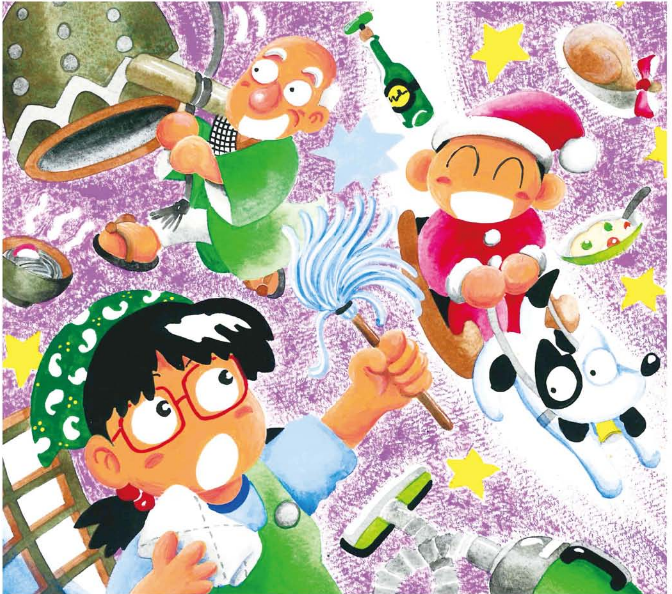
「おじいちゃんもタクヤも なにうかれてんの ねんまつをゆっくりたのしみたいんやったら やっとなアカンことあるでしょ！」(全文はthe-yodogawa.jpで) ツチハシツヨシ・画

★発行所…淀川通信舎 〒532-0023 大阪市淀川区十三東3-12-27 ★編集・発行人…乃美夏絵 ★毎月25日発行 ★発行部数:90,000部 Tel.06-6301-8370 Fax.06-6838-3881 ☒編集部:hensyu@the-yodogawa.jp 営業部:eigyo@the-yodogawa.jp