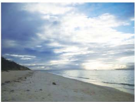
穏やかな瀬底ビーチ

基地の面積は島全体のなんと35%。そして、この瀬底ビーチの真上事でした。 今も継続的に行われているというアイクリング、マリンスポーツ等のレジャーも盛んです。しかし、その島は、島民による基地返還闘争が