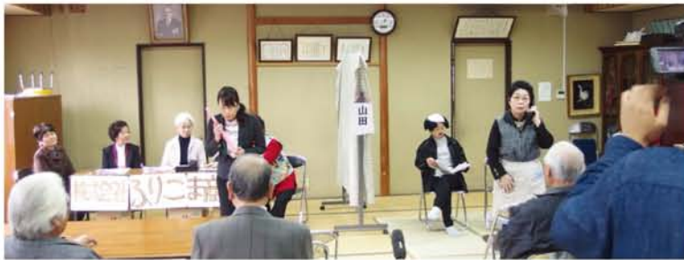
この日は、野中地域の食事サービスで詐欺の注意を呼びかけた寸劇を上演。詐欺集団「株式会社ふりこま商会」の言葉巧みな電話に、いったんは振り込もうとするお母さん。しかし旦那さんや友人の助言で魔の手から逃れます。