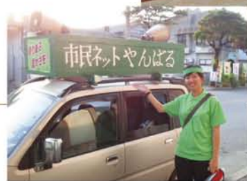
うくいず嬢になって、名護市を回りました。

「市民ネットやんばる」では写真展を開催していました。写真展を通し、辺野古の海大浦湾の素晴らしさを沢山のの人に知つ