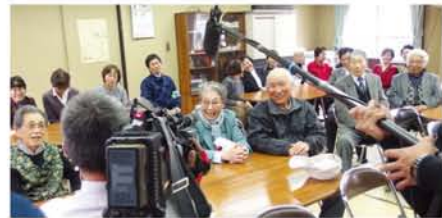
寸劇観賞後、野中地域の皆さんもインタビューを受けました。皆さんのお宅にも、けっこう電話がかかっているそうです。

「淀川大根座プリティオーバンス」の名で、寸劇を通して「オレオレ詐欺」の注意を呼びかけたり、子ども見守り活動の啓発をしている淀川防犯協会女性部のメンバーが、11月17日、NHKBSプレミアム『関口宏の“そもそも”』の番組取材を受けました。同番組は10月から始まった新番組で、さまざまな社会現象の“そもそも”を掘り下げていくもの。これまで、ギャンブル、ドラッグが取り上げられ、今回は「詐欺ってなんだ!」がテーマ。「オレオレ詐欺の被害は東京をはじめ関東