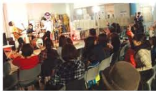
親子でノリノリ♪(区役所)

12月6日(土) 塚本HOWLIN'BAR open19時 start20時 前売¥2500 当日¥3000 (いずれも+1ドリンク) www.soradanchi.com