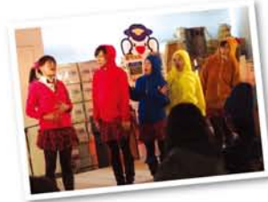
劇団そとばこまちのアイドルユニット「STB138」。歌やダンスはもちろん、コントもできます。

11月8日、淀川区役所が、区制40周年を迎える「淀川区」をお祝いするイベント『YODOGAWA EXPO 40th』を開催。「淀川区をギュッと楽しんじゃえ!」をテーマに、淀川区を愛するアーティストによる「乾杯ライブ」や協賛企業による「子どもワクワク体験ブース」があり、終日賑わいました。企画、運営、司会、音響などすべて職員さんの手づくり。「今後も足を運びたいくなる区役所をめざしてがんばります」