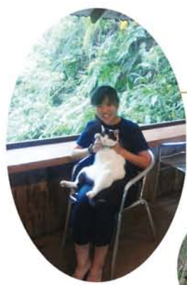
◀映画に出ていたカレー屋さんで、「出演」していたネコと、パチリ。窓の外のグリーンが嬉しい。お腹一杯、自然パワー満タン!

「標的の村」でカレー 写真展の宣伝隊も体験 次の日には別の友人と、高江にカレーを食べに行きました。高江は、ヘリパット建設に苦しむ集落があり、ドキュメンタリー映画『標的の村』にもその様子が詳しくおさめられています。その映画に出てくるお店はカレーが有名で、行つてみると映画に出てきたネコちゃんもいました。素晴らしいやんばるの自然の中で美味しくカレーをいただき、日頃の疲れが癒やされました。ネコちゃんとも写真をパシャリ。その後6日間は、お二人が所属する市民団体「市民ネットやんばる」でお手伝いをさせていただきました。 私が参加した期間「市民ネットやんばる」では写真展を開催していました。写真展を通し、辺野古の海大浦湾の素晴らしさを沢山のの人に知つ