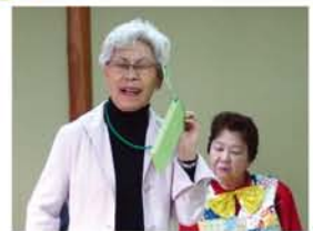
「旦那さんが痴漢しました。今すぐ示談金を振込んでください」と脅迫するも、「その手口、回覧板で見たよ」との友人の助言で、電話を切られて悔しがる社員。