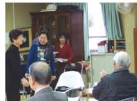
「息子のためなら100万円くらい」とへそくりをバラしてしまった母親。父親の「甘やかすな」の一言で詐欺は免れましたが夫婦喧嘩になり、会場に笑いが。