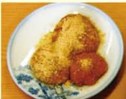
スキムミルクでカルシウムアップ!