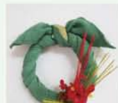
風呂敷リースに水引と花をあしらうと、一気にお正月気分の飾りになりました。

飾りは松竹梅や羽子板なんかもいいね。こんな風に四季折々、24節季くらしいのペースで考えてみると、いい気分転換になるよ。春なら黄緑や黄色で菜の花バージョン、桜色もきれいなね」