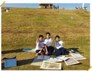
「この高さまで水がきます」土手を利用して区内の津波高体験を、中学生が説明。