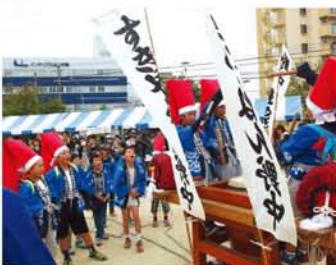
▲野中。みんなで声を揃えて「打ちまーしょよ!」▶新北野・成小路神社のだんじり保存会。踊り子さんもスマイル。

「至催・淀川区役所 運営・実行委員会」 「アールでオーブニング。区内の幼稚園児の演技や、こいや踊り、子ども会の子どもみこしパレード、民謡総おどりのほか、吉本芸人のパフォーマンスや、ホール内では列車戦隊トッキュウジャーも登場して大賑わい。総勢3万3000人が来場しました。運営や出店、プログラムに関わった皆さん、お疲れ様でした!」