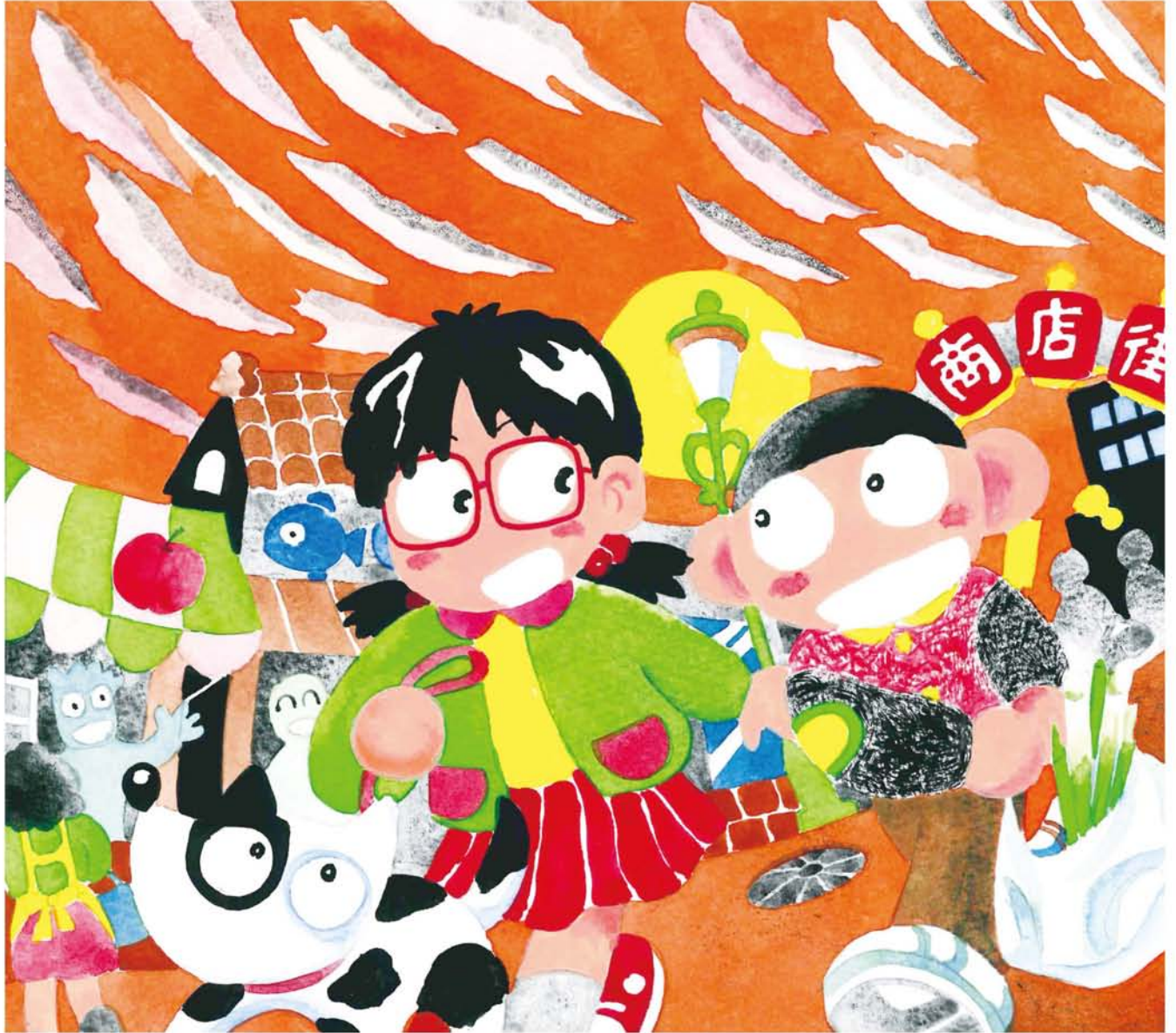
「へーいらっしゃーい!」「やすいよー!」と いせいのいいこえ ゆきかうおばちゃんたちはベチャクチャおしゃべり (全文はthe-yodogawa.jpで) ツチハシツヨシ・画

★発行所…淀川通信舎 〒532-0023 大阪市淀川区十三東3-12-27 ★編集・発行人…乃美夏絵 ★毎月25日発行 ★発行部数:90,000部 Tel.06-6301-8370 Fax.06-6838-3881 ☒編集部:hensyu@the-yodogawa.jp 営業部:eigyo@the-yodogawa.jp