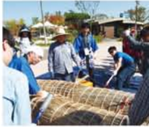
バットで叩くと同時に紐を引いて、葦の束をギュッと結束。