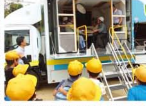
震度7の揺れを見た子どもたちは「電気割れてる!」「タンス倒れた…」と騒然。▶防災リーダーは、車のジャッキを使った人命救助に取り組みました。