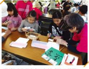
子どもたちも点字の名刺づくりに挑戦。この後、名刺を読み合います。