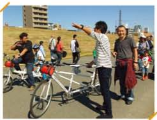
2人で運転するタンデム自転車。目が見えない人も、「淀川の風、気持ちがいい!」