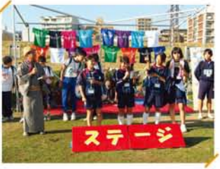
最後は中学生ボランティア30名が、自然を大切にする「川との約束」を宣言。