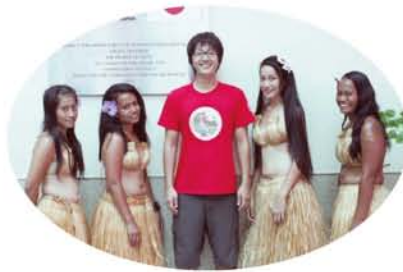
伝統的な衣装の女性と筆者。2013年11月に高知県より記念直行便が就航した時のもの。日本の援助で改修工事が行われたポンペイ国際空港にて。

ミリ、内陸部ではおよそ10,000ミリにも達する、世界でも屈指の多雨地域です。私は環境