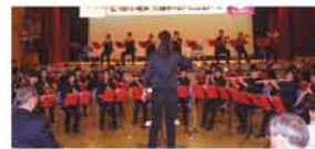
吹奏楽部の演歌メドレーに会場から拍手の嵐。ダンス部1年は海賊をテーマに、2年は警察の衣装で踊りました。