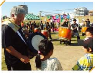
和太鼓の「鼓組」。韓国の太鼓も披露されました。