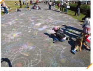
毎年すばらしいらくがきアート。最後は、中学生がきれいに掃除してくれました。

出展・出店・出演の皆さん、暑い中お疲れ様でした。それから設営から撤収まで手伝ってくれた中学生ボランティアの皆さん、フェスティバルを支えてくださった各種団体、企業の皆さん、ありがとうございました。(実行委員会)