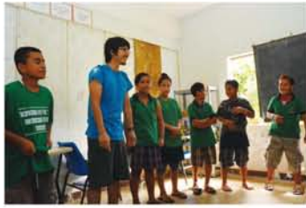
7年生(日本の中学一年生)を対象にした環境教育。

ミクロネシア連邦は、グアムの南赤道より少し北に位置し、大小607島からなる島国です。私が住むポンペイ島は国内最大の島で、屋久島の約3分の2の大きさに約3万5千人が住んでいます。気温は1年を通して殆ど変わらず、年平均で27℃。雨が非常に多く、人々が多く住む島の沿岸部で年平均およそ5,000