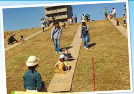
ダンボールDEころころ。十三地域活動協議会の方が、運営を一手に引き受けてくれました。

見事な快晴で、来場者はおよそ8500人。名物のダンボールDEころころや、らくがきアートなど「遊びエリア」をはじめ、プラスバンドや人形劇、こいや踊り、和太鼓、ブルース、ワールドミュージック等多彩な「ステージ」に、「防災エリア」、「環境エリア」など50を超えるブースはどこも盛況。フリーマーケットも約100店舗並んでたくさんの笑顔が見られました。