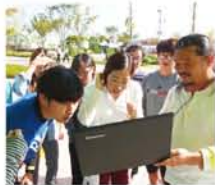
葦船の写真を見せてもらい、歓声をあげる大学生たち。