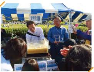
田川にある応用地質株式会社の皆さんによる液化実験。一瞬でまちが浸水する姿に「うわ〜!」