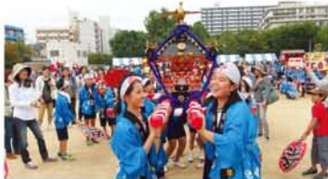
活気いっぱいの「こどもみこし」。各地域の紹介タイムになるとさらに熱気を帯び、「ワッショイ、ワッショイ!」見応えバッチリですヨ。 ▲新東三国。▼西三国。