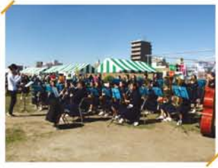
ステージは、十三中学校吹奏楽部の演奏でオープニング!