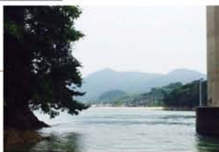
遠くに見える最寄の家屋。(中国地方)

この活動に関わる限り、私のスカウト活動の旅も終わらない。今秋卒業した彼等が、4年間の活動を輝くものであったと心に留めてくれたなら、私も人生の「旅」が、少しはできた様な気持ちになれそうだ。