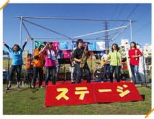
ゴスペル「ブーンアースクワイヤ」と洋楽「仁バンド」のコラボ。シブイ大人のステージも。