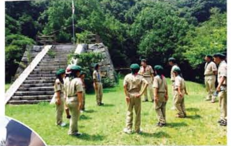
▲朝礼で、前日の優秀スカウトを発表。 ▼先輩から後輩へ、ロープワークの指導。スカウトの旅は、日々の研鑽とひらめきが大切なトでの話だ。

た店主が開いた店があった。店主はそこを「大阪最果てのゲストハウス」として多くの旅人仲間を泊めた。そこで様々な「旅人」との出逢いがあった。旅人から語られる話は何れも魅力的で、社会人であった私を駆り立てた。彼等は帰る家も、明日の宿も、旅が終わってからの生活も担保せず、その全てを差し出す代償として、旅する機会を得て何かを求めていた。私が思う「旅」はまさにこの在り方であり、旅人の生き方だと思ふ。飽くまでも自身のこだわりであるが、その経験のない私は、単にどこかへ行くことを「旅」とは表現し難い。