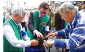
同ライオンズクラブ・区役所・淀川警察署・淀川消防署・淀川防犯協会・警友会淀川支部が一体となって活動。

大阪新大阪ライオンズクラブが10月15日、恒例の「ひたたくり・放火防止キャンペーン」を実施。同事業は、新大阪東三国近隣が、日本一、ひたたくりが多い地域として