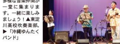
多様な音楽仲間が一堂に集まります。一緒に楽しみましょう！▲東淀川高校吹奏楽部。▶「沖縄ゆんたくバンド」

東淀川高校吹奏楽部、英真学園軽音楽部、柴島高校箏曲部、三津屋子ども会音楽クラブのコーラスに、「かま哲ちゃん」「かま哲ちゃん」「沖（ポップ）」や「沖」