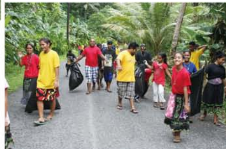
(上)一日に約14トンのごみを持ち込まれる(当国4州のJICAボランティア及びカウンターパートが2012年に実施した廃棄物搬入量調査"J-AWARE 2"による)廃棄物処分場。 (下)地域のごみ拾いイベント。

先進国からの物が入ってくるようになり、人々のライフスタイルも大きく変化してきています。私は子ども達に環境、ごみに関する教育をしています。彼らが大人になった時、豊かで素晴らしい自然があるポンペイ島であることを願ってやみません。