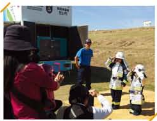
消防署ブースでは、起震車のほか、子どもたちも制服を着てパトリ。