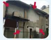
セメントで塗り固められた壁の部分がよく分かる1枚。(十三本町周辺)

手前のドアはそのままですが、昔あった大きなドアと窓の枠を残したまま、塗り込めています。窓にはその後小さな窓が、ドアだった部分（奥側）は壁になっています。