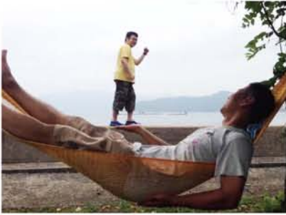
ハンモックで日々の疲れを癒す、団委員長。

多くの方は「旅」という言葉を耳にしたら、鞆に荷物を詰め込み、どこかへ行くことを想像するのは容易いだろう。それを旅と表現しても何の問題もない。