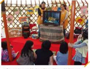
ゲルの中では絵本の読み語り。外側には区内の小学生のキッズ川柳を展示。