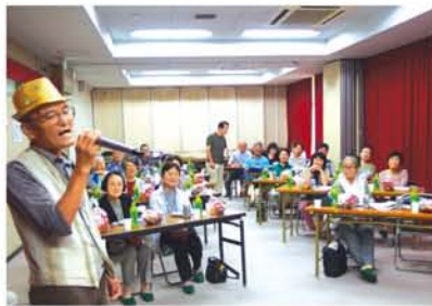
「ミラーボール」はないけれど、「ミラーボージ」があります」と用意されていたキラキラのハット。かぶるだけで何だかハッピーな雰囲気。