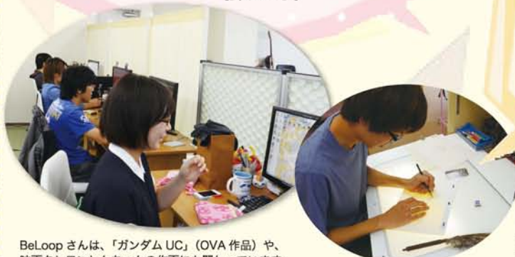
BeLoopさんは、「ガンダム UC」（OVA 作品）や、映画クレヨンしんちゃんの作画にも関わっています。

A 今は東京からのアニメの仕上げや原画の仕事が中心だけど、将来的には滋賀をもっとアピールできるアニメを制作したい。そのアニメをツールに、県とも協力して町興しをしていきたい。例えば、琵琶湖を自転車で一周する「ピワイチ」や近隣の商店をもっと盛り上げたいな。