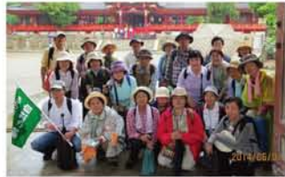
気持ちのいい季節、一緒に歩きませんか? 初めての方も大歓迎です!

第10回目は10月8日(水)、京阪淀駅〜京阪中書島駅を歩きます(NPO法人「よどがわ」自然と緑)。