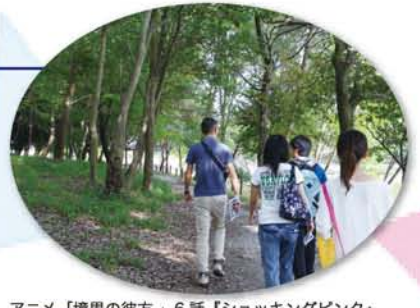
アニメ「境界の彼方」6話「ショッキングピンク」に出てくる橿原神宮みちを歩いてるところ。登場人物になった気持ち？！

「交流ノートを置いてから、これまでに比べて若いお客様が増え、経済効果はあったように思います。今後も彼らの活動に協力しつつ、売り上げも徐々に上げていけるように、もっとお店がアピールできたらいいね」と、マスター。