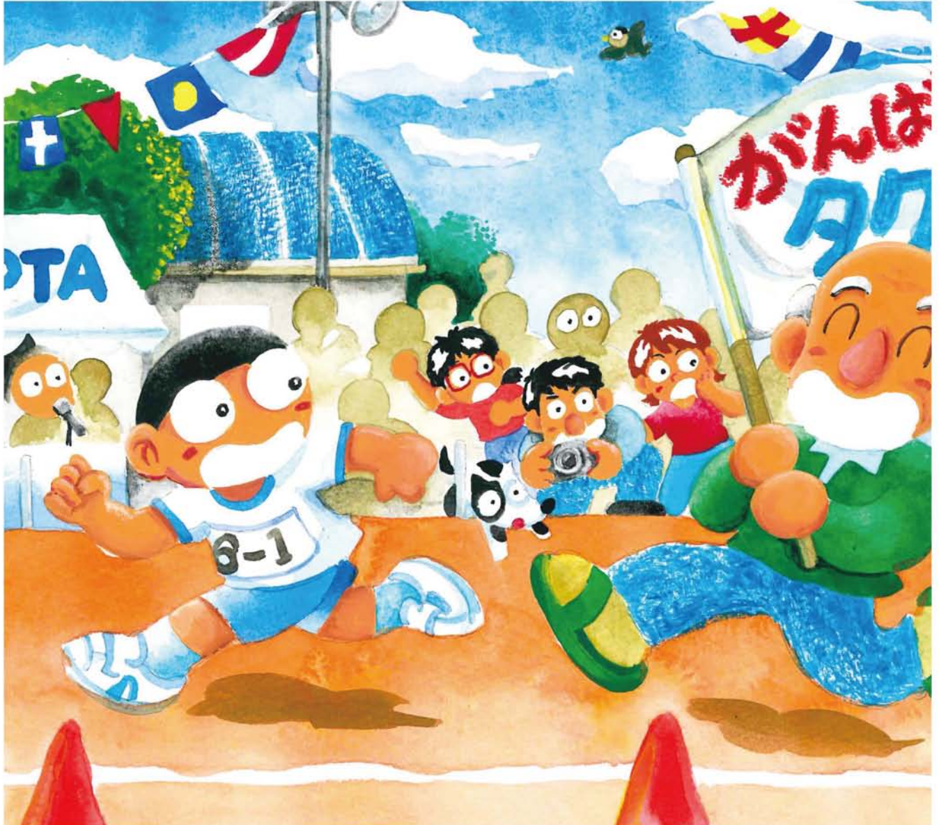
タクヤはしるはしる…いまのところトップです つづくはおじいちゃん え…おじいちゃん？

★発行所…淀川通信舎 〒532-0023 大阪市淀川区十三東3-12-27 ★編集・発行人…乃美夏絵 ★毎月25日発行 ★発行部数:90,000部 Tel.06-6301-8370 Fax.06-6838-3881 ☒編集部:hensyu@the-yodogawa.jp 営業部:eigy@the-yodogawa.jp