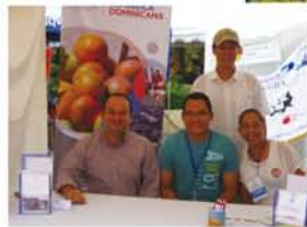
Baniのマンゴー収穫祭を共催する活動先のドミニカ共和国輸出投資センター(CEIRD)のスタッフ。Baniのマンゴーの普及と販売促進にも一役買っています。(後方が筆者)