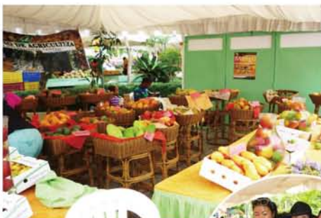
マンゴーもこの様に展示するとカラフルで絵になります。特にガラス瓶に入ったマンゴーはテーブルの上にも飾りたくなる程の芸術品です。

私の住むドミニカ共和国の首都サントドミンゴから車で約1時間程(約60km)の所にある小さな農業の町Bani(バニ)で毎年開催されるマンゴー収穫祭に行きました。丁度、定期的にマンゴーの収穫が始まり市場に出回るのを機会に、生産者が自家農園のマンゴーを持ち寄って今年6月5日〜8日迄の4日間に