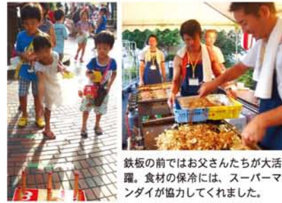
鉄板の前ではお父さんたちが大活躍。食材の保冷には、スーパーマントライが協力してくれました。

31年前にマンションができて、その翌年から毎年開かれていたレックスタウン新高の夏祭り。「〇157の流」行から中断したままでしたが、4年前にゲームコーナーが復活。