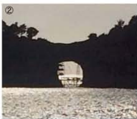
①グラスボート内部〜娘と家内、母の4人で乗船。②白浜の名勝「円月島」へ保全工事の足場が見える。③海女の海中ショー。水が濁っていて海底は見えない。

当選していいにも関わらず)。結論から言うと、台風後も連日続いた通り雨のしわざで海水は濁っていた。魚も幾分かは見られたものの、期待していたほどの海底ビューは臨めなかった。海中ショーの海女さんの演技も…心なしか虚ろに見えた。そのうえ白浜のランドマーク円月島は保全工事の真っ只中。肝心の部分(中央の海食洞)に工事の足場が堂々とシルエットを描いていた。