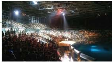
ライブ感あふれる夜のイルカショー(の客席)。ファンタジックな演出とイルカの熱演に、満員の会場が沸いた。

午後8時半まで営業の夏場はトワイライト入園券がお得。午後4時半を過ぎれば利用可能だ。お目当てのイルカショーは(実は3度目だったが)ナイトショーは初めて。往年のデイスコを彷彿させる照明と打ち上げ花火を駆使した演出には実際に、度肝を抜かれた。その圧巻さは一見に値する。ぜひお勧めしたい。