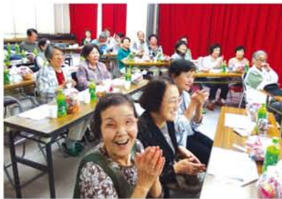
「すばらしい！アンコール！」「いい声やね」客席から声援が飛び交い、ときには一緒に歌声も。