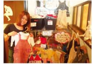
「かわいい服がいろいろあります。お立ち寄りください」とスタッフ。

「子どもは、すぐ大きくなりますよね。カフェ内に、サイズの合わなくなった子ども服を交換できるスペースを作りました。袋もご用意していますので、持ってくるだけでも、持って帰るだけでもお気軽にご利用ください」と、ケーキ&カフェダイニング「ポナボン」のスタッフ。一度見に行きませんか?★お持ちいただく方へ。お洗濯などを済ませ、きれいな状態で店舗スタッフにお渡しください。※店舗情報は3ページ 問・4805-8780 (ポナボン)