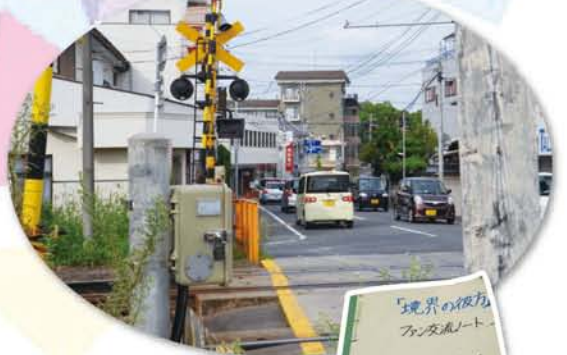
「境界の彼方」のオープニングに登場する踏切。

交流ノートには、「～から来ました」とか、好きなキャラクターの絵が描いてありました。遠いところでは香港やイングランドから訪れたというファンも。日本アニメの人気ぶりがうかがえます。