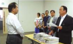
「北海道や沖縄からも署名が送られてきました。ありがとうございました」と商店街の方々。

株式会社・区役所の協力を得て実現。後援2チームの他、6つのU-11チームが参加し、家族や関係者が見守る中熱戦を繰り広げました。予選12試合後、トーナメント戦が行われ、塚本ウイングスFCは6位。FC淀川は7位の成績に終わりました。 「残念だったチームも、来年は1つでも上になれるように」。皆さんの中から「さすらい選手が出るのを楽しみにしています」とFC淀川