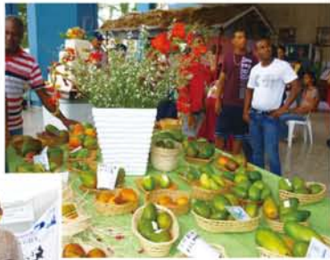
姿、形、味も色々なマンゴー。名前もそれぞれに付けられていて一度には覚えられません。香りがあり甘いものから甘酸っぱいものまで色々展示されています。

開催されました。Bani(バニ)の市役所前の小さな広場に屋台で異様なマンゴーやジャム、ジュース、植木、花、はたまたゲーム機までが販売されていました。この子供達にはマンゴーよりもゲーム機の方が楽しい様で、大勢が集まりゲームに熱中していました。当地でも日本の子供