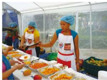
17種類のマンゴーが味わえました。清潔なビニールテントで、入り口では手を消毒して貰ってフォークと紙皿を受け取り甘さ、堅さそれぞれのマンゴーを3切れほどずつ味わって行きます。

生産者の皆様が販売されているのですが、皆さんの口々から日本へも輸出をしたいとの要望をお聞きます。日本には試験的に輸出が開始されましたが、量と品質の確保が難しく、まだ本格的にはなっていないです。日本市場へドミニカ共和国産のマンゴーが沢山輸出され、美味