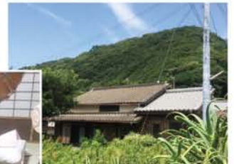
椿にある父の生家。毎年お盆には「海の家」と称して家族で訪れる。「おじいちゃんといっしょに、ご先祖にお念仏をとなえたよ」(娘)