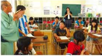
▲6年生「たたかれた 血を吸ったのに 御臨終」100点だ テストがほくを ほめている「組体操 痛いよ砂が いじめるよ」▶5年生「ゴヤくん あついよあつい 色変わるよ」「パーベキュー途中で雨降リヤケ食いだ」。ユニークな句がたくさん生まれました。「とにかく思いついたことを書きながら句になるように考えました」と、5年生。

「川柳は、自分や誰かの思い、ときには物の立場になつて、『気持ち』を詠みます。例えば