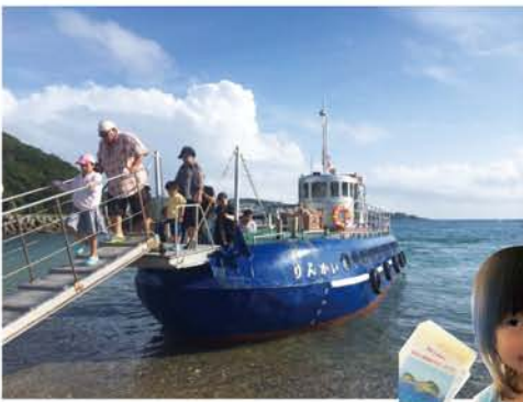
グラスボート外観〜港ではなく砂利浜に着岸する。「せと」と「りんかい」の2隻が運行。