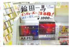
三国新道商店街内 10:30~20:00 土日は~19:00 月曜定休 (問)6392-3667