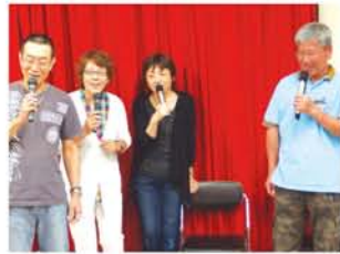
“いつも歌わん同士”という男性陣に誘われ、4人で「青春時代の～真ん中は♪」