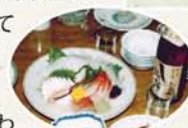
(左) 酒の肴と絞らたての新酒。