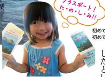
初めて出した読者プレゼントに初めて当たった娘。