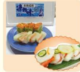
●他に、紅鮭・ししやも・さんまの「飯寿し」 や「北海かぶら寿し」などの乳酸発酵させて 作った郷土料理飯寿しも味わってみたい一品。

兼宿泊施設のことです。「番 屋漬」は、北海の厳しい漁を 終えた漁師たちが、憩いのひ ととき、トレットレの鮭をキャ ベツに挟んで漬けたものを肴 に一杯やつたところから由来