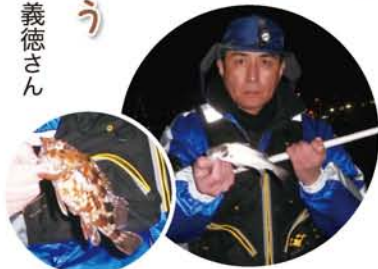
1月14日夜、寒い中アオイソメでの夜の落としこみ釣りをやってみました。2時間ほどでカサゴ(ガシラ)15~20cmを12匹、セイゴ(スズキの幼魚)を3匹。この時期としてはまずまずの釣果でした。

淀川区にとつてその名の通り身近な淀川は、大きくて水量も多く、大阪市の大切な水源となっています。少し上流の淡水域ではコイ、フナ、ソウギョ、ブラックバスなどが釣れ、アユも帰ってくるようになりました。