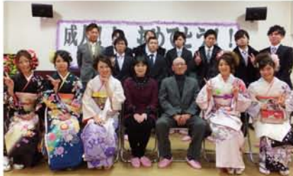
当時の担任の先生も駆けつけてくれ、タイムスリップしたみたい。この後、午後から始まる区の成人式に地域活動協議会メンバーで会場までお送りしました。来年の新成人の皆さんも楽しみにしてくださいね。

来年も予定していますので、来年新成人になられる皆さん、保護者の方々、ぜひ十三小学校にお集まりください。地域の方々も一緒に参加してお祝いしていただけたらうれしいです。