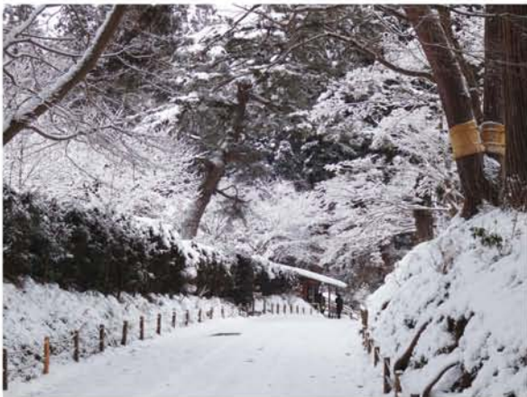
車のトラブルで遅くなり、薄曇りの空がバックでは、樹氷をきれいに写せなかったのは残念。写真(上)は中尊寺見学後に下りた雪見坂。