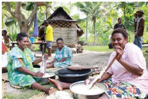
女性たちが、いもをすり下ろしています。これから、島の伝統料理「ラップラップ」を作ります。

私は現在、大阪市内の小学校を休職し、現職参加として青年海外協力隊に参加しています。活動先であるフレッシュウオータ小学校は、島内一の大規模校です。幼稚園から8年生までの生徒数は1300人。