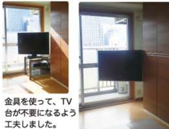
金具を使って、TV台が不要になるよう工夫しました。