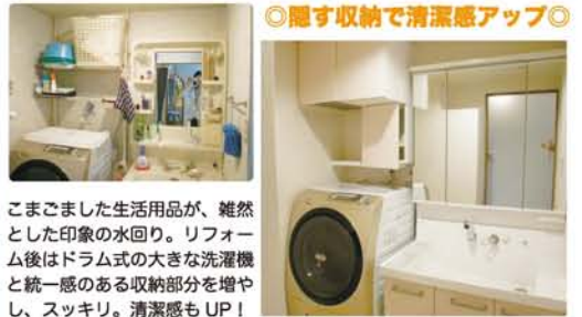
こまごました生活用品が、雑然とした印象の水回り。リフォーム後はドラム式の大きな洗濯機と統一感のある収納部分を増やし、スッキリ。清潔感もUP!