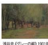
浅井忠(グレーの都) 1901年

◆開催中～2月23日(日) 9時～17時 月曜休館 京都市美術館(京都・岡崎公園内) 一般500円、高大生500円、小中生300円 【問】075-771-4107