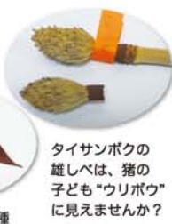
タイサンボクの雄しべは、猪の子ども“ウリボウ”に見えませんか？