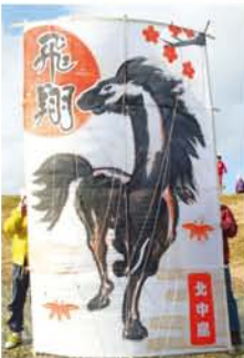
▲「後は当日力を合わせてあげるのみ!」年末の大凧づくりで気合い抜群だった三国連合(上記記事)。見事一発成功で、大空へふわり。区長賞をゲットしました。◀きれいなイラストでデザイン賞を勝ち取った北中島連合。