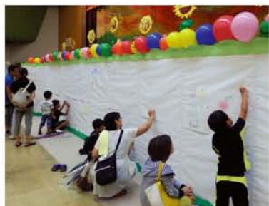
意外と大人も夢中になる「おえかきボード」。