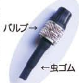
バルブ ← 虫ゴム

空気を入れても2〜3日でベチャンコになるときは、次の要領で確認してください。 まず、空気を入れる部分の虫ゴムを点検。 切れていたり穴があいていたら取り換えましょう。 次にタイヤの点検。ガラスや釘、押しピンが刺さっていないか見て、刺さっていたら抜いてください。抜かずに空気を入れて乗ると、タイヤ内部のチューブに穴があいば