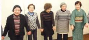
フィナーレは、みんなで手をつないで合唱。数年前より恒例になり、今年は参加者全員で大きな輪をつくりました。