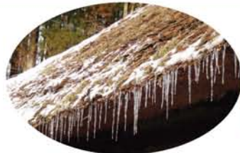
軒下を歩くとも頭に突き刺さりそう…。

翌朝バ スは、まず 遠刈田 (とおがっ た)温泉 のこけし 工房村の 丑蔵庵 (うしぞうあん)に立ち寄る。藁葺 きの軒先に大きなツララ。久しぶ りの氷柱に感動。数年前、鳴子 温泉のこけし工房を訪ねたが、 一概に「けし」といっても場所によ って顔や胴の模様は独自の特徴 があつて面白い。 昼食の後、スキー場「すみかわ スノーパーク」から雪上車に揺 られてお目当ての樹氷見物へ。 氷に包まれた針葉樹は、想像し ていた樹氷と言うよりまさに雪 のモンスターであつた。 パウダースノーは、握つても固 まらない。氷点下九度の吹雪の 中で樹氷の周囲を歩いたが、十 メートルの歩行も下半身が新雪 に埋まって十分余りを要し、膝