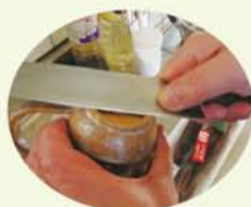
包丁の切れ味は料理人の命。まずは陶器の糸底で2、3回ジャツジャツと研いでから。

僕は新鮮なイカが手に入ったら作る。作りながら、明日これをアテにキュッと一杯やったら旨いやろなあ…と、ワクワクする。嬉しいなってくる。