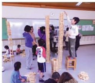
時間を忘れてハマるかも？カプラもあります。