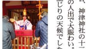
笑顔が魅力的な福娘さんたち。3日間、お疲れ様でした。

1月9日〜11日、神津神社の十三夜は、総勢2万人の人出で大賑わい。初日はミソレ混じりの天候でしたが、それでも奉納催物は大盛況で、笑福亭仁勇さんのバナナの叩き売り・南京玉すだれに始まり、夕方は長柄地車囃子。