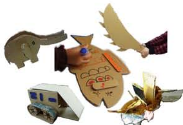
ダンボールのプロに教わりながら、動物、乗り物、食べ物…ゆるキャラ衣装も作っちゃう？