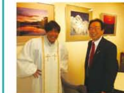
株式会社谷岡ドレス [新高2-8-8]

前回から引き続き、制服作りの老舗谷岡ドレスさん。取材に答えて頂いたのは、超若々しい、78歳現役バリバリの谷岡会長。始まりは、絵にかいたような貧乏学生時代。某有名大学の医学部に籍中に始めた、アパレル関係のアルバイトをきっかけに起業。医学部にいたことも驚きだが、それ以上にびっくりなのが、会長の人脈の広さ！誰もが知ってる超有名な、無名の大工さんまで。会長に「どうすればそんなに、色んな人とつながり