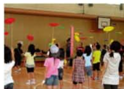
ジャグリングを習って、ステージで披露しませんか？

モンゴルのお話と、ひつじ作り。工作費は500円。モンゴルの子どもの活動費になります。