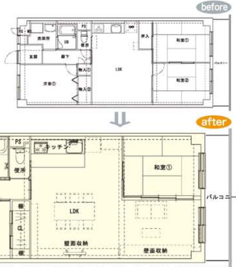
長年の生活でたくさんあった家財も新しい生活のために、スッパリと処分されました。