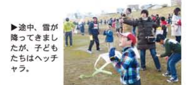
▶途中、雪が降ってきましたが、子どもたちはヘッチャラ。