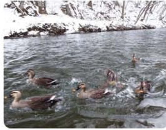
一袋百円の餌に集まる鴨。