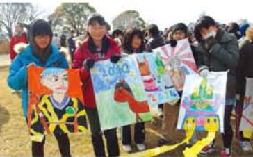
▲加島小6年生の仲良し。皆さん凝ったイラストがかわいいです。この絵(左)は何かモデルがあるの? 「いえ、オリジナルです(笑)」しぶいです。