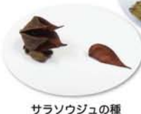
サラソウジュの種

だったのが「ボックスウッド」。これは十三から加島に行く道の側道に植わっています。たまたま実を手にとってみたらパカッと割れた。そしたら1個1個がかわいらしい形をしていました。