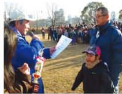
▲デザイン、フライトとともに高得点だった東三国連合が、実行委員長賞に輝きました。▶大凧コンクールが始まると、とたんに風が穏やかに。それでも高く舞い上がった新高連合の凧がフライト賞に。どの連合も年々力が入り、「今イ風がきてる!」などレベルも上がっています。皆さんぜひご観戦を!