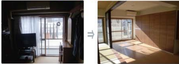
昼間でも暗かったのですが、リフォーム後は陽射しがリビングまで届きます。