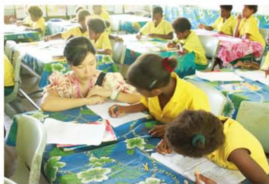
「授業を理解してくれたかな？」生徒たちの机を回って、勉強の進みぐあいをチェック。工夫した授業の効果がみられると、とてもうれしい!

ここで私は1年生から6年生に、主に算数と音楽の指導をしています。算数の理解度、計算能力は日本の同学年の生徒と比べると低いです。