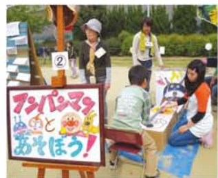
「よどがわおやこ劇場」さん特設のゲームコーナー。挑戦しに来てね！