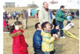
◀凧あげのコツを教えてもらって、「やったあ、あんなに高い所にいった!」と満面の笑顔。