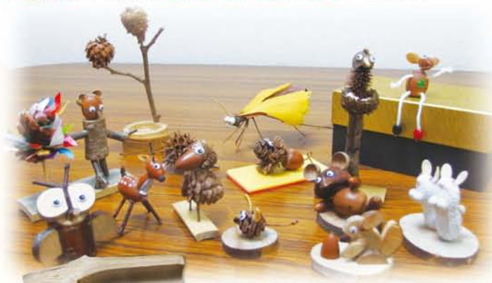
ボックスウッドの実で作ったミミズクの親子。