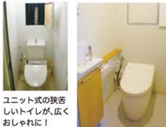
ユニット式の狭苦しいトイレが、広くおしゃれに!