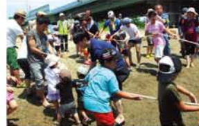
今年も10周年を記念して、地引き網にも挑戦。あらかじめ、漁師さんが仕掛けてくれた網を引くと、ハゼ、スズキ、ウナギも！

「ママ見て！（シジミ）いっぱいある！」「カニや！これも食べられるん？」子どもたちは大はしゃぎ。「ちょっと休憩しよ」と言われ、川の中での生き物に夢中です。7月7日、淀川河川敷で第10回「淀川でしじみ“獲り”が開かれました（大阪湾再生市民プロジェクト）。「生態系にと