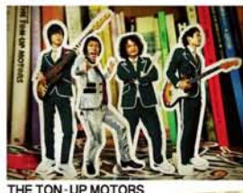
THE TON-UP MOTORS

ADV ¥2000 / DOOR ¥2500 ローソン・FANDANGO(予約可)にて 好評発売中!