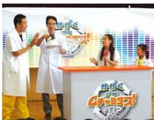
沸点が-200℃なので常に沸騰している『液体ちっ素』。冷え冷えヤカンの登場で授業開始。▶児童も実験をお手伝い。最後は「ジュース」を入れて出来上りの試飲(試食?)も。

その正体が「液体ちっ素」で、沸点がマイナス200℃という冷え冷えの性質であることを学び、「ではこの中にゴムボールを入れるとどうなる? ティッシュペーパーは? チョコは? マシユマロは? ポテトチップスは?」を実験。目の前で繰り広げられていく不