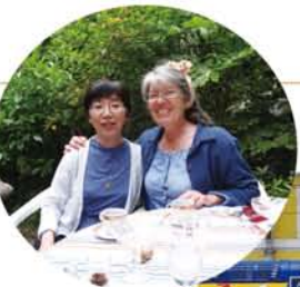
▲ホームステイでお世話になったマダム宅の庭で。妻とは初対面ですが、すっかり意気投合していました。