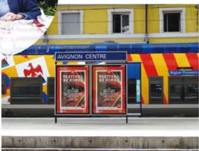
▼カラフルな電車が停車中のアヴィニオン駅。

見学できました。歴史に焦点を当てて、じっくりと旅するのも良いだろうな、と思いました。しかし…。過去に東京、モスクワ、北京を旅したことがありますが、大都会って、国は違ってもどこか似てるんですね。パリもそう。シャンゼリゼ通りは大阪の御堂筋と変わらない。銀杏の代わりにプラタナスが植わっている感じ。その国の本当の姿を見ようと思ったら、田舎へ行くのが一番です。雰囲気、人柄、景観。街の規模は小さくても随所に個性があらわれます。僕はやっぱり南仏が好きです。数年後にまたモンペリエに語学留学する予定なので、今から楽しみです！