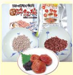
1日2%の水と、必要な塩分補給に「砕紅梅」<乾燥梅肉/梅エキス>で今年の暑い夏を乗りきりましょう。

連日の猛暑で多くの人が熱中症で救急搬送されています。水分をしっかりと補給するのはもちろん、同時に塩分やミネラルも補給することが大切です。皆さんは塩分やミネラルをどのようにして補給されていますか? 私もいろいろ模索した結果、最適な食品を見つけました。「梅干し」です。塩分を取り過ぎず、手軽にどこでも1粒口に含めば爽や