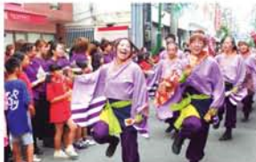
商店街の依頼に「こいや祭り実行委員会」が応え、祭りが行われるようになって6年目。▲今年が高知のよさこい祭り全国大会に出場する社会人チーム「夢源風人」も来場。▶総踊りもノリノリでした。

オンドレツチ！ なんぞここにっ 次こそはオウエラを 倒さう…ちイ 見た目を生かして バイト中