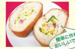
簡単に作れておいしいですよ!

朝食をとりましょう! (そのこ) 若い世代 近年、若い世代を中心に朝食をとらない人が増えています。作る時間がない、食べる時間がない、食欲がない等の理由、朝食ぬきダイエットで体重を減らすためという人もいるとか。平成23年の国民健康・栄養調査で20〜30代でとっていない人が多く、3人に1人が朝食ぬきという結果でした。 朝食は一日の活力源です。30分早く寝て、早起きし、朝食を食べる時間をとりましょう。毎日決まった時間に朝食をとることで、生活リズムが整います。 栄養バランスのよい食事を3食きちんと摂るようにしましょう。