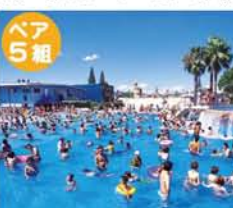
入園&プール料金(アトラクションは別料金) 中学生以上2,200円 2歳〜小学生1,200円

全長210mの流水プール、すべり台や噴水など 仕掛けが楽しいキッズプール、奥に行くほど深い なぎさプール、景色を眺めてゆったり泳げるシエ スタ…。「ザ・ブーン」で大人も子どもも大満足!