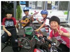
子どもたちは希望の星。彼らがキラキラと輝ける未来のために、もうひと頑張り!

でも、落ち込む暇はなかった。限りある物資を分け合い、助け合い、皆で協力し、必死に生きた。電気がないせいか、夜空の星は本当にきれいで一日の