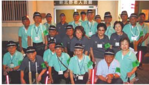
7月5日は24名が参加。7・8・9月は町内巡回後に河川敷を歩き、花火の注意なども呼びかけています。お疲れ様です！

…15時～のお楽しみ企画、どなたでも参加できます！バザーもあり！（盆踊りは23・24日19時～）三国本町公園。