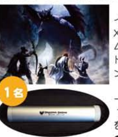
©CAPCOM CO., LTD. 2012, 2013 ALL RIGHTS RESERVED.

広大な地下世界が広がる「黒呪島」で、凶悪な 魔物と戦いながら危険に満ちた冒険を堪能せよ!