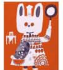
『森のレストラン』 seesaw. (日本)

◆8月17日(土)～9月23日(月・祝) 10時～17時(金曜は19時まで) 水曜休館 西宮市大谷記念美術館(西宮市中浜町4-38) 一般800円、高大生600円、小中生400円 【問】0798-33-0164 5組10名