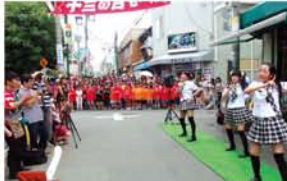
十三地点のアイドルグループ「Style」も登場。「メンバー募集中です！」

7月6日、今年もつばめ通り商店街で「こいや祭り」が行われ、関西各地から9組出演し、パレードや総踊りなどで大賑わいでした。