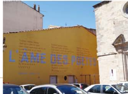
(上)円形競技場。闘牛祭の準備のため、中には入れませんでした。(下)トレネの代表作「詩人の魂」の歌詞が書かれた壁。

にトレネの曲が流れています。それからアヴィニヨン。14世紀にローマ教皇宮殿が建てられ、歴史の脚光を浴びてきた街です。観光地として有名で、日本