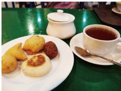
「サーボン」の時間。ヘディカをつまみ、お茶をいただきながらおしゃべりを楽しみます。野菜や魚フレークの入った揚げ春巻きのようなものや、ドーナツのような甘いものもあります。

サーボンといって、モルディブ人は夕方に甘いお茶とショートイーツを楽しみます。ヘイカと呼ばれるショートイーツは魚の中につめた揚げ物です。チリが入っていて辛いものもありますが、クセになる味。気づいたらまた一つ口に運んでしまっています。お気に入りのヘイカで今日も一休みです。