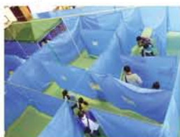
東北での震災支援を機に生まれた「チームみつや」が設置した巨大迷路、防災を考えるスタンプラリーでした。