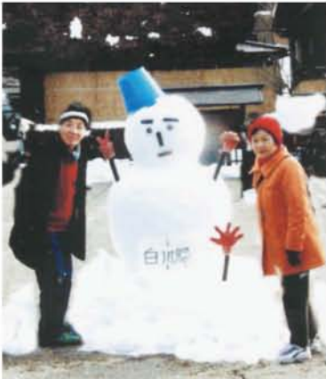
白川郷で見つけた雪だるま。冬ソナ気分、バチリ。

一日目は新大阪駅を10時前に出発、最初の目的地高山へは2時過ぎに到着。早速、人力車に乗り、「小京都」めぐりへ。人力車からの高い目線でゆらりゆらりと揺られながら、宮川