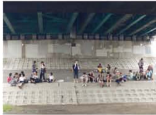
豊里大橋、鳥飼大橋、淀川新橋…休憩は橋の下で。おにぎりやアメちゃんでも元気アップ。