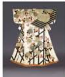
白輪子地竹垣牡丹様小袖 江戸時代・18世紀 ボストン美術館蔵

◆[前期] 開催中～5月12日(日) [後期] 5月14日(火)～6月2日(日) 9時～17時(金・土曜は19時まで) 5/7・13・20・27休館 奈良県立美術館 一般1,000円、高大生700円、小中生400円 【問】0742-23-3968 10組20名