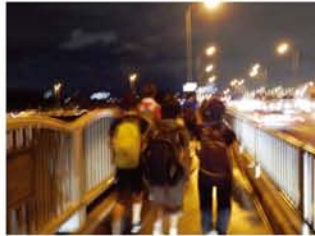
長い枚方大橋。渡りきって降りたところがハーフゴール地点。「後、ちょっとや！」