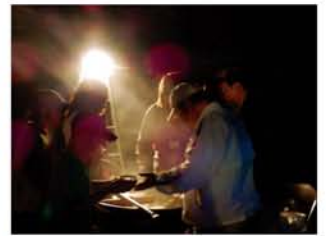
「お疲れ様！」実行委員会による豚汁の炊き出し。雨と汗で冷えた体に沁み込みます。

西中島の河川公園を昼に出発し、遊歩道を歩いて枚方大橋へ。折り返して一晩歩き通し朝日の中ゴールする「淀川ナイトウォーク」。クチコミで少しずつ参加者が増え、昨年は150人がチャレンジしました。今年からは、十三中学校の「学校元気アッププロジェクト」の一環となり、地域と学校、家庭が連携する課外活動として認定されています。「ただ、歩くだけです（笑）。ひと晩歩いて足の痛みと眠たさの中から、このイベン