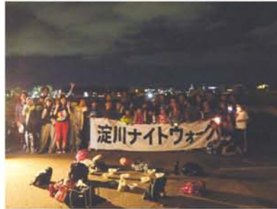
22時38分、枚方大橋の下で記念撮影。「このまま歩いて朝から仕事に行く」という猛者もいました。