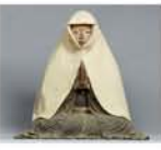
中將姫坐像(當麻寺)

◆開催中～6月2日(日) 9時30分～17時(金曜は19時まで) 月曜休館(4/29・5/6は開館、5/7休館) 奈良国立博物館(奈良公園内) 一般1,200円、高大生800円、小中生500円 【問】050-5542-8600 (NTT/ハローダイヤル) 5組10名