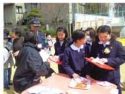
「防災訓練の為、できることは自分でやろう」と掲示。みんなが少し意識するだけで、片づけが楽になります。