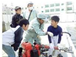
消防署と防災リーダーの指導で可搬式ポンプを体験。「フルブル震えて難しかったけど、角度や水の量を変えられた」