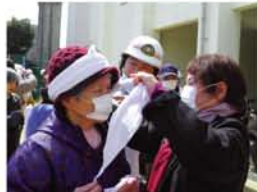
「隣りの人とやってみましょう」三角斤を包帯にする方法、腕の吊りかた、頭の怪我と課題がたくさん。