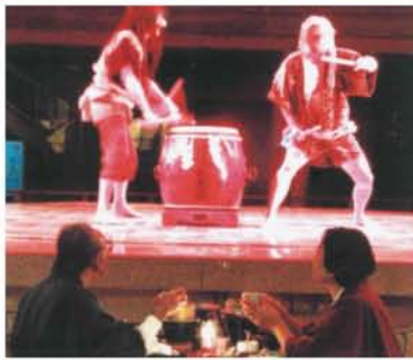
「御陣乗太鼓」を鑑賞しながら郷土料理を賞味。最高!

早めにホテルに入り、温泉でゆつたりと体を休め、リラックヌ。夕食は、郷土芸能の「御陣乗太鼓」を、目の前で鑑賞しながら。その昔、村人たちが樹皮の仮面をかぶり太鼓を打ち鳴らして上杉謙信勢を夜襲した