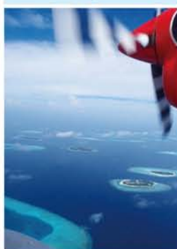
インド洋に浮かぶ環礁や島々が、真珠のような美しさ!

海に散りばめられた「真珠の首飾り」とも言われるモルディブは、インド洋に浮かぶ1200の島々からなる群島国家。すべての面積を足しても、約300平方km。大阪の面積の約6分の1という小さな国です。また、「モルディブ」とは古代インドに伝わるサンスクリット語のマロドヒーブ(島々の花輪)に由来するともいわれています。