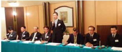
上森会長（写真中央）の挨拶のあと、各分科会から事業報告。「昨年度も月1回、新大阪駅北側の陸橋、歩道、公園を清掃しました。6月からは東淀川高校の生徒さんも参加してくれています」「ネット通信が凄まじい勢いで伸びていますが、オンラインの絵手紙も人気です。絵手紙に留まらず、いろんな手作りの物を考えていますので、ぜひご参加ください」