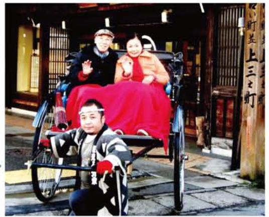
ゆらりゆら〜りと、人力車で街並見物。

光陰矢の如し 歲月人を待たず—早いもので結婚50年。昨年12月、金婚式記念旅行に行ってきました。私は沖繩が希望でしたが、家内が一度人力車に乗りたいとのこと、急遽、高山・和倉温泉へ。今回は、新幹線、ワイドビューひだ、サンダーバードと全て座席指定で、のんびりゆつたりの旅でした。