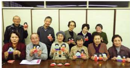
この日はひな飾りに挑戦。「先生、頭が入らへんで」「大きさに注意してね言うたやん!」「そっかあ、あはは」。手を動かしながら、おしゃべりや笑い声も弾んで、終始ワイワイ。終了後、ひな人形を持ってにっこり、パチリ!

「先の所をちよつとひねってと先生は言いはるねんけど、これはテクニクいるわあ」「帰ってもういつべん折れと言われたら無理かなあ(笑)」