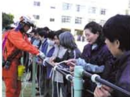
「もやい結びはちょっとややこしいです」ロープの固定、本結びなどを何度も練習しました。