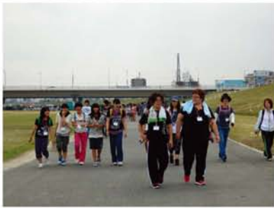
何度もゴールしたベテランさんも誘われて初挑戦する子も元気に出発！友達と一緒にだと、楽しいね。