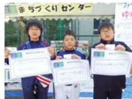
淀川区まちづくりセンター支部は、子どもたちに「三津屋をどんなまちにしたい?」と聞き取りをしました。