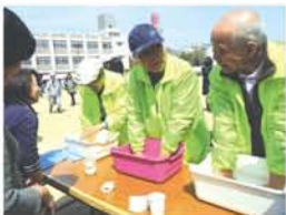
みつや交流亭や育児&育自「この指と〜まれ!」による「指湯」。役員さんたちも忙しい合間にほっこり?