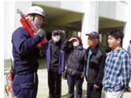
「燃えるものに近づき、退路を確認してからノズルを引っ張ります」参加者も声に出して手順を確認しました。