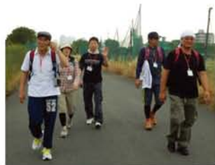
自分のペースで歩くので、一人で歩いたり、また合流したりとゆるく参加できる。