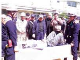
「人を運ぶ時は、頭の方が重いと知っておいてください」消防署員の説明を、皆さん真剣に聞き取っています。