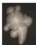
火花電(白い軌跡は、火花が出る前段階に放出されるイオンの放電路を撮影したもの)

◆開催中～5月30日(木) 展示替あり 10時～17時 水曜休館 LIXILギャラリー(伊藤忠ビル1F LIXIL大阪水まわりショールーム内 地下鉄 御堂筋線/中央線・本町駅④出口) 入場無料 【問】06-6733-1790