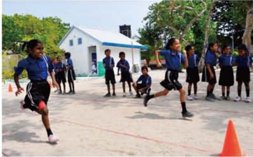
元気いっぱいの子どもたち。弾けるような笑顔にパワーをもらっています。

だから、島それぞれに小さな学校があります。小さな島では生徒も少ないけれど、子どもたちは元気いっぱい、毎日学校に通っています。学校では