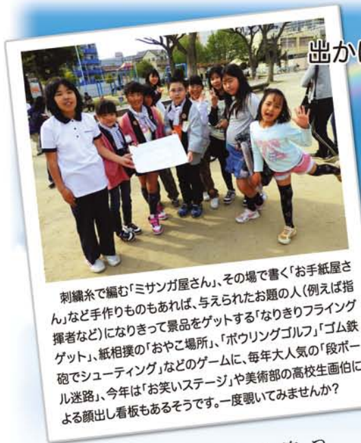
刺繍糸で編む「ミサンガ屋さん」、その場で書く「お手紙屋さん」など手作りものもあれば、与えられたお題の人(例えば指揮者など)になりきって景品をゲットする「なりきりフライングゲット」、紙相撲の「おやこ場所」、「ボウリングゴルフ」「ゴム鉄砲でシューティング」などのゲームに、毎年大人気の「段ボール迷路」、今年は「お笑いステージ」や美術部の高校生画伯による顔出し看板もあるそうです。一度覗いてみませんか？

ぽかぽか陽気の5月、少し深呼吸して子どもと一緒に出かけませんか？ 遊びませんか？そして、いろんな人とつながるチャンスをつくりましょう！