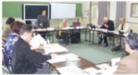
▲大阪大空襲の日と同じ3月13日に会が開かれ、「今日は僕の家が焼けた日や」「疎開先の町から大阪市内を見ると、焼夷弾が雨のように落ちていた」と当時を体験した方の詳しい話が語られました。

「戦争体験聞き取りの会」の6年間で一冊に 西三国はぐくみネット編「たかす」発行 月に一度、西三国小学校で行われている「戦争体験聞き取りの会」。 2007年から約6年間の取り組みを、はぐくみネットが編集、「一伝えたい戦争の話」と題した一冊の本になりました。