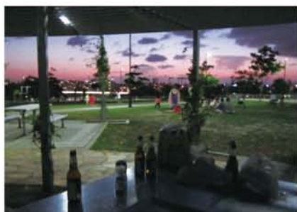
街を見下ろせる丘の上にある公園「カンガルーポイント」は、川に浮かんだ大きな崖。刻々と変化する空の色に見とれました。

つたとき、森の方からなんとなくフルーツのようなほのかに甘い香りがして、「南国やなー」とテンションが上がりました。街の建物はとてもきれいでした。ガラス張りの高層ビルばかりでなく、歴史的な造りの建物が残されていたりと、眺めているだけで楽しかったです。都会なのに狭さを感じないのは日本にはない感覚でした。今回の旅行の目的は日本人の友達を