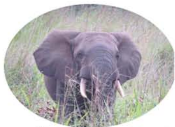
マルミミソウ。ガンバという所では、街中にこんなに大きな象が食べ物をもとめて出てきます

ノーベル平和賞を受賞し、密林の聖者と呼ばれたシュバイツァー医師が活躍されたのも、ここガボンなので、石油の恩恵で他のアフリカ諸国と比べ