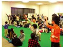
コント「淀川さん」では、最後は会場の皆さんと一緒に、ハイ、淀川のポーズ。