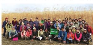
多数の参加でうれしい限りです。次回は秋には閉鎖予定の赤川鉄橋の人道橋を渡ります。こちらも必見。

「2月に実施した第2回目の探訪は、予想を上回る44名の賑やかな旅でした。皆さんも参加しませんか?」