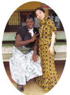
母子保健センター長と、わたしが着ている服は、ガボン布でつくられています

ボンジュール！わたしは今、ガボン共和国ニヤンガ州チバンガ市にある小さな母子保健センターで看護師として働いています。ガボンは、中央アフリカ、赤道直下に位置し、国土の80%が熱帯雨林で覆われた緑豊かな国。ニシゴリラ、チンパンジーの大型類人猿をはじめ、マルミミソウ、シタツンガなど様々な野生動物が生息しています。