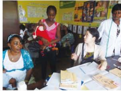
母子保健センターにて。受付で問診をしたり、お母さんたちの質問に答えたりしています。

ボンジュール！わたしは今、ガボン共和国ニヤンガ州チバンガ市にある小さな母子保健センターで看護師として働いています。ガボンは、中央アフリカ、赤道直下に位置し、国土の80%が熱帯雨林で覆われた緑豊かな国。ニシゴリラ、チンパンジーの大型類人猿をはじめ、マルミミソウ、シタツンガなど様々な野生動物が生息しています。