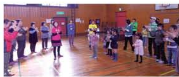
大人も子どもも、わっはっは! 「笑って元気! ハハハの会☆笑いの健康体操☆」へ、ぜひお越しください。