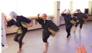
▲何とも場を和ませてくれた、どじょうすくい。▶発表会のトリは太鼓集団「鼓夢」による力強い演奏。市民交流センターよどがわでは、楽しいサークルや催しがいっぱい。ホームページでもチェックできますよ。 http://www.kashima-hra.com/(間) 6309-2255

3月2日、市民交流センターよどがわで「はるまつり」が開かれ、午前中はセンターで活動しているサークル発表会があり、キッズダンスやキッズコーラス、空手、フラダンス、銭太鼓、新舞踊、和太鼓など多彩な演目を見に、大勢のお客さんが押し寄せました。