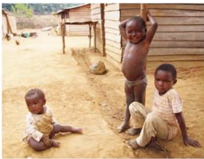
(右) アフリカの子供たち。笑顔がキラキラしていて、みんなたくましい!

れ助けられて今に至っています。ガボンでの生活も残り半年。感謝の気持ちを込めて、一日一日大切に、そしてガボンに住むみなさんのために、自分にできることを最後まで頑張っていきたいと思えます!