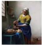
牛乳を注ぐ女 © Vermeer Center Ginza

◆開催中～6月2日(日) 10時～17時(金・土曜は20時まで) 第2・4水曜休館 神戸・ハーバーランドセンタービルB2(JR・神戸駅) 大人1,000円、小中高生500円 【問】078-335-6110 5組10名