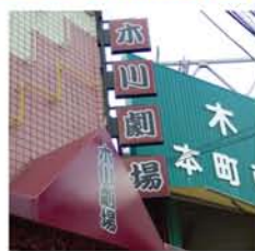
こけら落としに向けて内装工事は順調に進み、表には看板が掛けられ、幟も立ちました。

初代の「木川劇場」は1948年(昭和23年)に誕生し、以来約30年、大衆演劇の芝居小屋として親しまれてきました。その後、一時は十三ミュージックに姿を変えましたが、昨年11月に閉館。この4月から、再び「木川劇場」が復活することになりました。