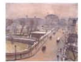
アルベール・マルク 《ボン・ヌフとサマリテヌ》 1935年頃 サントリーコレクション

◆5月1日(水)～13日(月) 10時～20時(最終日は18時まで) 会期中無休 大丸ミュージアム(梅田)(大丸梅田店15階) 一般900円、大高生700円 【問】06-6343-1231 10組20名