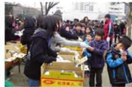
ジュニアリーダーが手渡します。「1歳の子どももほとんど1本食べましたよ」と参加したママ。

昔遊びやパフォーマンスで盛り上がったよ 「楽しい」「おいしい」野中の焼いも大会 2月17日、野中公園で毎年恒例の焼いも大会が行われ、小学生く大人600人が集合。(野中社会福祉協議会・野中連合振興町会・野中連合子供会主催)お芋が焼けるまでの間公園を掃除し、その後元気にけん玉・あやとりなどの昔遊びを楽しみました。