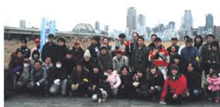
ボランティアスタッフ、区役所の職員さん、親子で参加の方や、横浜でゴミ拾い活動をしている方も応援に来てくれました。▶「海水と淡水が入り混じるこの辺りは、生き物の宝庫です」と河合先生(左)。しじみが持つ浄化の力も紹介されました(右)。

2月17日、淀川管内辻川河川レンジャ―と淀川区未来わがまちビジョン推進委員会の主催で「自然の宝庫淀川をみんなでおそうじ」が行われ、約60人が参加。まずは十三から西中