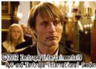
©2019 Zentropa Entertainments AB and Zentropa International Sweden

離婚し、妻子と離れて暮らす42歳の幼稚園教師ルーカス。親友の娘であり、園児のクララがついた小さな嘘から、彼は「子どもに性的ないたずらをした変質者」の烙印を押され孤立してしまう。無実を主張し、町中から向けられる憎悪と敵意に耐え続けるがー。