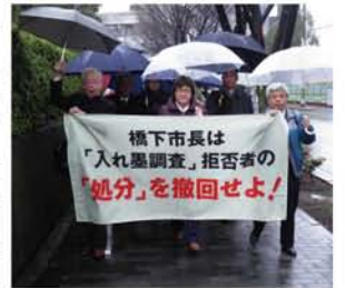
組の撤回も予定。右の役所所属の区長も提訴する。所属する区長も提訴する。所属する区長も提訴する。所属する区長も提訴する。

「私以外は皆、調査票を提出したわけですが、職場の人に聞くと『こんなん書かされて悔しい』とか、『本当は書きたくないけど母子家庭やから仕方なかった』という声もありました。中には『思想調査は拒否したけど入れ墨調査は提出してしまっって後悔してる』という