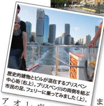
歴史的建物とビルが混在するブリスベン中心街(右上)。ブリスベン川の両側を結ぶ市民の足、フェリーに乗ってみました(上)。

ブリスベンはオーストラリア東海岸の街です。私が旅行した12月は、夏が始まったばかりの時期でした。