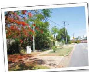
花と緑と広～い空！開放感あふれる住宅街。