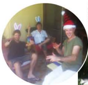
シエアハウスの皆さんと歓談したり、プールではしゃいだり。のんびりと過ごしました。耳の青いうさぎが僕!