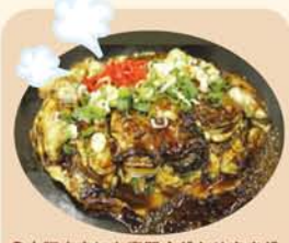
●大阪市内にも専門店がありますが、ご家庭で大粒のプリプリのカキをたっぷり載せて「自家製カキオコ」を。

牡蠣入りのお好み焼き「カ キオコ」をご存知ですか? 昨年末、朝日新聞夕刊「B 級ご当地ぐるめぐり」でも、 思わず涎が出そうな写真付き で紹介されました。 冬の味覚といえは牡蠣。「別 名「海のミルク」といわれる ように、エネルギー源となる グリコゲン、うまみのもと グルタミン酸などのアミノ 酸、肝臓などの働きを助ける