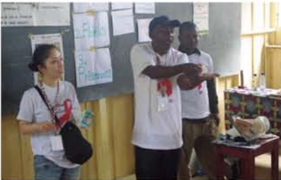
(上) 高校でHIV感染予防の啓発活動を現地のガボン人スタッフと一緒にしています。

争をしておらず、人々のはのんびり、文化や、国籍・宗教の壁を越え、毎日陽気に暮らしています。お母さんと赤ちゃんに囲まれて過ごすようになって、もう一年半。病院の手術室でたくさん器械に囲まれて忙しく働いていたわたしは、赴任当初、時間の流れも何もかも違う。この生活に戸惑うばかりでしたが、今はもうすっかり慣れ、虫にもねずみにもゾウにも!?驚かなくなり、ガボン人と笑いながらアフリカの生活を楽しめるようになりました。普段は母子保健センターでマンパワールとして業務をしながら、時折地元の中や高校に出向いてHIV感染予防啓発や性教育の授業を行って