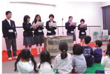
宮原中学校の「みやはらりっきー」は、自作の歌も交えて会場を楽しませてくれました。なぜ、読み語りをしたいと思ったの? 「小さな子に読んであげるのが楽しそうだと思って」「本が好きです」「見てくれる人を喜ばせるために、裏方で支えている感じがしてやりがいがあると思ったから」と皆さんしゃり者! 「またこんな機会があればやりたいです!」