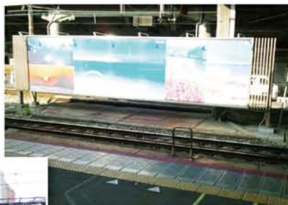
看板の下の赤い部分が、中島水道に架かっていた鉄橋の名残り。

「横関街道」は、JR新大阪駅で東海道線と平行して、暗い高架の下で中島水道と突き当たりです。「中島水道」の面影はほとんどありません。でもホームの方を覗き見ると鉄橋跡らしきところがある。「何かの気配を感じる」、これは見慣れた地元ならではの醍醐味です。