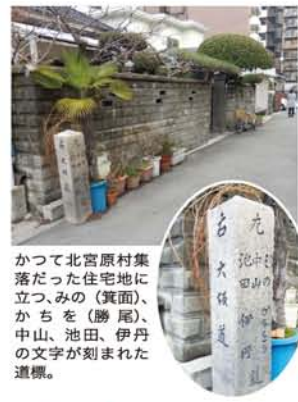
かつて北宮原村集落だった住宅地に立つ、みの(真面)、かちを(勝尾)、中山、池田、伊丹の文字が刻まれた道標。

「横関踏切」(明記されています)があり、少し歩くと明治4年と書かれた道標が、ポツンとあります。150年近くこんな住宅地に、ようも残っていたと感心します。