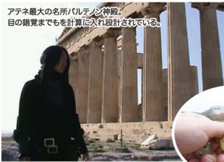
アテネ最大の名所パルテノン神殿。目の錯覚までもを計算に入れ設計されている。