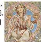
「スラヴィア銀行」(部分) 1907年 リトグラフ

◆3月1日(金)～31日(日) 10時～20時 会期中無休 美術館「えき」KYOTO(JR・京都駅、JR京都伊勢丹7階隣接) 一般900円、高大生700円、小中生500円 【問】075-352-1111 5組10名