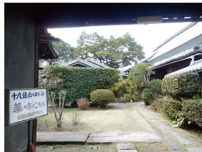
女性の産前産後に効き目がある妙薬として知られる「十八条血の道葉」は、1560年に24代目が調剤を始めた。武家屋敷のような門構えの邸宅は280年以上前のもの。

ここまで来ると、あとはゴールの「榎木の渡し跡」です。榎木橋を渡って、なおも15分歩き続ける「吹田街道」と合流して、中世から栄えたという「蔵人村」の綺麗な白壁の町並みを観ることができま