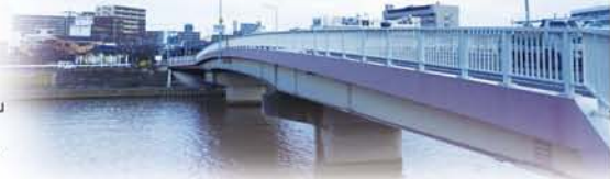
櫻の渡し跡に架かる「櫻木橋」 対岸は吹田市江の木町。 “えのき、の字が違いますね。

区内の歴史を語る時、どうしても西部が中心になります。「中国街道」は十三筋、「能勢街道」は国道176号線に姿を変えて、完全には一致しませんが、つかず離れず平行して現在に残っています。そのため明治以前の街道跡も、そこそこ確認できるのです。では東部はどうでしょうか？こちらは新御堂筋と新大阪駅という、新規参入交通施設のために、大きく変わってしまいました。しかししかし…。