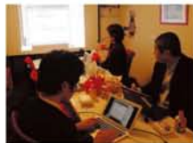
筆さんは理工学部の学生。度々情報交換しに来てくれます。

●新大阪コーキング主宰。コーキングとは、場所を共有しながら独立した仕事を行う共同ワークスタイルのこと。単に同じ場所で働くのではなく、お互いに交流することで新しい仕事を生み出しており、今世界中で注目されています。 「ワールド・ワイド・ジェリー・ウィーク(以下WWW)」をご存知ですか? 「みんなが集まってパーティするよ」に仕事しよう」という世界規模のイベントで、昨年は34カ国223カ所で開催、今年は1月14日〜20日に、44カ国255カ所で開催されました。 新大阪コーキングでも15・16・18日の3日間、テーブルセッションを行います。