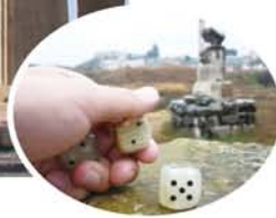
古代世界七不思議の一つにも数えられているエフェソスのアルテミス神殿。崩れた跡地となっており当時の原型は無い。