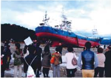
津波で陸地上がった大型巻き網船「共徳丸」。今も訪れる人が絶えません。現地では、震災メモメントとして保存するのか、解体して撤去するのか、行政と地元住民の話合いが行われています。

浸水区域は未だに2年前と変わりません。事業所・工場、家屋の基礎撤去が完了せず、新しいまちづくりの設計図さえ見えてこないのです。もう政治には期待できない。我慢も限界。諦めのムードが最も怖いのです。行政発信の情報が極端に少なく、肝心の復興会議などが非公開という情けなさ。進んでいること、関係法の絡みで壁にぶつかっていること、不利な情報でもほとんど公開す