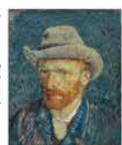
5組10名 『グレーのフェルト帽の自画像』 Vincent van Gogh (1853 - 1890), Self-portrait with grey felt hat, 1887-09 Paris, oil on cotton, 44.5×37.2cm, Van Gogh Museum, Amsterdam (Vincent van Gogh Foundation) s16V/1962, F344

◆4月2日(火)～5月19日(日) 9時～17時 月曜休館(4/29、5/6は開館) 京都市美術館(岡崎公園内) 一般1,400円、高大生1,000円、小中生500円 【問】06-4950-7555