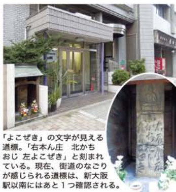
「よこぜき」の文字が見える道標。「右本ん庄 北かち おじ 左よこぜき」と刻まれている。現在、街道の名前が感じられる道標は、新大阪駅以南にはあと1つ確認される。

明治末に新淀川に開削される前の中津川（旧淀川）には、幾つかの渡しがありました。このうち「横関の渡し」と「本庄の渡し」から北上した旅人は、東淀川区東中島1丁目にある徳蔵寺の北辺りで「横関街道」に合流します。しかし新大阪駅以南には、道標が二つ確認されているだけで、街道の跡形はありません。他にもきつと何かあるはずなんですが…。