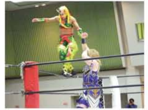
小柄な体も個性にし、投げられてもくると回転して逆に相手に飛びつき技に入ったりと、とてもカッコイイ戦いを見せてくれたコマンドポリショイさん。8月4日にも再び、区民センターで大会が行われるそうです。みんなで応援しませんか？

さんの周りには大勢の友人や先輩、後輩がいて、大阪で大会があるときは“追っかけ”をしている方も多そう。