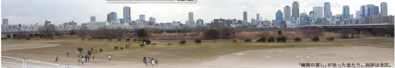
「横関の渡し」があったあたり。対岸は北区。