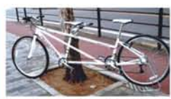
フレンドクラフアン

タンDEM自転車は、1台で前後に二人が乗る自転車です。前の人(パイロット)がハンドルを操縦して、二人でペダルを踏んで走ります。公道で乗車可能の県と禁止の県があり、兵庫県では乗車できませんが大阪府下では現在乗車できません。ただし、河川敷や公園、敷地内などではOKです。彼女と二人で、障害を持つ方と共に、また老夫婦で河川敷を走る楽しみもできます。