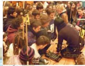
▲日本文化に興味津々のギリシャの若者、「sugoi」「ichiban!」など、日本の単語も知っていた。

く、大きなリアクションと手応えが得られた。「興味があれば吹いてみて下さい」と体験用の尺八を取り出した時、彼らの楽器への集まりようは日本では見られないような光景であったし、中には簡単な日本語さえ話せる