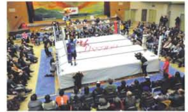
会場は大入。普段の雰囲気とは別世界？

今回の経緯を伺うと、「キャリアも20年を超えてこれからどんなプロレスがしたいかを考えたとき、偶然会場が十三になって、もしも今、児童養護施設で将来が見えずに生活している子がいるとすれば、その光になりたいと思いました。いつも自分を思ってくれて、面倒を見てくれる人がいること、自分もそのおかげで今リングに立っていることを知ってほしかったんです」と話してくれました。これからの活躍も、応援しています！