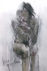
堀口博徳「見つめる」43x34cm

高校の同窓生が第3回のコラボレーションを地元で開催します。円熟味を増した二人が個性豊かに描いた新作を展覽します。是非、ご来場、ご高覧下さいますようご案内申し上げます。