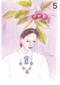
▲西村裕子「チェリー」26x18cm

5月31日(木)~6月12日(火) 11時~18時 6日休廊 (最終日~15時)