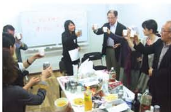
多文化共生におけるいろんな課題を分かち合い、楽しみを生み出せる場にしていきましょう。乾杯!

「うちの子」と発見してくださった親御さん、お電話ください。花月堂さんのお菓子券と粗品を贈ります。