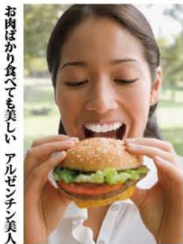
お肉ばかり食べても美しいアルゼンチン美人

3ヶ月で諦めた方必見! 無理なく健康ダイエット。 ダイエットを 飲むサラダ 有機マテ茶