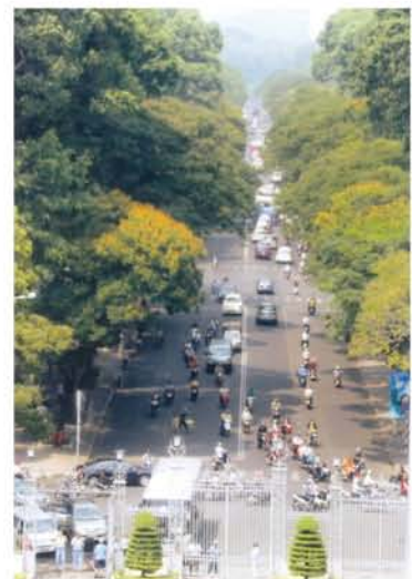
ホーチミン市内の統一会堂(もとベトナム共和国大統領府)につながる道。戦争終結時に、解放戦線が通ったという。