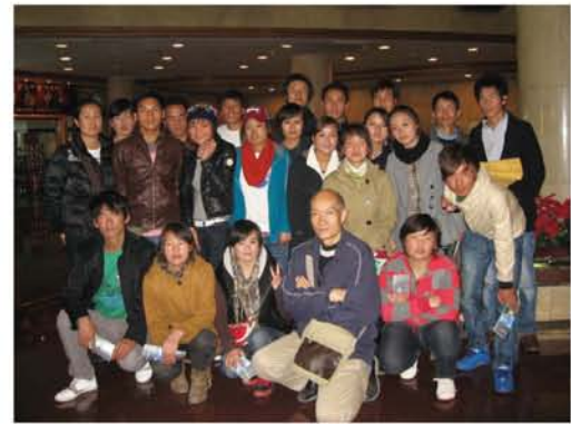
学生と一緒にホテル見学

ここで少し青海省の紹介をいたします。青海省の面積は721,000平方キロで省としては一番広く、日本のほぼ2倍ですが人口は550万人余りで兵庫県の人口とほぼ同じ。面積の割に人口が少ないのは圧倒的に山、河川、湖、草原、高原が多いせいです。省内には海拔3千メートルを超える地域が多くあります。省内には中国最大の塩水湖・青海湖があり、省の名前もこの湖に因ん