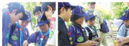
ビーバー隊は缶切りにもトライ。「家で手伝っているから」とスイスイうまい子も。みんな連者です！

加盟する8団がそれぞれビーバー隊(年長)、カプラー隊(小2の9月～小5)に分かれ、淀川区内の5つの公園を回って、ケンパやろう石、ラムネの瓶開けなどに挑戦。成功すれば、昼食のサンドイッチの食材がもらえるルール。「とにかく、ぜったいにパンはゲツトせな！」と各隊、気合い