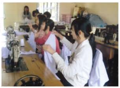
150人の子どものうち、3分の1が聴覚障害児。見学時には職業訓練実習をしていた。ミシンや彫り物、刺繍を学んでいる。