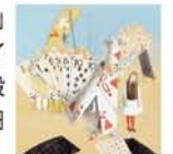
「不思議の国のアリス」Alice in Wonderland ©1999 Lisbeth Zwerger/minidition rights & licensing ag, Switzerland.

◆開催中～6月17日(日) 10時～20時(最終日は17時まで) 会期中無休 美術館「えき」KYOTO(JR・京都駅すぐ ジェイアール京都伊勢丹7階隣接) 一般700円、高大生500円、小中生300円 【問】075-352-1111