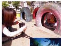
快晴の御幣島公園で撮影会。