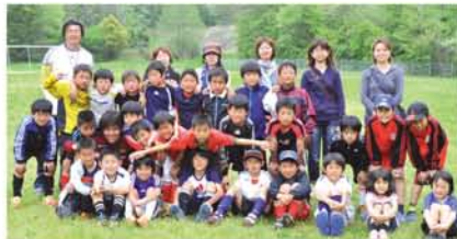
小学1年生～6年生クラス、総勢80名が所属するボランティアチームです。主に土・日に元気イッパイ練習しています。(ホームページ:《塚本ウイングス》で検索下さい)

塚本の河川敷を中心 に活動し、18年の実績 を持つ少年 サッカーチ ーム「塚本 ウイング ス」が、4 月29日～30 日、恒例の