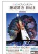
「影絵のファンタジー—藤城清治 影絵展」

◆開催中～6月24日(日) 9時～17時(金・土曜は19時まで) 月曜休館 奈良県立美術館(近鉄・奈良駅) 一般1,200円、高大生1,000円、中小生500円 【問】0742-23-3968 5組10名