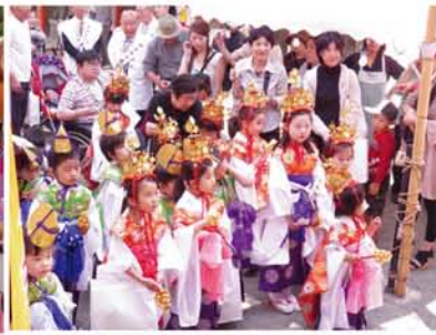
神津・田川・堀上南1(三津屋)、十三東、野中・新高、木川、木川南の順でお宮入り。