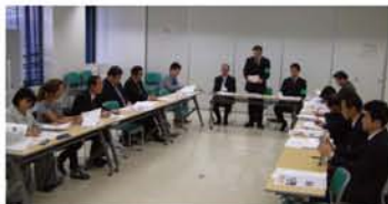
「生徒のトラブルなどで学校と警察は連携がある。それを活かしていけたら」「もっとFAXが読みやすいと思う」学校現場からも活発な意見が。

区内で起こった傷害事件の後の「小中学校だけでなく幼稚園・保育園にも不審者情報を」という希望から、昨年5月に淀川区役所と警察との協力で発足したスクールネットワーク。これにより、緊急を要する事件が起こった場合には、警察から加盟校59校にいち早く事件を告げるメールと、FAXが届くシステムが整いました。