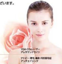
YGA-CO2レーザー アレキサンドライト フォトビー-青も、黒も、赤も、黄も、肌質改善 アンチエイジング