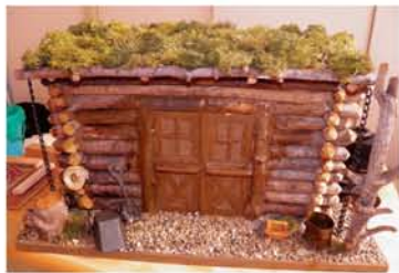
▲買った部品は土台、上部の縁、チェーンのみ。公園で拾った木材と石を用い、ドラム缶は部屋を掃除する「コロコロ」の芯、シャベルはアイスのスプーン、手押し車は洗剤用スプーンを使用しました。