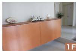
1F 特殊なスライド金物を使って、2枚の扉を引き違いにしています。