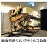
肉食恐竜タルボサウルス全身骨格(複製)

◆開催中～6月30日(土) 10時30分～17時 日曜祝日休 大阪大学総合学術博物館 待兼山修学館(阪急・石橋駅) 入館無料 【問】06-6850-6284