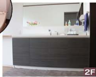
2F 2階の洗面はカウンターとシンク、蛇口以外は、コストを重視してすべてオーダーメイドにしました。