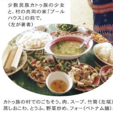
カトゥ族の村でのごちそう。肉、スープ、竹筒(左端)の中の蒸しおこわ、とうふ、野菜炒め、フォー(ベトナム麺)など。

が、感動の一日であった。緑濃い敷地内には小学生から高校生まで約150人の子どもが縦割りグループで暮らしている。ふえみんは、希望の村卒業後の職業訓練や大学進学を援助する自立支援プロジェクトも始めており、息の長い支援に感心しつつは