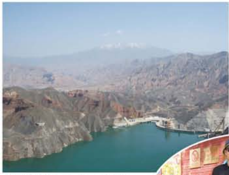
▲西寧市郊外のカンブラー森林公園 チベット僧院にて▶

私は西寧市の東、回族が多く住む地区にある青海民族大学で、2010年7月からJICAのシニア海外ボランティアとして、観光日本語と作文などを教えています。