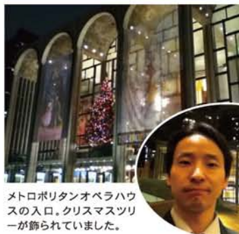
メトロポリタンオペラハウスの入口。クリスマスツリーが飾られていました。

行きました。また、すぐ近くのセント・ポール教会にも足を運びました。この教会は9・11の時に救助隊の拠点になった場所の一つでもあります。今は当時の様子を克明に記録した写真や、当時使用していたベッドなどがそのまま置いてありました。あまりに生々しく、カメラを向けられませんでした。