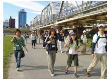
元気いっぱいスタート！（写真は去年の様子）

西中島く敷方大橋間の遊歩道を往復で歩く淀川ナイトウォーク。 6月9日（土）、あなたも仲間や家族と一晩の冒険に出かけませんか？ 「一度完歩しても、何度でも挑戦しなくなるのが魅力。初心者・