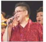
大上留利子さんの厚意でライブが実現！

毎回、本格的なステージが好評の「十三市民病院ローコンサート」。5月31日は、「日本のロック&ソウルは彼女なしでは語れない」と評されるシンガー、大上留利子さんのライブステージが楽しめます。