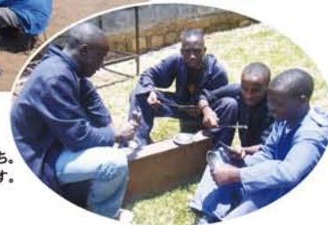
実習中の生徒たち。灰皿を製作中です。

は金属加工科に配属され、金属加工全般に関わる理論の講義および実習指導を行っている。外部から委託された製品を科内で製作・販売することで学校運営費の一部としていることがこの科の特徴である。ここケニアでは、防犯上、鉄製ドアや鉄格子付の窓などの需要が高く、町のいたるところでこれらを製作している工房を見かける。私の所属科もひとつの工房として機能しており、職人を雇って製品をつくったり、実習の一環として生徒に担当させたりしている。