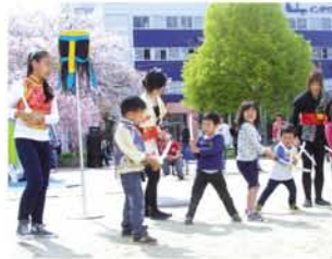
アーツ☆エンターテインメント学院さんは子どもたちに、殺陣を手ほどき。