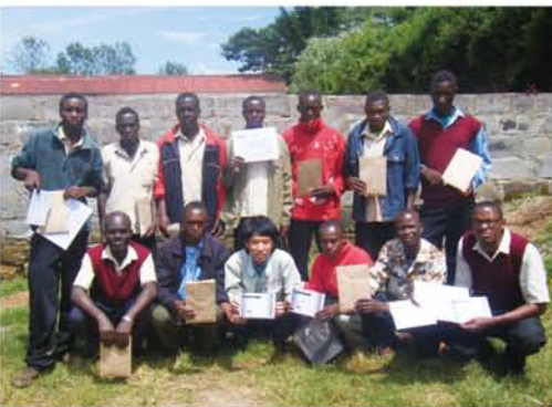
金属加工科の生徒たち(2011年11月卒業、表彰状や記念品を手に)

ケニアでは、全労働人口に占めるこのインフォーマルセクターの割合が75%とも言われている。この現状を変えることは難しいかもしれないが、少なくとも職業訓練校として十分な技術を提供すること、将来設計に対して選択肢を増やせるようにすることが必要である。また、彼らが描く理想に近づけるよう進路指導、カリキュラムの改善、国家資格取得数の増加にも取り組んでいる。生徒たちが、よりよい未来をつかめることを願いながら…。