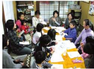
写真は、今年の「おやこまつり」に出店する子どもたちによる「店長会議」。どんなお店が出るのかな？ 12頁に詳細。

★9時45分～16時30分。(問)淀川区社会福祉協議会 TEL: 6394-2900 FAX: 6394-2978