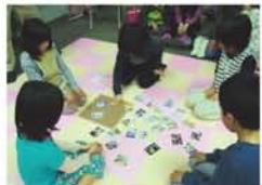
▲多世代が楽しめるかるた。子どもたちも頭をぶつけて必死でした。▶5人の作家さんによるカラフルなデザイン。

川区内の史跡、名所、伝承などを詠んだ『淀川区わがまち百景いろはかるた』が4年8カ月の制作期間を経て完成。3月25日、淀