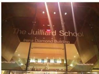
音楽家ならだれもが憧れるジュリアード音楽院。数々のスターを生み出している名門です。

演奏のおかげでついウトウトとしてしまう場面もありました。本場のオペラを直接体験することは、今回の目的の一つでもあるので眼と耳に神経を集中して観ました。