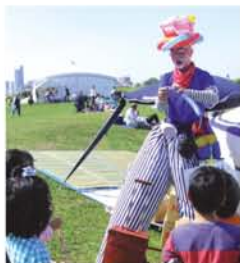
うさぎ？アンパンマン？お気に入りのバルーンを作ってもらおう！