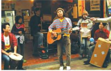
皆さんも、ご自宅から音が鳴るものを持ってきて、一緒に演奏しましょう！

ダンボールのドラム？こみ箱ベース？洗濯板でも演奏するの？音が鳴るものなら何でも楽器にしてみよう 「ザ・ランチタイム」の旅立ちライブが5月11日、みつや交流亭で開かれます。