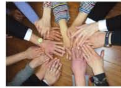
「解散」を覚悟したお別れ会の日も、「新たなスタートがされるようがんばろう」と前向きだった皆さん。再出発、おめでとうございます！