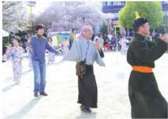
みんなで炭釜節。モンゴルから来た留学生も「教えてください」と興味津々で輪の中に。