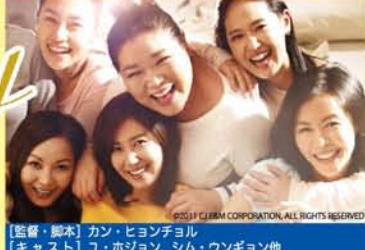
【監督・脚本】カン・ヒョンチョル 【キャスト】ユ・ホジョン、シム・ウンギョン他

5月21日(月) 18時開場/18時半開映 場所: 朝日生命ホール (御堂筋線淀屋橋駅12番出口すぐ)