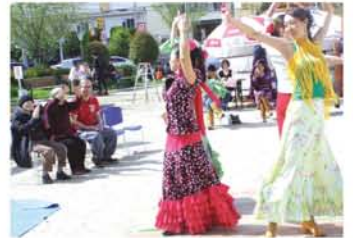
「Ama.連（たまれん）」の情熱的なフラメンコにつられて、踊り出す方も♪

日本で桜が満開になる頃、モンゴル帝国を築いたチンギス・ハーンは誕生したそうです。「誕生を記念して、日本で文化交流イベントを開きたい」という「モンゴル青旗協会」の呼びかけに大阪市コミュニティ協会や国際交流NPO法人もみじが応え、「日本・モンゴル文化交流」は、7年前に都島区・桜ノ宮公園子ども広場で開催。今年初めて会場を野中南公園に移し、450人が来場、大盛況でした。