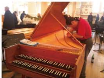
偶然出会ったチェンバロの調律。見た目はピアノ(鍵盤の白黒は反対)のようですが、音を鳴らす仕組みが違うことがよくわかりました。

昨年の年末から新年にかけて、NY(ニューヨーク)とラスベガスへ旅行しました。主な目的は休養とショッピング。と言っても、妻が主宰している音楽教室で利用したい楽譜などの教材購入が目当てです。