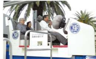
シートベルトコンビンサーに乗って疑似体験。最近では、急ブレーキをかけた時に後部座席からの車外放出が増えているとのこと。

春の交通安全週間に合わせ、4月15日、塚本自動車教習所で高齢者向け一日教室が開かれました。