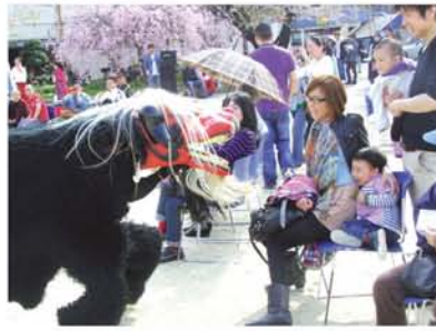
NPO法人「夢乱舞（むらんぶ）」による獅子舞芸。逃げる子どもと、喜ぶ大人。よさこい踊りも好評でした。