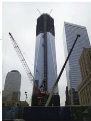
グラウンドゼロには、新しい建物が建設中。周囲は工事用の仮囲いで囲われていて、残念ながら中の様子はわかりませんでした。