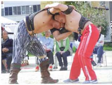
土俵がないモンゴルの相撲は、どちらかが倒れるまで終わりません。その集中力と迫力、見物人にも緊張感が、