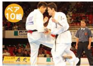
6席自由席 前売券4,000円 当日券6,000円

NPO法人全世界空手道連盟新極真会主催、第29回全日本ウエイト制空手道選手権大会が5月26日(土)と27日(日)、府立体育会館(地下鉄なんば駅5分)で行われます。6階級210選手が直接打撃制で争う本大会は、第5回カラテワールドカップの選抜戦でもあります。