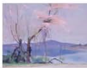
《一番桜》1954年 兵庫県立美術館蔵

◆開催中～5月20日(日) 10時～18時(金・土曜は20時まで) 月曜休館(4/30は開館、5/1は休館) 兵庫県立美術館(阪神・岩屋駅) 一般1,200円、大学生900円、高校生・65歳以上600円 【問】078-262-0901