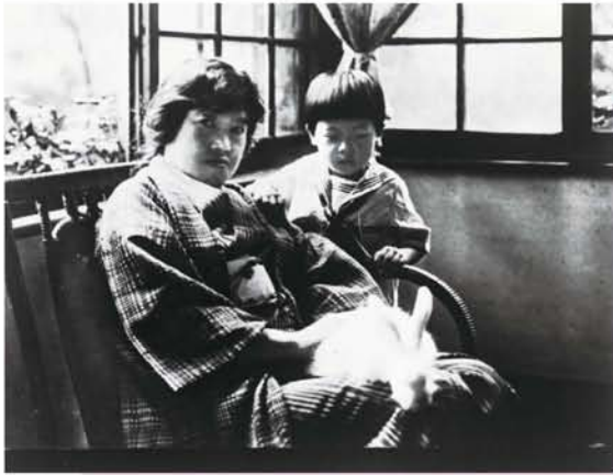
「晶子 初孫と」(鞍馬寺蔵) 昭和5年 昭和2年から亡くなるまでを過ごした 東京・荻窪の家のサンルームで。

資料提供：堺市立文化館 与謝野晶子文芸館 大阪府堺市堺区田出井町1の2の200ベルマージュ堺式番館 ☎072-222-5533 JR阪和線「堺市」駅から徒歩約3分