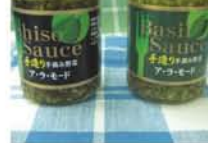
1本1,080円 ※賞味期限は製造日より約2カ月

無農薬の有機土壌で栽培、手摘みされたバジルとしそソースに変身。香りが良いバジルソースはエクストラバージンオリーブオイルと国産ニンニク、天然塩などを配合。風味爽やかなしそソースは、銚子になるまで炒めた国産玉ねぎがコクと深みを出しています。