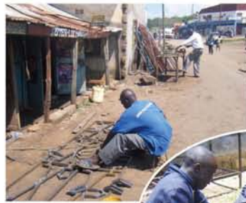
◀町中でよく見かける工房。防犯用鉄製ゲート製作中。

走ることもある。ケニア国内では毎週末どこかでマラソンやクロスカントリーのレースが開催され、賞金を目当てに各地から集まってくる。彼らにとつて走ることは趣味ではなく、お金を稼ぐひとつの手段なのだ。さて、私の赴任校は、政府管轄の2年制の全寮制学校で、男女あわせて約250名の生徒が在籍している。大半が中学校卒業程度の学力で、平均年齢は20歳前後。自動車科、木工科、家政科、美容科など10の専門コースが設置されており、その中で私