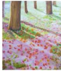
またこんな、素敵なお作品が生まれるのが楽しみです。