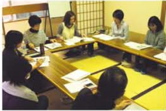
学校選択制の学習会。この後、みんなでお花見へ！「発言する保護者ネット」は、大阪発の「教育基本条例案」に疑問や危機感を感じている保護者たちのネットワークです。