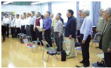
コンサートに向け、テンションが高まっている様子。表現豊かな「昴」の歌声を聞きにいきませんか？

2000年に結成。2002年から、大阪府9地域の予選府全体の予選を勝ち抜き、10年連続で「日本のうたごえ祭典」に出場し、上位をキープ。実