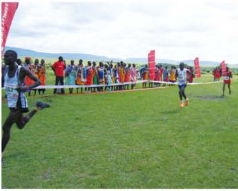
マサイマラで開催されたマラソン大会(マサイ族の応援をバックに)

私はマラソンが趣味で早朝に町中を走ることがあるが、長距離走が早いことで有名なだけに多くのランナーに出くわし、時にはいっしょに