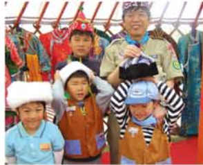
ボーイスカウト大阪9団の子たちも遊びに来てくれ、モンゴルの帽子を試着。