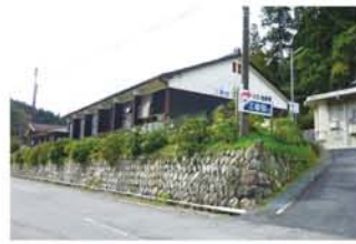
三季館 ☎0745-95-3243 (開館期間 5/1-10/31 火曜日定休)