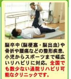
脳卒中(脳梗塞・脳出血)や骨折や腰痛などの整形外科疾患、小児からスポーツまで幅広いリハビリに対応。全国でも数少ない通院リハビリ可能なクリニックです。

★各種保険・交通事故・労災・生活保護指定★ http://www.tatsue-clinic.com