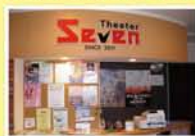
シアターセブン 十三本町1-7-27 サンボードシティ5F