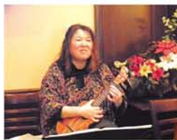
「私はアップテンポな曲が好き!」 「じゃ、『第三の男』弾こうか。」「 日本の曲やビートルズなど幅広い 曲を披露しました。」

に見ていた子も、老人クラブの皆さ んの手ほどきで火がつくと、「あ ったかい!」「葉っぱ入れてみ ていい?」など興奮気味。餅が 配られると、「どうなるか見と こ」「おくいにおい」「膨ら だ!」「こげた!」と大はしゃぎ