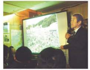
までい(ものごとを大切に、丁寧に)の精神で村づくりを進め、「日本で最も美しい村」に認定された飯館村。震災による被害はそれほど受けなかったが、現在は放射能からの避難生活を余儀なくされている。

「事故後の風向きで、飯館村は原発から遠いけれど、放射能の数値が高かった。それは当時から明らかだったが、国や県は隠し、御用学者は『大丈夫です』と繰り返した。村民はその言葉を信じて普通の生活を続け、その間に被曝が進んだ。かわいそうなのは子どもたちだ。これから起きるかもしれない、いやすでに起きている差別にも立ち向かわなければならぬ。震災によって浮かび上がった問題を絶対に風化させないでほしい」。