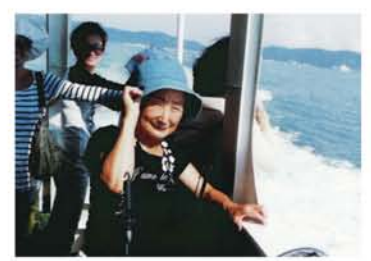
沖ノ島へ向かう舟の上で、潮風に吹かれる「昔の乙女」?。乗船時間20分ほどの短い船旅でしたが、白波と爽やかな風に、旅のムードが盛り上がりました。

「友ヶ島の『ケ』をなぜ『が』と読むのですか?」という質問でした。すぐには答えられず、ずくつと気になっていましたが、2学期になって現役の前先生が調べて下さり、学習者さんに回答すると納得し、喜んでくれました。