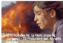
©2010 Incondes inc. (a micro scope inc. company) - TS Productions s.r.l. All Rights reserved

男女の双子、シモンとジャンヌの母は、プールで原因不明の放心状態になり、まもなくこの世を去った。ジャンヌは母の遺言に従い、会ったことのない父と兄に母の手紙を渡すため、母の故郷の中東へ。旅をするうちに母の数奇な運命と恐ろしい秘密を知った双子は一。