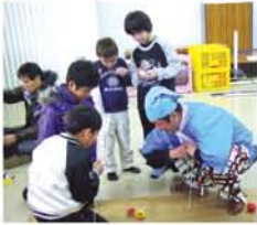
こまにハマる「少年たち」。

劇団ぬくぬく座のパン トマイムや人形劇、てん てこまい座の紙芝居に、 わごむ鉄砲、こま回し、 けんだま：毎年お楽しみ がてんこもりの野中名物