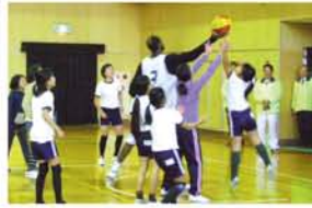
小学生も体当たりプレイ。「早すぎてついていかれへん。でもめちゃくちゃ楽しかった！やめられない、とまらないって感じ！」

大阪北ライオンズクラブ結成 50 周年、次の 50 年に向けて青少年育成事業に力 新北野中で、プロによるバスケットボール講習会