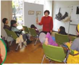
子どもも身を乗り出して聞き入りました。

「お話の語り部にとっては、東北の民話はその奥の深いもの。息長く、地震の被害を受けた東北を応援したい」。区内でも活躍するなにわ語り部の会が「応援しよう！」と題したお話を4月