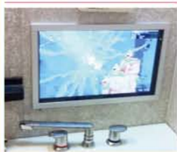
アルミフレームタイプ