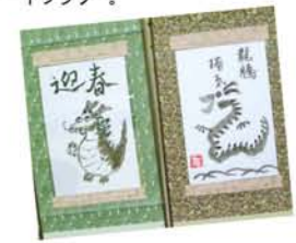
▼塚本のペン習字。▶加島のブリザードフラワー。