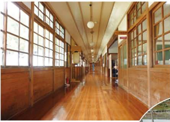
みつえ体験交流館 ☎0745-95-3737 (毎週火曜日休館) (写真上下とも)