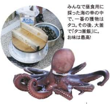
みんなで昼食用に探った海の幸の中で、一番の獲物はタコ。その後、大釜で「タコ釜飯」に。お味は最高!

人形」も安置されていました。その後は、磯遊び。貝を採ってみそ汁のダシにし、大釜でお米を炊き、お昼ごはんにするという計画。早速みんなで海辺の岩場でマツバ貝、ヨメガサ貝、カメノテなどの貝を採取。先生が採ったタコを「タコ飯」にし、「麩入りの貝ダシみそ汁」と朝市で買った「鱈の開き」に舌鼓。 ただ、残念だったのは、私が「大釜」でご飯を炊くのに不慣れで、半煮えになってしまったこと。でも、みんな「これも思い出、思い出」と言ってくれました。食後はホテルで入浴し、一路、大阪加島の地へ。 一泊研修を通じて沢山の方々とお話し、学びと交流の2日間を過ごすことができました。皆さん、ありがとうございました。