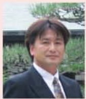
はくあい介護サポートセンター 所長