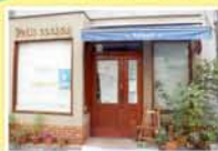
ルトゥール 西中島2-10-18

※ルトゥールとE.M.SHOP自然紀行の店は淀川区内の有権者のみ、シアターセブンと第七藝術劇場は大阪市内すべての区の有権者が署名できます。署名をご希望の方はお急ぎください。