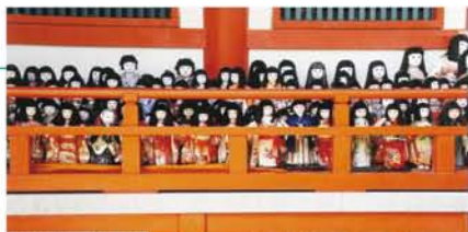
市松人形に花嫁人形、お雛様…奉納されている人形は2万5千体以上と。淡嶋神社は住吉神の妃神で、婦人病の快癒、安産、子授けを祈願します。2月に行われる針供養も有名。ニャ、ニャンと、招き猫の一群もいました。いろんな表情があって楽しい。

奉納されたお雛様、市松人形、羽子板、鬼瓦、陶器のカエルや招き猫などが所狭しと並べられていて庄巻! 髪の毛が伸びることで話題を集めた「お菊