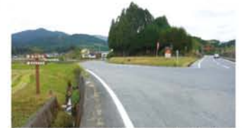
右が御杖村を貫く国道369号。左をたどれば旧伊勢本街道と姫石明神。