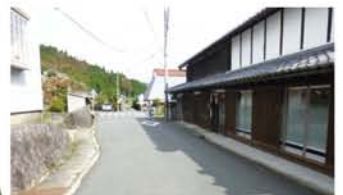
旧伊勢本街道の面影を残す通り。