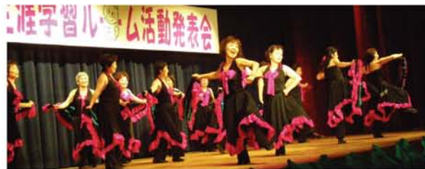
田川のジャズダンス。 「今年で11年目の舞台。平均年齢は上がりましたが、初回よりもますます若々しく、和気あいあいと練習してきました。年齢制限はなし!です」