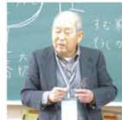
◀6班に分かれて和気あ いあい。▲七輪体験 のあと、教室で「昔の 衣食住」の題でお話も。