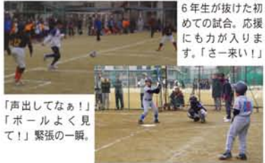
6年生が抜けた初めての試合。応援にも力が入ります。「さー来い!」「声出してなあ!」「ボールよく見えて!」緊張の一瞬。

「初めの試合は緊張してたけど、2試合目からは大丈夫!でもあんまり声が出せなかった」「試合は楽しかったけど、難しかったわ!」 十三中学校下の小学校5校(木川、木川南、十三、西中島、野中)に新高と宮原を加えた7連合子