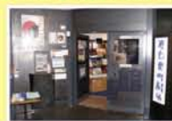
第七藝術劇場 十三本町1-7-27 サンボードシティ6F