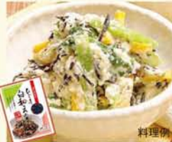
「ひじき白和えの素」のひじきは半生タイプですから戻す手間もかかりません。

みなさん、「今年こそは！」 と決意・希望・期待をもって 新しい年をお迎えのことと思 います。明るい未来を展望で きる新生日本を築くために、 まず健康で、人権文化あふれ る、まちづくりからスター トしたいと願っています。