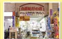
E.M.SHOP自然紀行の店 十三元今里2-7-17 もといまロード内