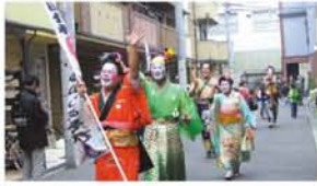
「野中時代村、はじまるよ〜」村のアイドル「てんでこまい座」が地域を歩いて宣伝。子どもがついてきました。

劇団ぬくぬく座のパン トマイムや人形劇、てん てこまい座の紙芝居に、 わごむ鉄砲、こま回し、 けんだま：毎年お楽しみ がてんこもりの野中名物