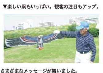
▼楽しい風もいっぱい。観客の注目もアップ。