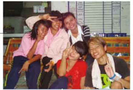
Last Night Party 終了後。いやあーハレムー!?