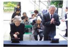
毎年お見かけする93歳の方も。「元気でられるのは、守られているからのような気がします。来年も来ます」

の真教寺で「戦没者追弔会大法要」が営まれました（淀川区遺族会）。「遠く異国の地で命を遂げた亡き同胞を偲びつつ、今年も8月15日を迎えました。幾多の苦難を乗り越えて今の繁栄があり、平和を享受できるのは、1人ひとりの努力の賜でもあります。が、