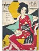
竹久夢二《セノオ楽譜no.44「園遊」 京都国立近代美術館蔵

◆11月11日(金)～12月25日(日) 9時30分～17時 月曜休館 京都国立近代美術館(岡崎公園内) 一般1,200円、大学生800円、高校生400円【問】075-761-4111