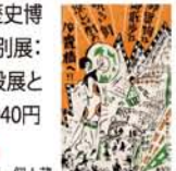
マツチラベル 昭和初期 個人蔵

◆10月15日(土)～12月4日(日) 9時30分～17時(金曜は20時まで) 火曜休 大阪歴史博物館(地下鉄・谷町4丁目駅) 特別展: 大人800円、大高生600円 常設展との共通券: 大人1,320円、大高生940円【問】06-6946-5728 5組10名