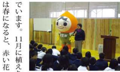
●小学校での「人権の花運動」の様子 の中でも私は、「子ども人権委員」として、毎年1小学校で「人権の花運動」に取り組んでいきます。11月に植えたチューリップは春になると、赤い花・白い花・時に