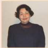
大阪第1人権擁護委員 大阪市人権啓発推進員 淀川区生涯学習推進委員会委員長

と、無責任・無関心が事件を引き起こす要因で、どこにでも誰にでも起きる可能性があり、日常的に起きているような気がしてなりません。トントン となり組 隣人を思いやり、助け合おう心 先般、社協主催の敬老会のお祝いの中で、閉会の挨拶で、「トントン」となりの隣組 回してちょうだい回覧板 助けられたり 助けたり。」と地域の絆について歌とともに挨拶をされました。「知っている！」何人かが「小さい時に歌ったわあ〜」「聞いたことがあるわあ〜」と口ずさみました。何の変哲もない回覧板の歌でしたが、今忘れられている人を気遣い隣人を思いやる、「心の絆」であり、この歌こそ、先人の知恵として培った助け合いの心を持つこ