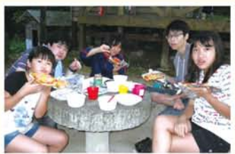
生地から作ったピザ。どんな材料がどのくらいいるのか、事前にみんなで考えるのも楽しかった。

少し無理のあるメニューでもやつてのけるのがこのキャンプの面白いところで、肉まんを作ったことでもありますし、今年にはピザを生地から作っている班もありました。キャン