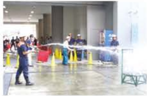
2人一組で消火栓の箱を開け、1人がホースを伸ばし、狙いを定めたら「放水はじめ!!」。水で大小3つの的を落とす屋内消火栓操法。

企業内で火事が起こったときのための訓練を競技化し、その正確さとタイムを競う淀川自衛消防技術発表会が、9月22日、淀川消防署で行われ、区内の29の企業から46隊95人が出場し