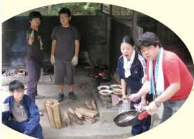
調理する人、火をおこす人、中高青が子どもの側でおえます。

私が初めて高学年キャンプに参加したのは、4歳のときでした。見守り役として参加する母に付いて行くことになったのです。自分の着替えなどが詰められた重たいリュックを背負い、大人でもしんどい山道を半べそかきながら登りました。みんなに励まされながらやつとの思いでキャンプ場に着いたときの、なんとも言えない達成感は今でも覚えています。この「達成感」を今の子どもたちにもつと感じてほしいと思います。欲しいものは手に入り、楽で便利な世の中になつた代わりに、子どもたちが工夫を