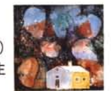
駒井哲郎《題名不詳》1971年頃 ©Yoshiko Komai 2010/JAA1000185

◆【第I部】10月29日(土)～11月20日(日) 【第II部】11月23日(水祝)～12月18日(日) 10時～18時 月曜・11/22休館 伊丹市立美術館(阪急/JR・伊丹駅) 一般700円、大高生350円、小中生100円【問】072-772-7447