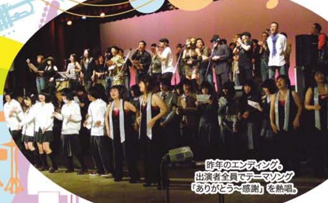
昨年のエンディング、出演者全員でテーマソング「ありがとう〜感謝」を熱唱。

主催：財団法人大阪市コミュニティ協会淀川支部協議会 協力：大阪ひと・まち魅力発見事業推進会議/地域から元気! 地域コミュニティパワーアップ事業 運営：BBOOOAA