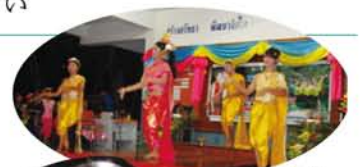
歓迎の踊り。う、美しい、美しすぎる。みんな真正銘の女の子。

「生き直し」について、やつぱり答えはわからない。しかし、僕が生き直しの学校で強く感じたことは「人は互いに生かし合いながら生きていく」ということだ。共同生