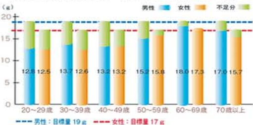
年代別食物繊維摂取量(平成20年国民健康・栄養調査結果の報告より)