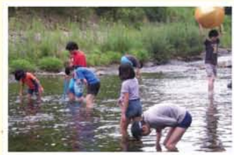
「何がいてるの？」子どもたちは川の中に夢中。

高学年キャンプの特徴は、朝昼晩の自炊メニューやプログラムもすべて子どもたちと話し合つて決めることです。出発までに3回集まりました。