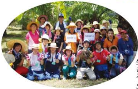
アブラヤシ農園にて農作業。我ががCグループ集合!

ともはいえ初日に学校を訪れ、パデイー(担当する子ども)が決まったときは不安で仕方がなかった。ここでの生活を早く終え、バンコクで