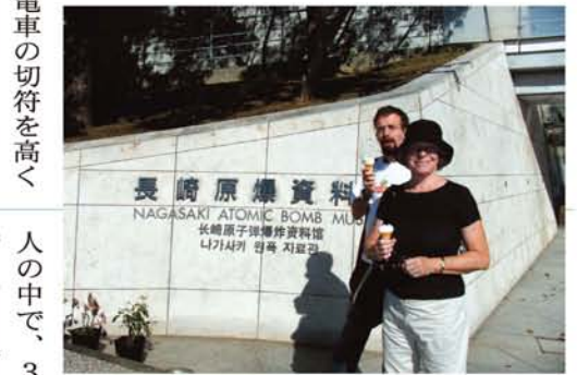
一年前、お母さんと長崎原爆資料館を訪問。「僕のお父さんは第二次世界大戦で日本の捕虜になって長崎で被爆してるから、お母さんと一緒に資料館へ行ったことは、とても意味のあることでした」

「犬」とか書くのと、すぐ「日本語がお上手ですね」と褒めるでしょ。でも外国人はみんな、簡単な日本語を使っただけで褒められることに飽きてるんです(笑)。そ