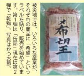
被災地では、いろいろな産業が、それぞれの商品に「希望」というラベルを貼り、販売を始めています。第1弾は、「伍話」現在第2弾で、「乾物」写真はかつお節。

アユス仏教国際協力ネットワーク関西事務局(西三国)では宮城県東松島市と石巻市で、檀家さんからの声を聞けるお寺と、被災者自身がボランティアとして自宅避難の方々からくみ取った情報を元に、後方支援をしています。7月には、支援物資運搬車「アユス1号」を寄贈。毎日、飲料水・食料・日用品等を自宅避難者・借り上げ住宅に住む人々に届けています。