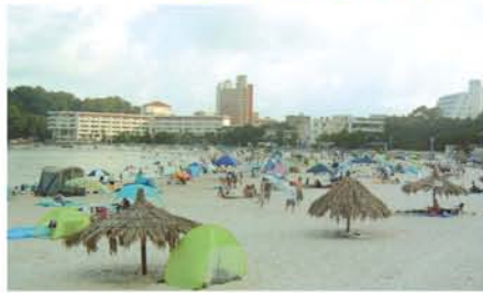
真夏の白良浜は、南国の風景。