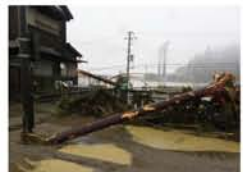
(問) 地域循環システムデザイン 研究所 ☎6151-0115

9月1日夜から三日三晩の大雨で、熊野一帯は甚大な被害を被った。写真は和歌山県田辺市本宮町の泥に埋まった168号線から本宮旧社地大斎原にかけて。洪水は家屋1階の天井近くまで達した。