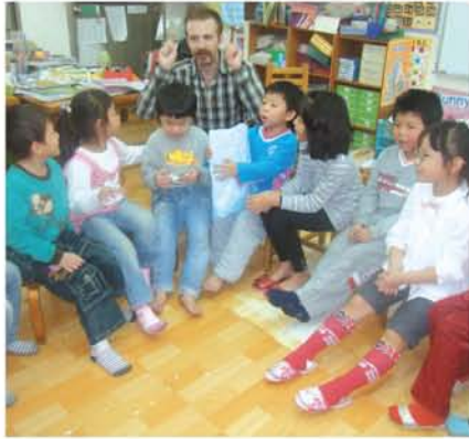
台湾の幼稚園で。英語を使ってレクリエーション。

面積：244,820Km 2 （日本の約0.6倍） 人口：6,157万人（2008年） 首都：ロンドン 公用語：英語 宗教：キリスト教他