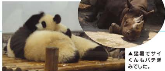
▲猛暑でサイギくんもバテみてした。

おじいちゃん、おばあちゃんへの感謝の手紙を取りまとめてくれており、私にも真似できないような立派な口上とともに手渡してくれた。今まで一番年下だった子が、親戚家族に赤ちゃんが生まれると、とたんにお姉ちゃん（お母さん？）顔になって、嬉々として世話を焼く姿にも目をみはった。今回は一泊だけのにぎやかな大家族体験だったが、人との密なやり取りから芽生える絆の大切さを実感できた旅だった。忙しい毎日、カリカリした時には深呼吸して今回の旅行を思い出してみよう。 多忙でも猛暑の中協力してくれた兄弟たちとそれぞれのパートナー、子どもたちに感謝！また白浜の穴場を教えていた「呑もお屋」常連のTさんご夫妻、ありがとうございます。お陰様で両親ともいい趣味と仲間に恵まれている。お父さん、お母さん、ぜひまた一泊行きましょか！