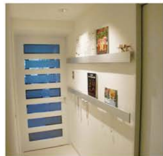
メーカーの規格品を使用しましたが、照明をひと工夫してカワイク演出。