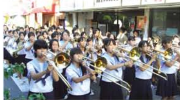
つばめ通りで、圧巻のパレード。

「大所帯やね」「かつこええよ!上手になつてる!」6月に、十三東本通商店会(つばめ通り)で夏のコンクールの課題曲を披露した十三中学校吹奏楽部が、9月13日、今度は成長した1年生も加わって、