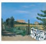
『初夏の麦畑と石垣』1920年 神奈川県立近代美術館蔵

◆開催中～11月23日(水・祝) 9時30分～17時 月曜休館(10/10は開館、翌10/11休館) 大阪市立美術館(天王寺公園内) 一般1,300円、高大生900円 【問】06-4301-7285(大阪市総合コールセンター)