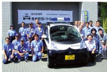
「安全なまちづくりに向けて、がんばります！」。9月8日、青色防犯パトロール車が区役所を出発！

「気いつけや、あんたのことやでそのバッグ」。東淀川高校・放送クラブの明るい声とともに、電気自動車でクリーンに区内を巡回している青色防犯パトロール車。もう見かけましたか？「安全なまちづくりとエコの促進」を合せて、大阪市が昨年からの導入を進め、淀川区では、9月8日に出発式が行われました。