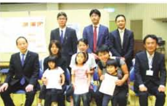
淀川区歯科医師会から、今年度の「淀川区8020達成者」さん(右)と、第60回「よい歯コンクール」の入賞者の皆さん(左)が表彰。8020達成者さんの最高年齢は、90歳。みんなで後に続きましょう!