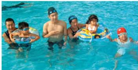
プールでスイミング。孫たちは教えられたわけでもないのに、泳ぎがおいしいちゃん似だったり、お母さん似だったり。

行で行った南九州の再現フィルムにするか、彼らが一度も行ったことのない北海道にするか。いろいろな壮大な案が出たが、大人数での移動はタイヘン。2歳の子どもの移動は、地元和歌山の白浜に決定。白浜なら小さい頃に連れていってもらった記憶もあるし。また両親が新婚旅行をスタートした思い出の場所だと、後で知った。 小さい時からしつかり者の妹が、お盆のど真ん中で取りにくい時期の宿を、持ち前の集中力で段取りしてくれた。渋滞が常態化している高速道路の移動スケジュールは、やんちゃ坊主だった弟が取り計らってくれた。長男の私はかけ声だけだったかな。アドベンチャーワールドでは、朝、ゲートが開くと同時に話題の双子のパンダちゃんコーナーに突撃。互いに鼻と頭を押し合い、顔相撲を取りながらゴロゴロ絡まり落ちる海浜&陽浜はとってモキユート。イルカショーでは、人と一心同体になって懸命に演技するイルカの姿に、久々に涙腺がうるうるきた。猛暑の中、動物君たちにも日傘を貸してあげたい気持ちだった。