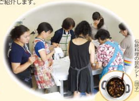
伝統料理の昆布シト(団子)

アイヌの人たちは自分たちの伝統文化や生活、言語、風習などを聞き、覚え代々語り伝えてきました。