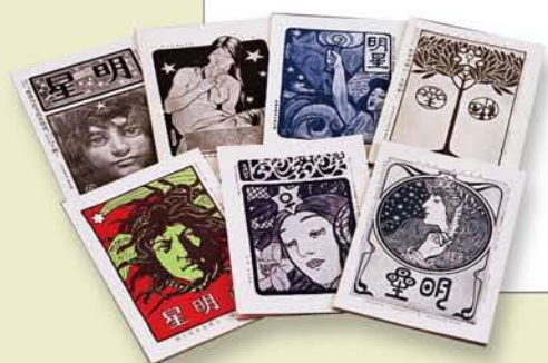
「明星」明治33(1900)年4月～明治41(1908)年11月 (復刻版、臨川書店刊)