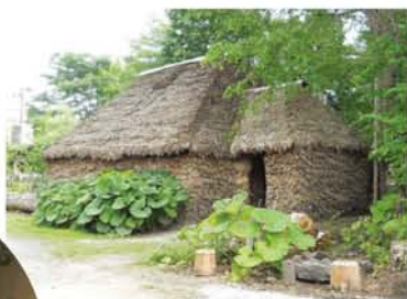
写真上: アイヌの伝統的な住居「チセ」と左は内部