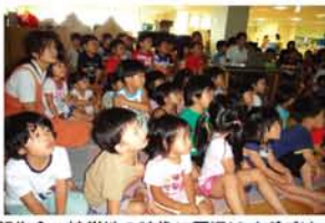
報告会。被災地の映像に園児はくぎづけ。

きっかけは、同園で使用しているダンボール遊具を扱う丸一興業から「被災地の子どもが喜ぶ物資を届けたいか」と誘われたこと。園長はすぐに賛成し、第1便は、福島県にダンボールの滑り台を。さらに2便では“遊び方”も一緒に届けようと、園長の息子さんも加わって、園の子どもたちと「どうしたら一番楽しめるか」を勉強。現地の動向も見ながら2カ月間準備を積み、6月29日～7月5日、宮城県を訪れました。「帰阪後報告会を行うと、知っているお兄ちゃんが実際に被災地にいる映像を見て子どもたちはその状況が身近に感じられたのか、自分たちと同じ歳のお友だちが大変ということも初めて意識したようでした。家に帰ってからも、『地震で建物が壊れるねん』と話す子や『避難訓練は大事』と言っていた子もいたそうです。ビルの中にある園として、『もしも』のことを考えることができたのも非常にためになりました」