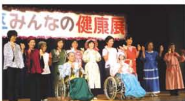
区健康づくり推進協議会(ほほえみ会)さんによる、着替えやすい、動きやすい「改良衣料」のファッションショー。「かわいいよー」と会場から声援が飛んでいました。