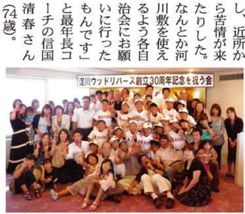
OBや歴代指導者、選手のお母さん、弟妹たちも参加。「仲良しウッド」の面々は、式典後の2次会も大盛況でした。

少年野球チーム「淀川ウッドリバーズ」が記念すべき30周年を迎え、プラザオーサカで「祝う会」を行いました。