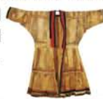
魚皮製衣履(樺太) ドレスデン民族学博物館蔵

◆10月6日(木)～12月6日(火) 10時～17時 水曜休館(11/23は開館、翌日休館) 国立民族学博物館(千里・万博公園内) 一般420円、高大生250円、中小生110円 【問】06-6876-2151