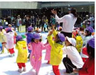
「わあ！降ってきた」。子どもたちのこにこ顔を撮影するため、保護者も一生懸命でした。雪だるまの肩に小さな雪だるまを乗せる子ども。

かれ、快晴の空から特殊な機械で雪が降ると、「きゃー、つめたい！」と子どもたちは大はしゃぎ。側では保護者が「けつこう降るなあ」と晴れ間の位置に避難。