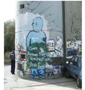
分難壁のあちこちに、平和と自由を願う落書きアートが描かれている。

で、通路の上には、アーケードのように網がはられています。なぜ、そこまでするのか?。夕方は、西エルサレムを少し歩きました。ここでは、イスラエルの人々が、ごくごく普通に生活し、パレスチナの人々に対して、それほど深い思いを持っているように思えません。そんな風景をみていると、お互い平和に暮らす事は、そんなに難しいことではないのでは?とさえ思えました。