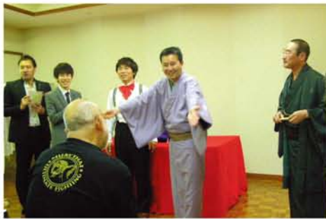
13日は、午後からよどが川柳もあるので、エンディングは芸人さんたちも川柳に挑戦。これは名物になりそう！