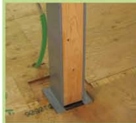
木造住宅の一部鉄骨補強

古い木造住宅の耐震補強では、主要な柱を抜き替えることはできません。当社では鉄骨で柱を巻いて補強したり、梁を鉄骨にしたりという工法で対処しています。