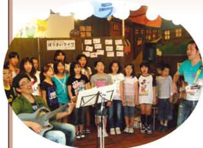
三津屋小学生の音楽クラブも出演。ザ☆直球サブライズのお2人と一緒に、ネット中継の向こうの顔を想像して、元気な声を送りました。