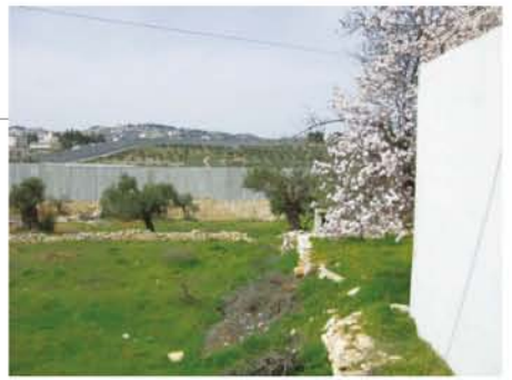
土地を横切る分離壁。手前は満開のアーモンドの花。

※アーユス…超宗派の国際協力NGO。仏教の精神に基づき 平和と人権に関する問題に取り組んでいます。