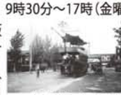
市内を走る二階つき電車 明治37～38年(1904～1905)頃

◆5月25日(水)～7月4日(月) 9時30分～17時(金曜は20時まで) 火曜休館 大阪歴史博物館(地下鉄・谷町四丁目駅) <常設展示観覧料>大人600円、高大生400円 【問】06-6946-5728 5組10名