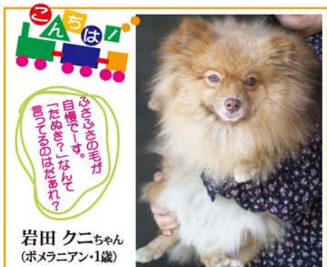
岩田クニちゃん (ボメラニアン・1歳)

9月2日に岩田家の家族になったから「クニ」人に会って、遊んで欲しくてジャンプ、ジャンプ！つい、張り切りすぎてねんざしちゃった。お散歩も大好き。「朝の4時頃から起こされるのよ」と、お母さん。やさしいお母さん、お姉さんにかわいがられて、シアワセだワン！