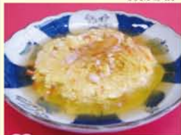
野菜が多めに入っているので、ボリューム感もあり、栄養たっぷり!