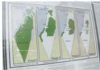
イスラエルの侵略分布図。緑色がパレスチナ。1947年、国連でパレスチナ分割決議案が可決されて以降、急速にイスラエル領土(白)が増えている。

初日は、身体障がい者と健常者が一緒に勉強できる、私立のアミラバスマスクールを訪れました。750人の生徒のうち、120人が身体障がい者です。ここでは、日本国際ボランティアセンターが支援している、「壁によって分断された地域での学校健診・保健教育」が実施されています。健康診断の様子を見学し、診療を受けた数十名の生徒の内2人