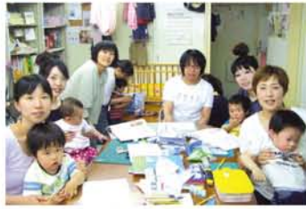
教室やサークルの先生もママさん。「育児の情報交換もできてうれしいです」

* 問*0120-415-810 http://clumpon.blog39.fc2.com/