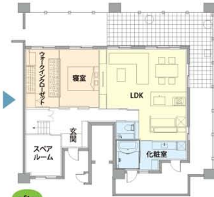
after 夫婦2人だけなので、広さは十分。生活を楽しむ間取りに変更しました。行動半径も大きくなったそうです。