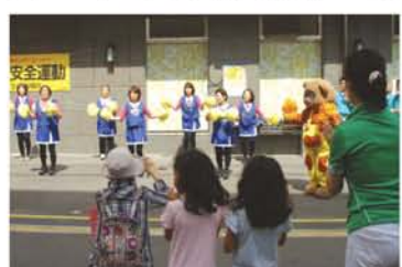
YMCAのメロディにのって踊るオーバンス。楽しいダンスにチビッコも夢中！

も展示されました。緊急救助隊の活動する大阪府警・広域の被災地で活動する大阪府警・広域の被災地で活動する大阪府警・広域