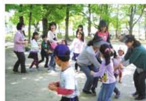
保護者がつくるトンネルにすっぽり。とうりゃんせも盛り上がりました。

よどがわおやこ劇場は5月7日、「幼児や低学年の子たちと親が交流する機会を」と、十三公園で「バルーンで遊ぼう」を開催。「初夏の暑さの中でも子どもたちは変わらず元気で、『はないちもんめ』をすると、じやんけんんで負けた組が、くや