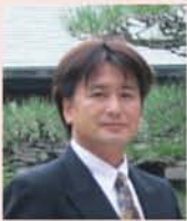
はくあい介護サポートセンター 所長