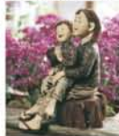
『いつも一緒に』2009年 人形写真撮影：後 勝彦

◆6月4日(土)～27日(月) 10時～20時(最終日は17時まで) 会期中無休 美術館「えき」KYOTO(JR・京都駅) 一般800円、高大生600円、小中生400円 【問】075-352-1111(ジェイ・アル京都伊勢丹大代表) 5組10名